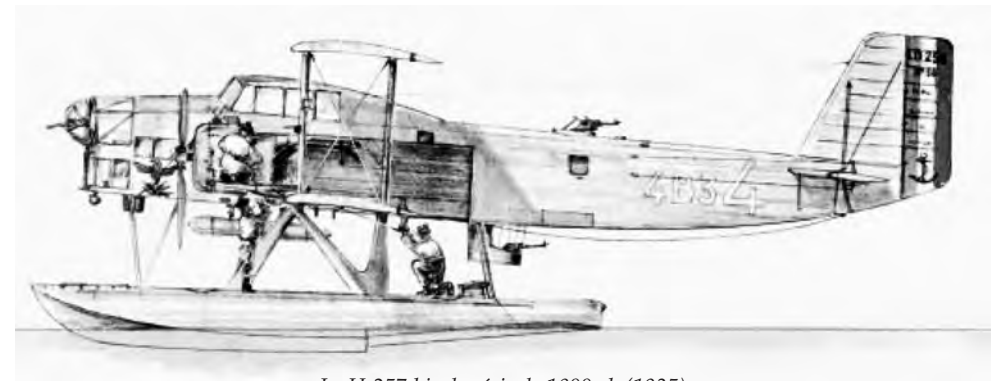
Le H-257 bis de série de 1800 ch (1935)