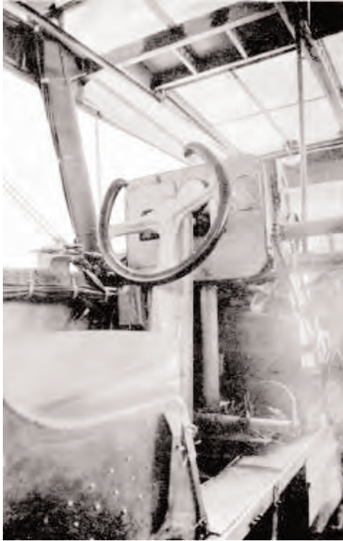
Poste de pilotage secondaire.

Cet avion a été dérivé de toute une série de torpilleurs bombardiers, mis en chantier dès 1938, de dimensions relativement importantes pour l'époque puisque, selon les modèles, l'envergure se situait plus ou moins autour de 25 mètres, la longueur était d'environ 17 mètres et la hauteur à la dérive était de plus de 6,50 mètres 2 .