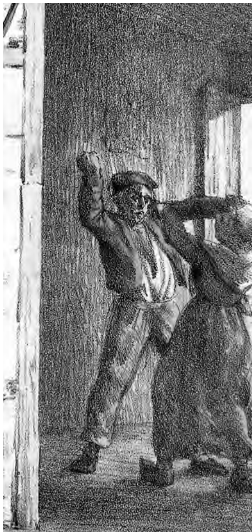
Violence conjugale Lithographie de Lenglumé d'après l'œuvre de Pigal (XIX e siècle)

sement l'arrivée du garde champêtre et de plusieurs personnes les fait lâcher prise et s'enfuir.