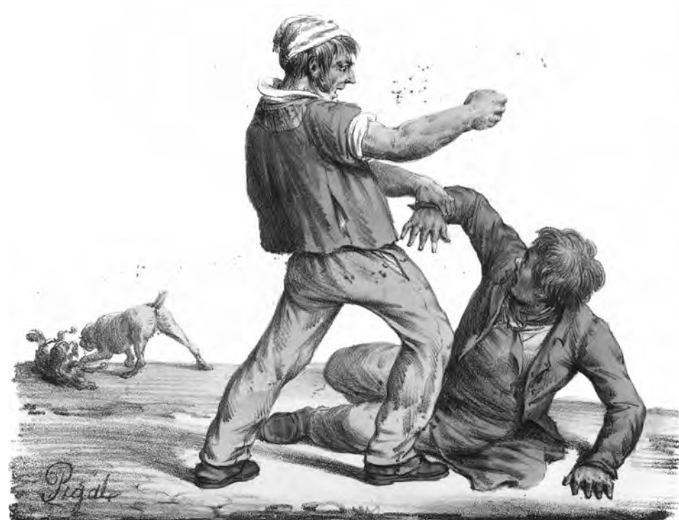
La raison du plus fort est toujours la meilleure Lithographie de Lenglumé d'après l'œuvre de Pigal (XIX e siècle)

Même chose en 1847 : trois militaires de 21 e léger attaquent des jeunes gens d'Aussonne (l'un d'eux ne comprend même pas le français) et de Blagnac, les menacent avec leur sabre. Heureusement