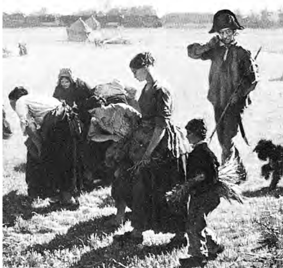
Le garde champêtre surveille les femmes et les enfants glanant dans un champ d'éteules. Détail d'un tableau de Jules Breton (1827-1906) : les Glaneuses.

Tout au long du XIX e siècle, le garde champêtre assure la surveillance du territoire communal des Quinze Sols au quartier du Port en pas-