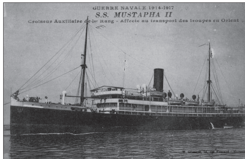
▶ Mustapha II

Je prends du quina chaque jour, le flacon diminue mais je crois pouvoir aller jusqu'à Salonique où, là, j'aurai de la quinine.