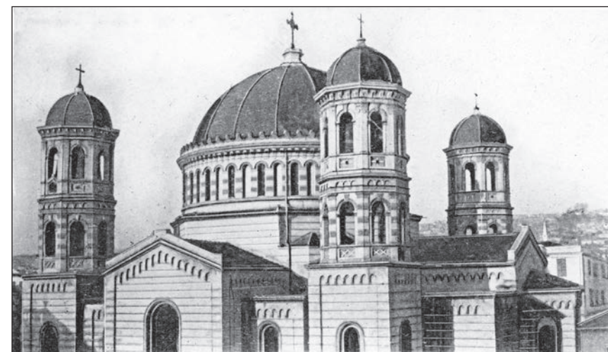
12. SALONIQUE — La Métropole