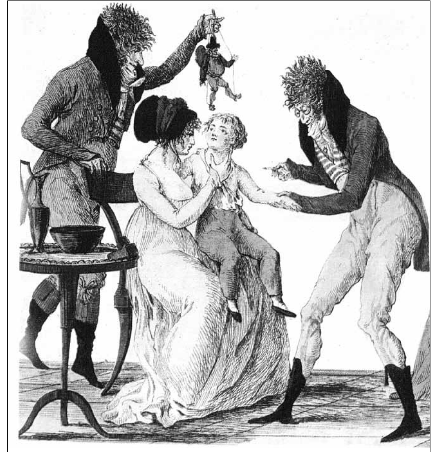
▶ Vaccination anti-variolique vers 1800