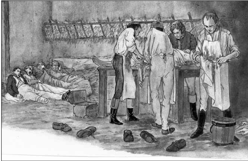
◀ Hôpital militaire Premier empire par Bernard Coppens

de la petite vérole. » Laissons le mot de la fin au docteur Louis Campan. A propos de Tarbès, il écrit : « La vaccination doit tout à un chirurgien, comme s'il fallait un tempérament chirurgical pour vaincre les timidités de la médecine. »