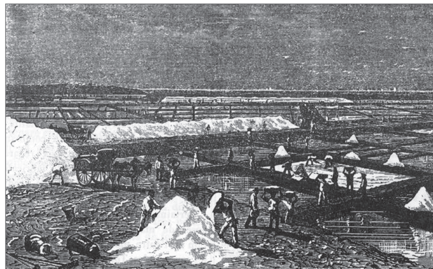
► Le travail du sel

Pour comprendre l'importance du problème, il faut tout d'abord rappeler la place du sel dans la vie quotidienne des gens d'autrefois, sans négliger, d'ailleurs, sa signification symbolique. A Rome, le mot « salarium », qui signifie « ration de sel », avait pris par extension celui de traitement, de salaire.