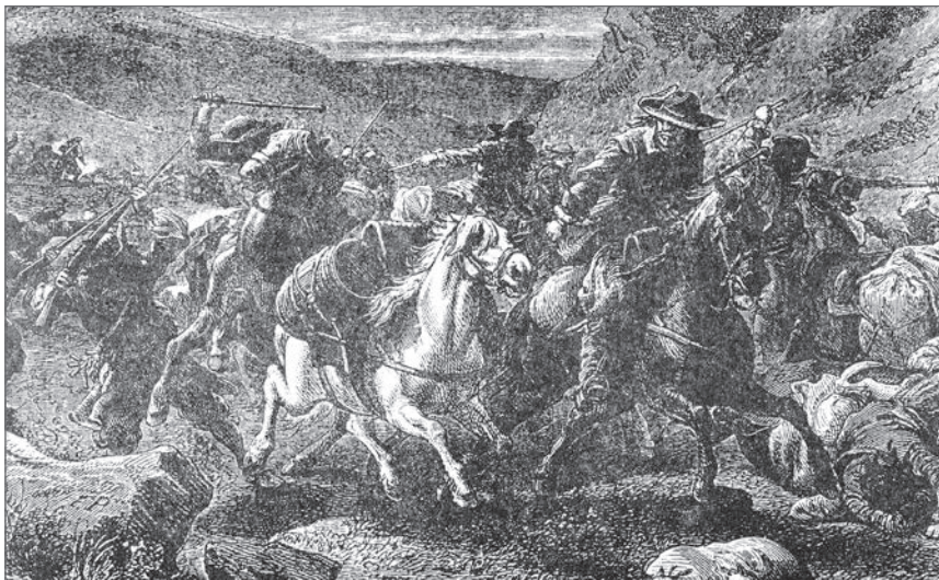
◀ Attaque d'un convoi de sel

La riposte des autorités est évidemment très brutale. A certaines époques, les responsables firent fabriquer le produit de manières différentes selon les régions. Le poids, la forme, la grosseur des blocs de sel (les « salignons ») forme sous laquelle le produit circulait, variaient au départ des marais salants ou des salines, ce qui permettait d'en contrôler plus facilement la provenance. Surtout, les agents de la gabelle étaient autorisés à accomplir