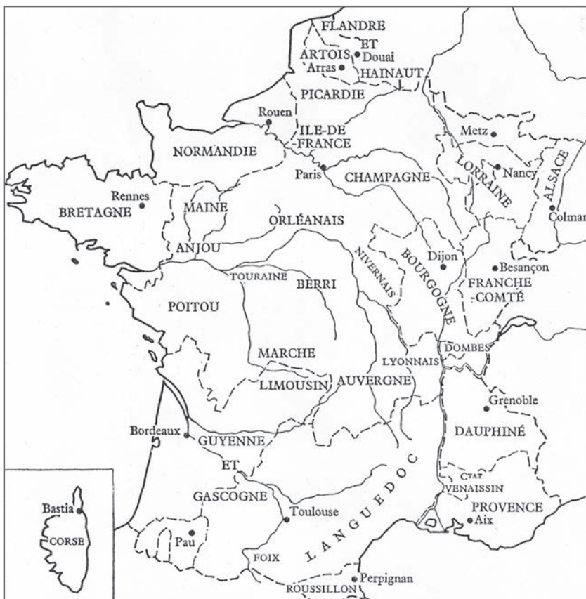
◀ Parlements et Conseils souverains en 1789

Le problème de la gabelle – et c'est ce qui frappe le plus les contemporains – était caractérisé par d'étonnantes disparités. Cette situation, qui n'est d'ailleurs pas particulière à la gabelle, s'explique parfois par des raisons d'ordre historique, liées à la situation particulière d'une Province lors de son rattachement définitif au Royaume. Mais la division du Royaume en zones de statuts différents – c'est la raison pour laquelle le Cahier de Doléances de Blagnac demande l'uniformisation des gabelles – s'explique