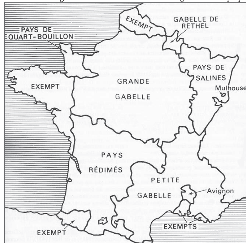
▶ Carte de la gabelle en 1789. Référence : Lexique historique de la France d'Ancien Régime. Opus cité, p. 149.