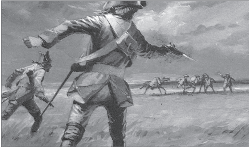
◀ Les faux sauniers