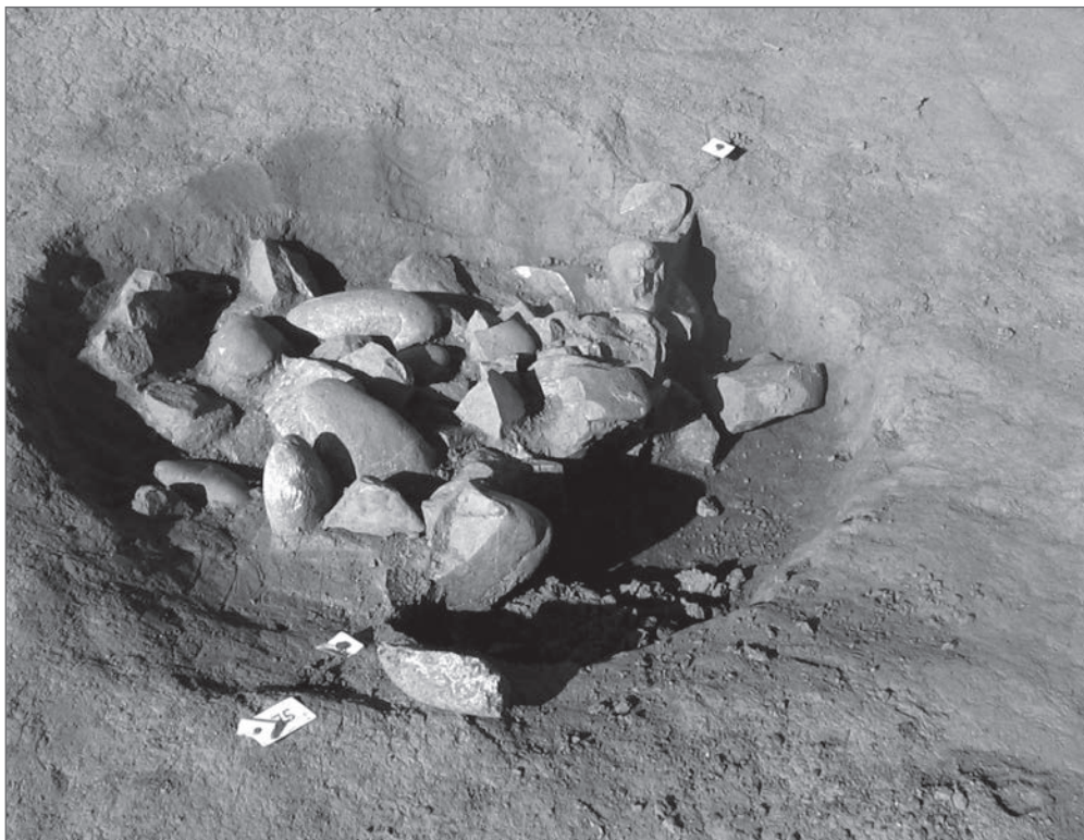
celui de la ferme de Raspide 1 à Blagnac datant du Second âge du fer.

De l'époque gauloise (fin du II e siècle, début du I er avant J.-C.), quatre petites fosses et une structure regroupant un puits de 2,2 m de profondeur, une cavité de 4 m sur 5 m et deux petits fours à usage domestique sont les vestiges d'un habitat un peu plus important.