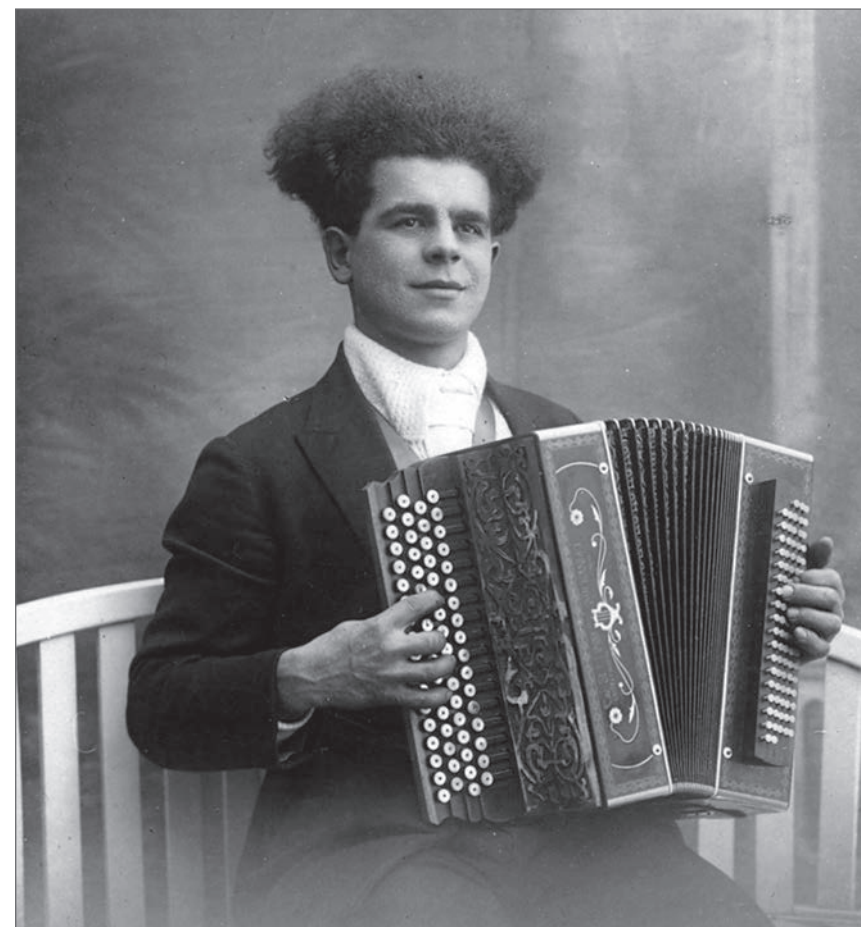
► L'accordéon, instrument typique du nord de l'Italie (Famille Chemello)

allaient chercher les feuilles de mûriers dans des bosquets à plusieurs kilomètres de la ferme afin de nourrir les vers. Les cocons étaient ensuite apportés à un grossiste, à la Halle aux Grains à Toulouse. Cela faisait un complément de revenu.