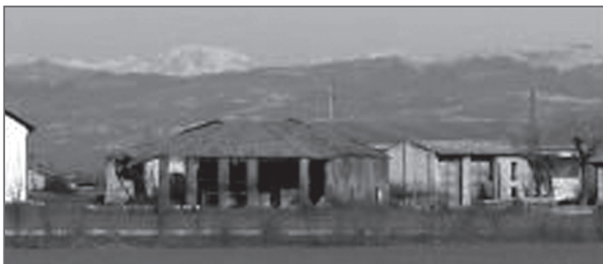
◀ Une ferme de la Vallée du Pô près de Concordia

L'un des critères avancés par les responsables du Sud-Ouest, est que, afin de faciliter l'intégration, on cherchât plutôt dans des régions autant que possible proches des nôtres en ce qui concerne l'agriculture : techniques d'exploitation, productions de produits et d'élevage, paysages au sens géographique du terme.