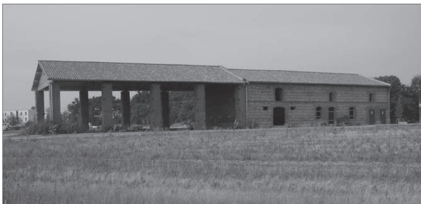
◀ La ferme de Barricou, rénovée, à Blagnac