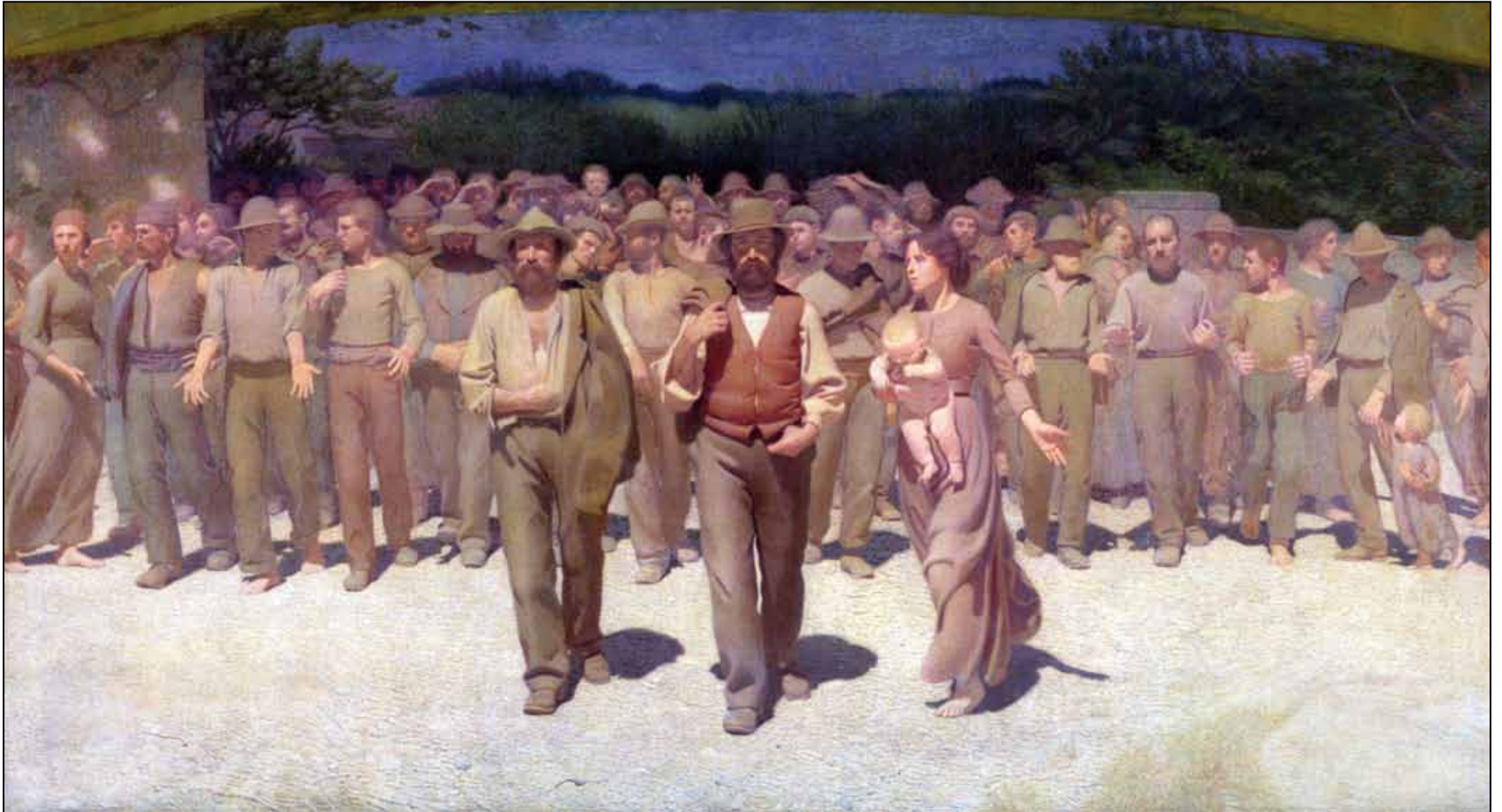
Giuseppe Pellizza da Volpedo Il Quarto Stato (1901)

Le « Quart-Etat » : Manifestation de la faim et de la misère du sous-prolétariat agricole de la vallée du Pô au début du XX e siècle.