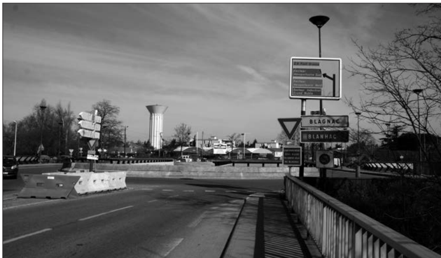
◀ 2009 : le rond-point dénommé Jean Maga

Pour la réussite du Plan d'Urbanisme, il négocie avec diplomatie les acquisitions de terrains indispensables aux nouveaux quartiers : Ritouret, Grand-Noble, aux nouveaux lotissements : Pons, Coucourou, etc. Il anticipe leurs dessertes et celles des réalisations sportives, culturelles, sociales : piscine, patinoire, Odyssud, groupes scolaires, crèches... sans oublier celle