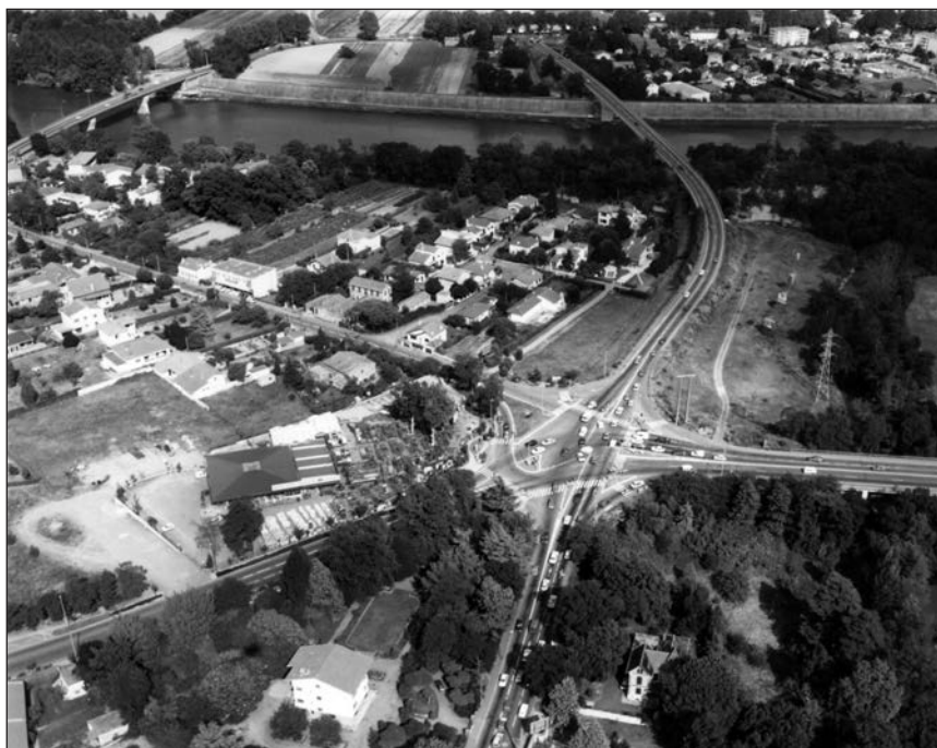
◀ 1988 - Le grand carrefour