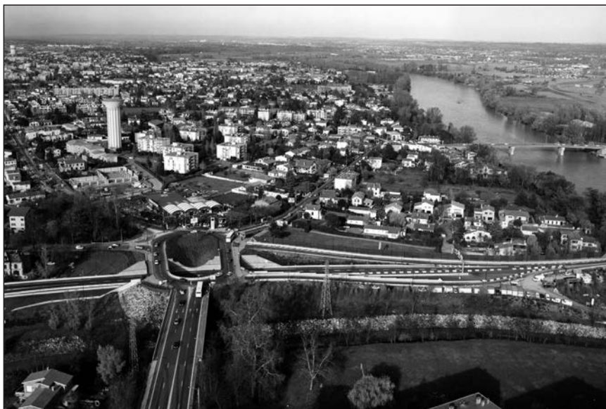
◀ 1996 - le rond-point