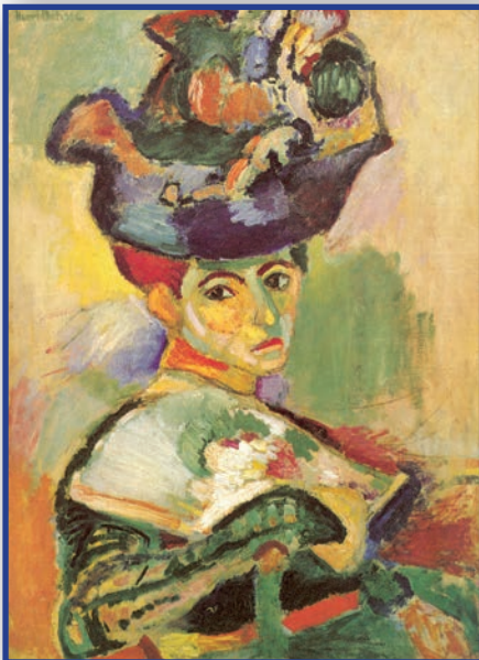
La femme au chapeau , 1905, San Francisco, collection Haas