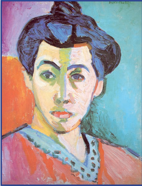
Portrait de Madame Matisse, dit La raie verte , 1905, Copenhague, Musée Royal des Beaux-arts, collection J. Rump