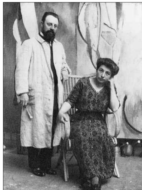
► Matisse et Madame Matisse dans l'atelier d'Issy-les- Moulineaux - mai 1913