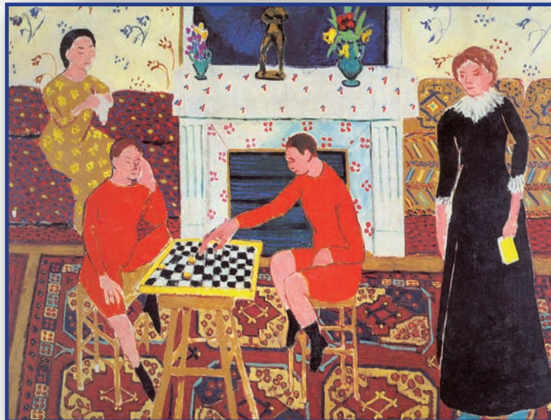
La famille du peintre , 1911, Léningrad, Musée de l'Ermitage