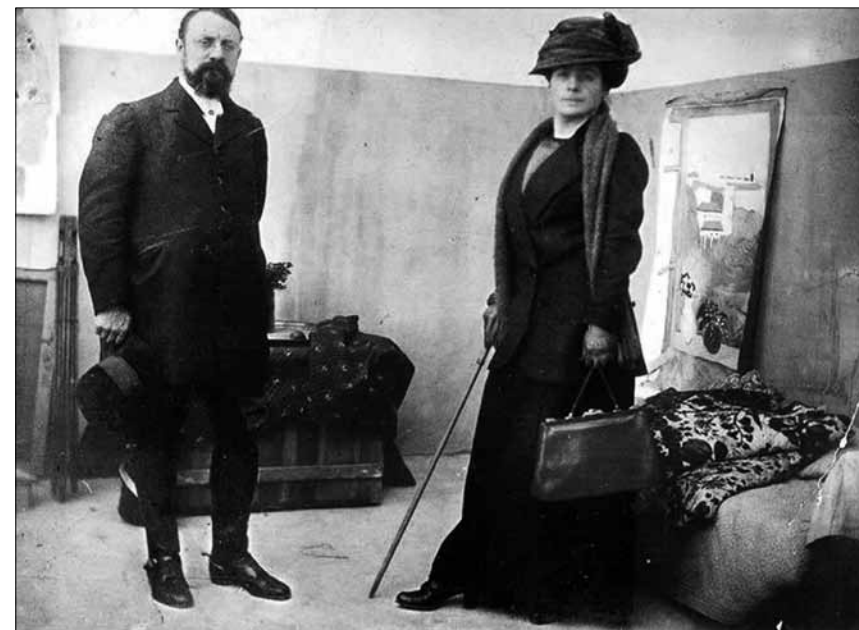
► Henri Matisse et Amélie pendant leur séjour au Maroc - 1913

Il ne travaille plus que pour lui, il se sent sauvé. Ajaccio est l'endroit rêvé. Henri va s'y sentir chaleureusement accueilli et accepté, et Amélie s'épanouira au milieu de ces Méditerranéens dont la fierté, la susceptibilité et le dévouement passionné lui ressemblent tant.