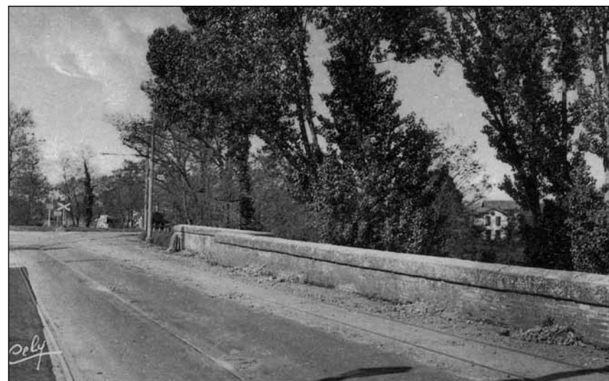
► CPA 285 Cely

du Touch). Le plus ancien document, daté du 14 septembre 1613, signale que le charpentier Guillaume Marchal reçoit mission de réparer le pont à bonnes tuiles (briques) sur une longueur de dix cannes (17,95 m) et une largeur de quatre pans (0,89 m). D'autres réparations seront effectuées en 1622, 1661 et 1665. En 1684, le devis n'est pas plus explicite mais il s'accompagne d'un croquis donnant la longueur totale du pont : trente huit cannes (68,25 m), ainsi que sa silhouette : quatre arches en arc brisé de dimensions inégales