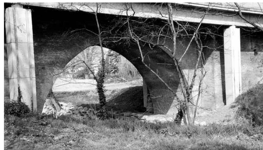
► Le pont du Touch - Avril 1992

Il supporta et supporte encore avec courage et sans défaut le trafic routier de la circulation moderne.