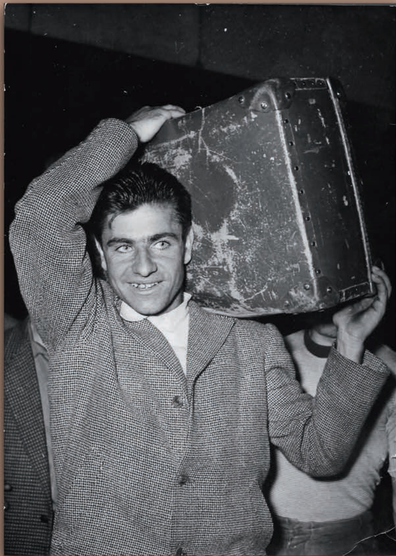
Georges Gay en 1955 - Départ pour le Tour de France