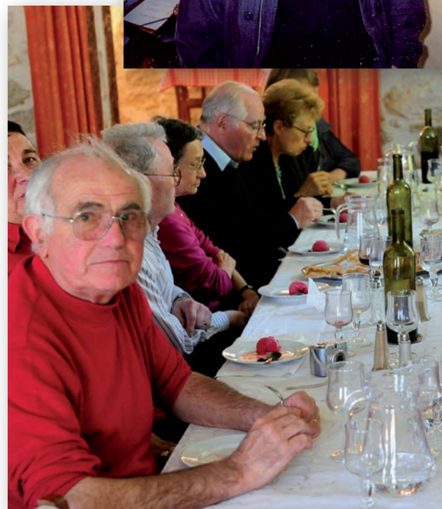
... en voyage d'étude à Gramont (Gers)