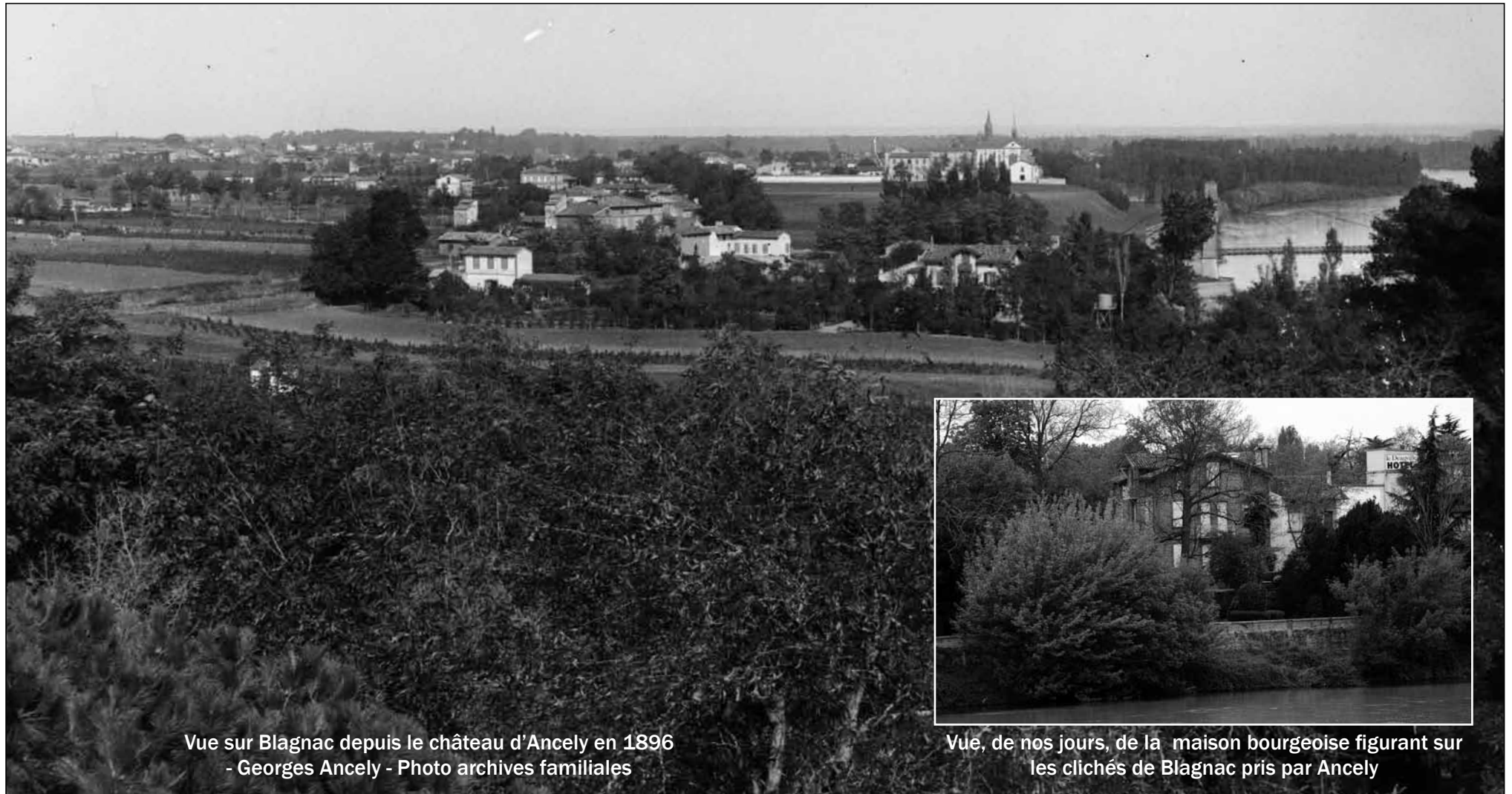
Vue sur Blagnac depuis le château d'Ancely en 1896 - Georges Ancely - Photo archives familiales

On aperçoit l'arche du pont mis en service en 1844 ainsi que le monastère construit sous le Second Empire et la maison bourgeoise en bord de Garonne.