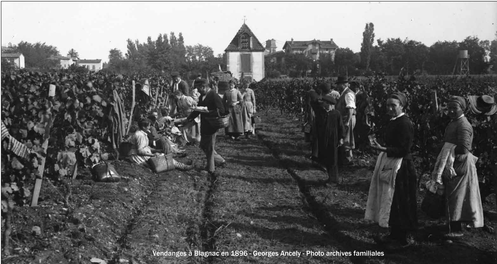
Vendanges à Blagnac en 1896 - Georges Ancely - Photo archives familiales

La maison bourgeoise semble être le seul édifice blagnacais en amont du pont dont on aperçoit, une fois de plus, l'arche d'entrée. Ce cliché confirme l'importance de la culture de la vigne à la Belle Époque en pays toulousain. Les souvenirs de témoignages familiaux recueillis par nos amis Jean-Louis Rocolle et Georges Lapoutge confirment la participation régulière de Blagnacais aux vendanges du domaine d'Ancely.