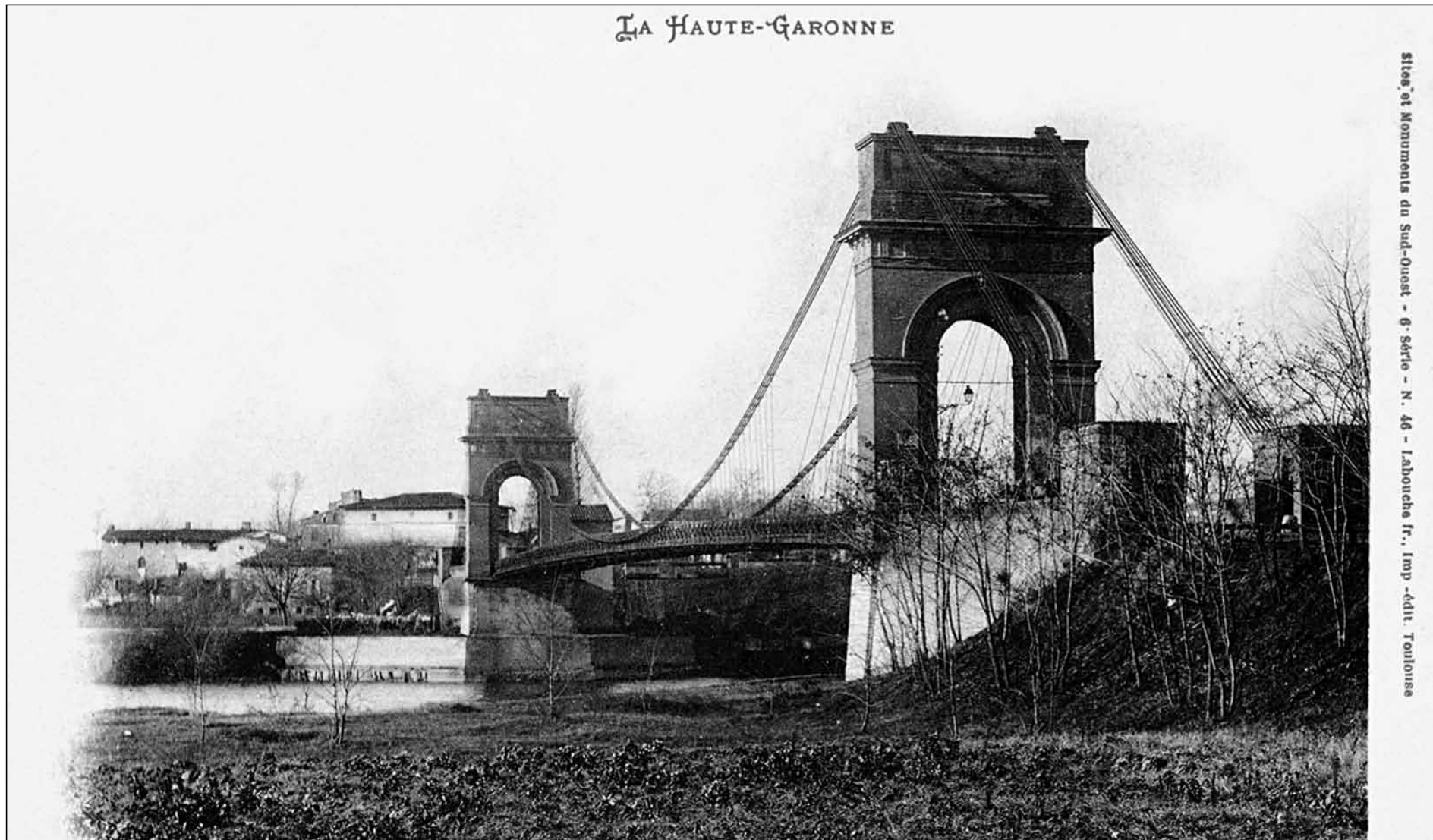
CPA - Premier pont de Blagnac sur la Garonne