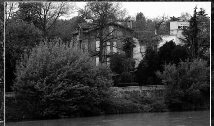
Vue, de nos jours, de la maison bourgeoise figurant sur les clichés de Blagnac pris par Ancely