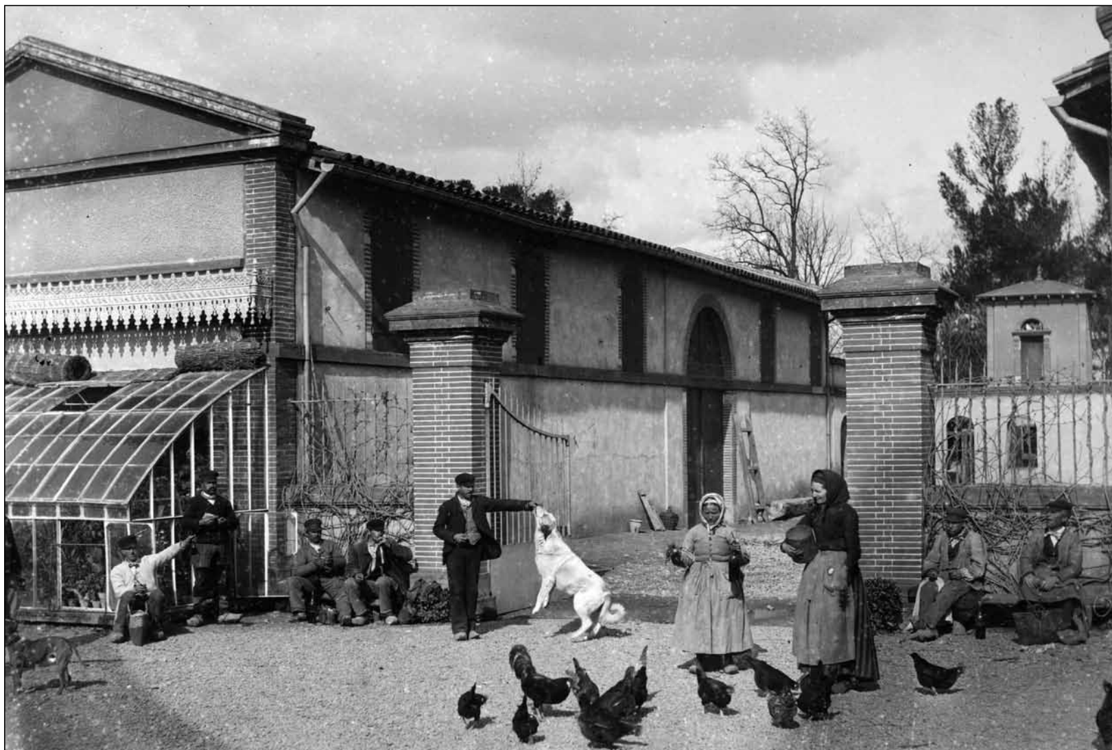
Domaine d'Ancely - Groupe de paysans en 1886 - Georges Ancely - Photo archives familiales

Chiens, ânes, volailles et chevaux font encore partie du paysage habituel des habitants des campagnes. Pour l'essentiel, leur univers n'est guère différent de celui des paysans du siècle précédent.