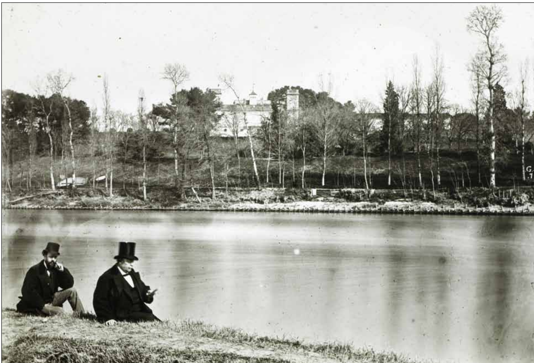
Le château vu de la rive droite de la Garonne en 1879 - Georges Ancely - Photo archives familiales