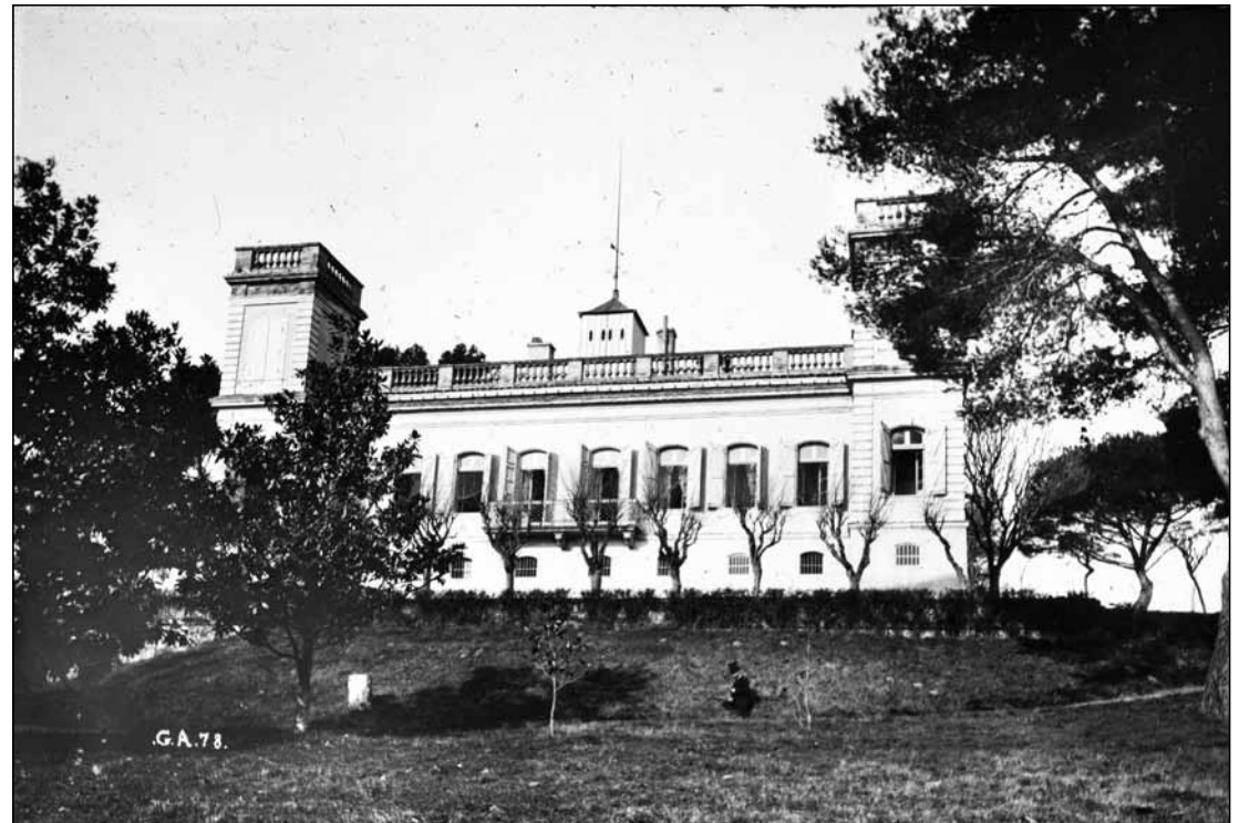
Le château vu de la rive de la Garonne en 1879 - Georges Ancely - Photo archives familiales