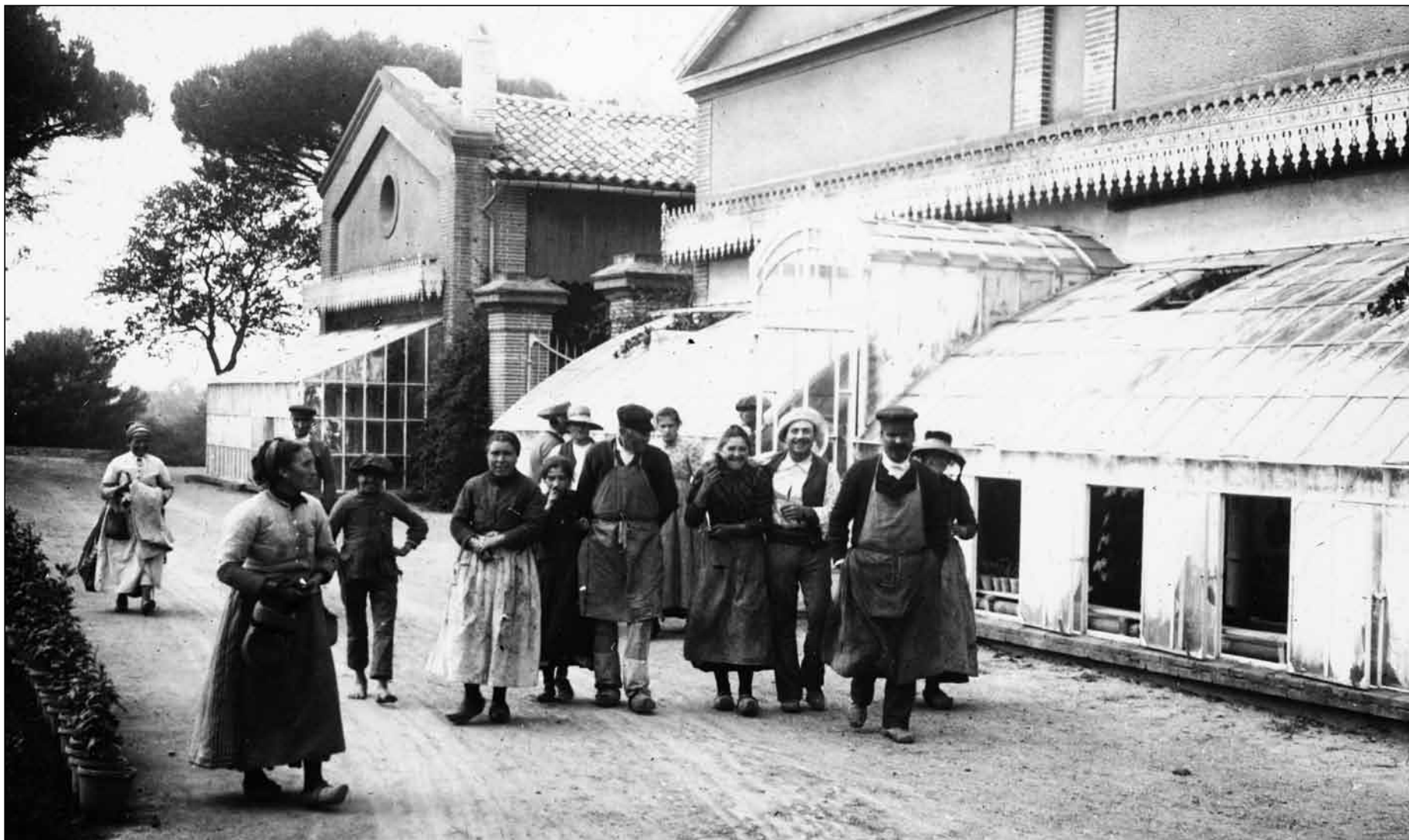
Domaine d'Ancely - Groupe de joyeux paysans en 1896 - Georges Ancely - Photo archives familiales

La bonne humeur est perceptible chez les paysans photographiés par Georges Ancely. La Belle Époque est une période marquée par une certaine joie de vivre. Le jeune garçon représenté à gauche du cliché deviendra-t-il, dix-huit ans plus tard, l'un des poilus de la Grande Guerre ? Cela est malheureusement très probable.