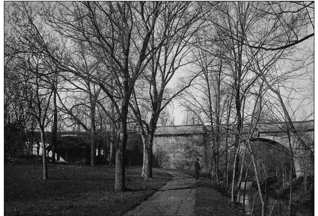
Le pont de Blagnac sur le Touch en 1883 - Georges Ancely - Photo archives familiales