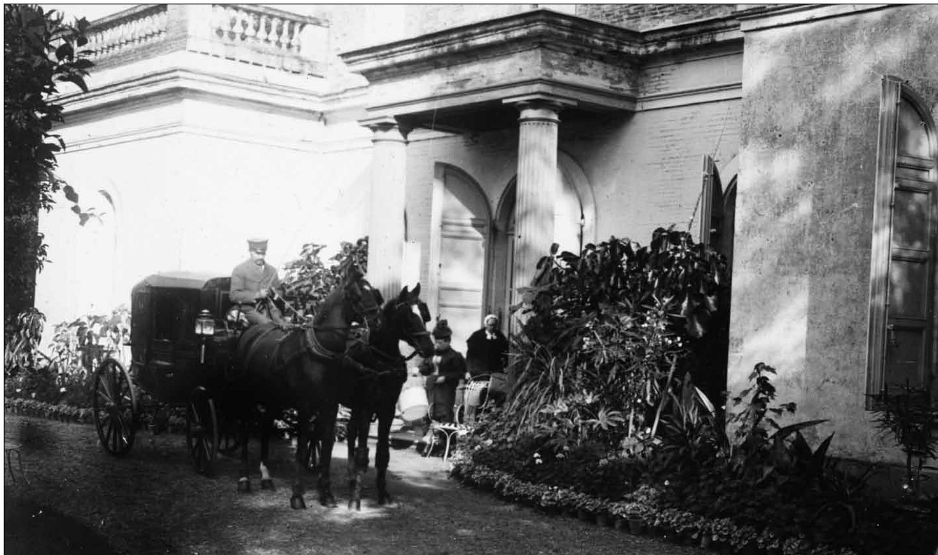
Calèche devant l'entrée du château en 1895 - Georges Ancely - Photo archives familiales

Le crépuscule du transport hippomobile s'annonce. Après plus de vingt siècles de bons et loyaux services, chevaux et bourricots vont bientôt inexorablement disparaître au profit des véhicules à moteur.