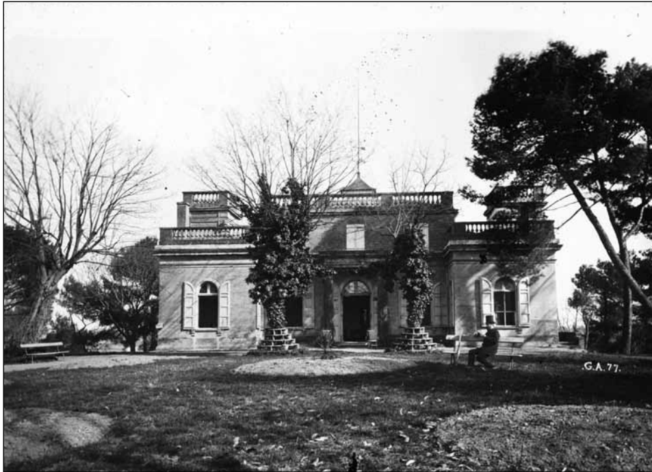
L'une des façades du château en 1877 - Georges Ancely - Photo archives familiales