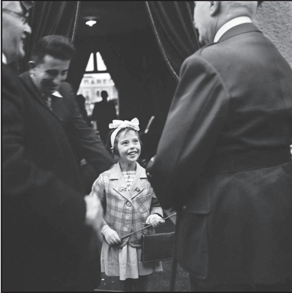
La petite fille et le Maréchal Pétain