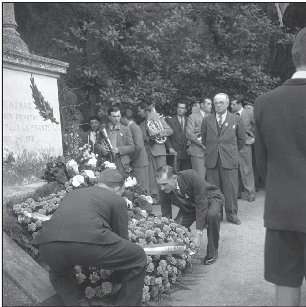
Cérémonie célébrant le retour des prisonniers de guerre (11 mai 1947)