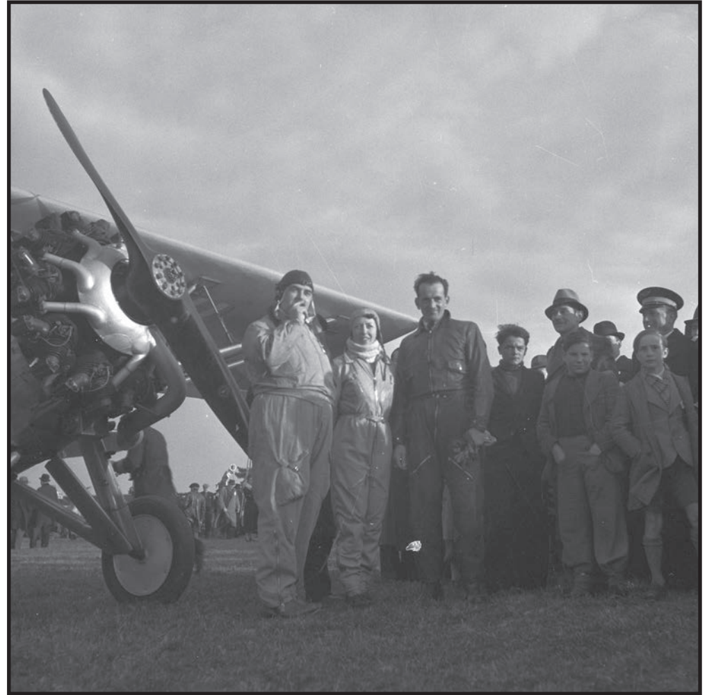
Trois des vedettes du meeting aérien