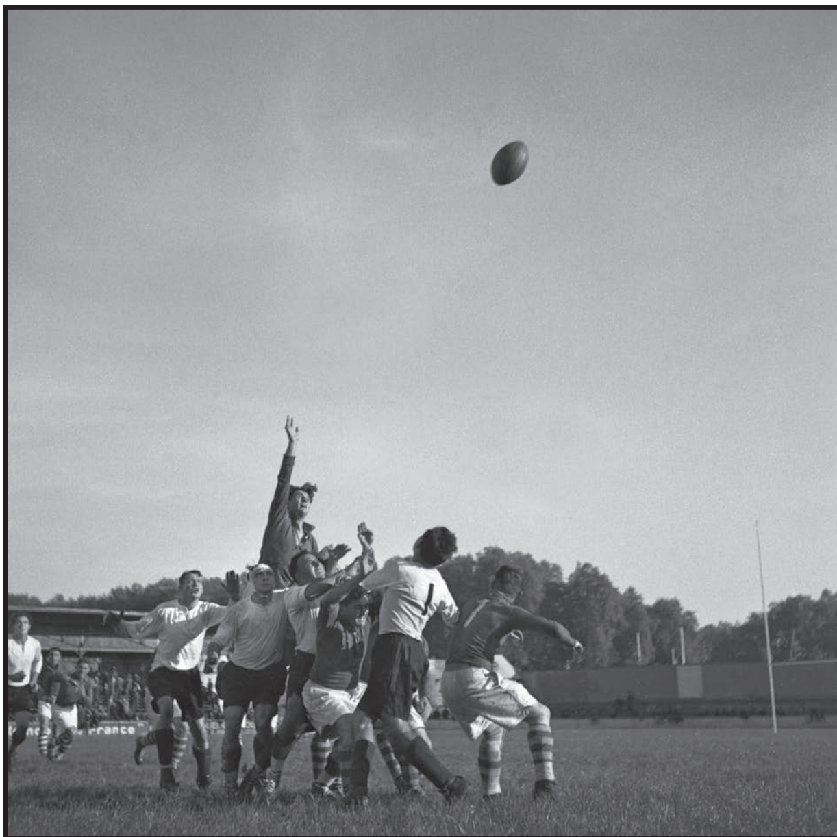
Le match de rugby à Ernest Wallon (octobre 1937)