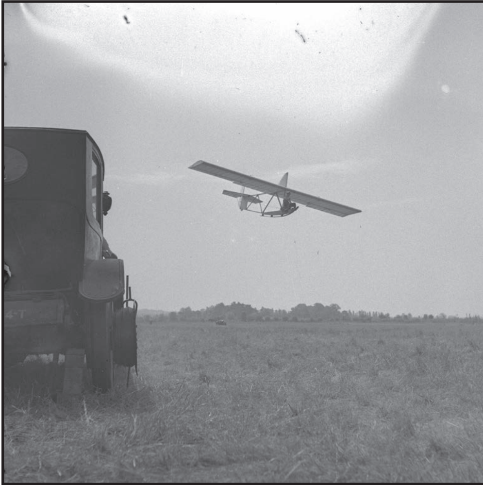
Un planeur rudimentaire en vol