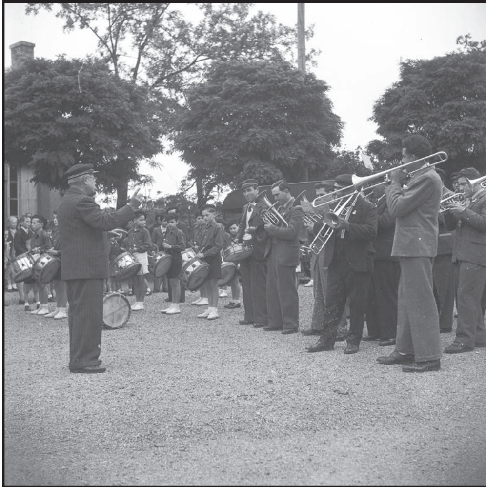
La clique et l'Union musicale