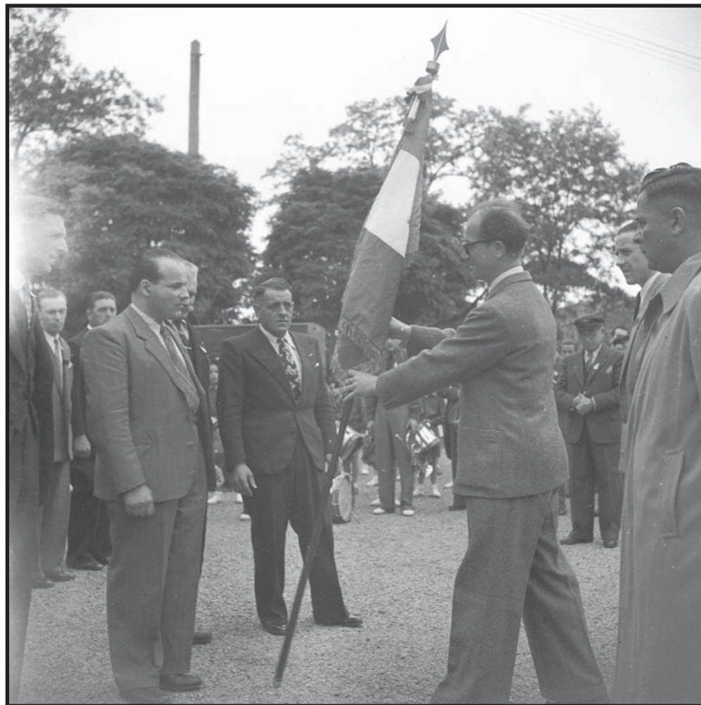
La remise du drapeau