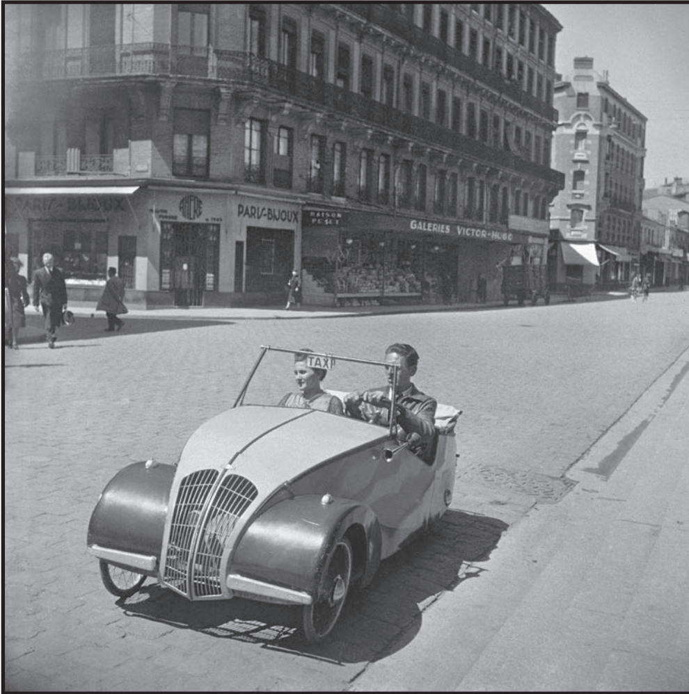
Vélo taxi ou "L'auto à pédale"