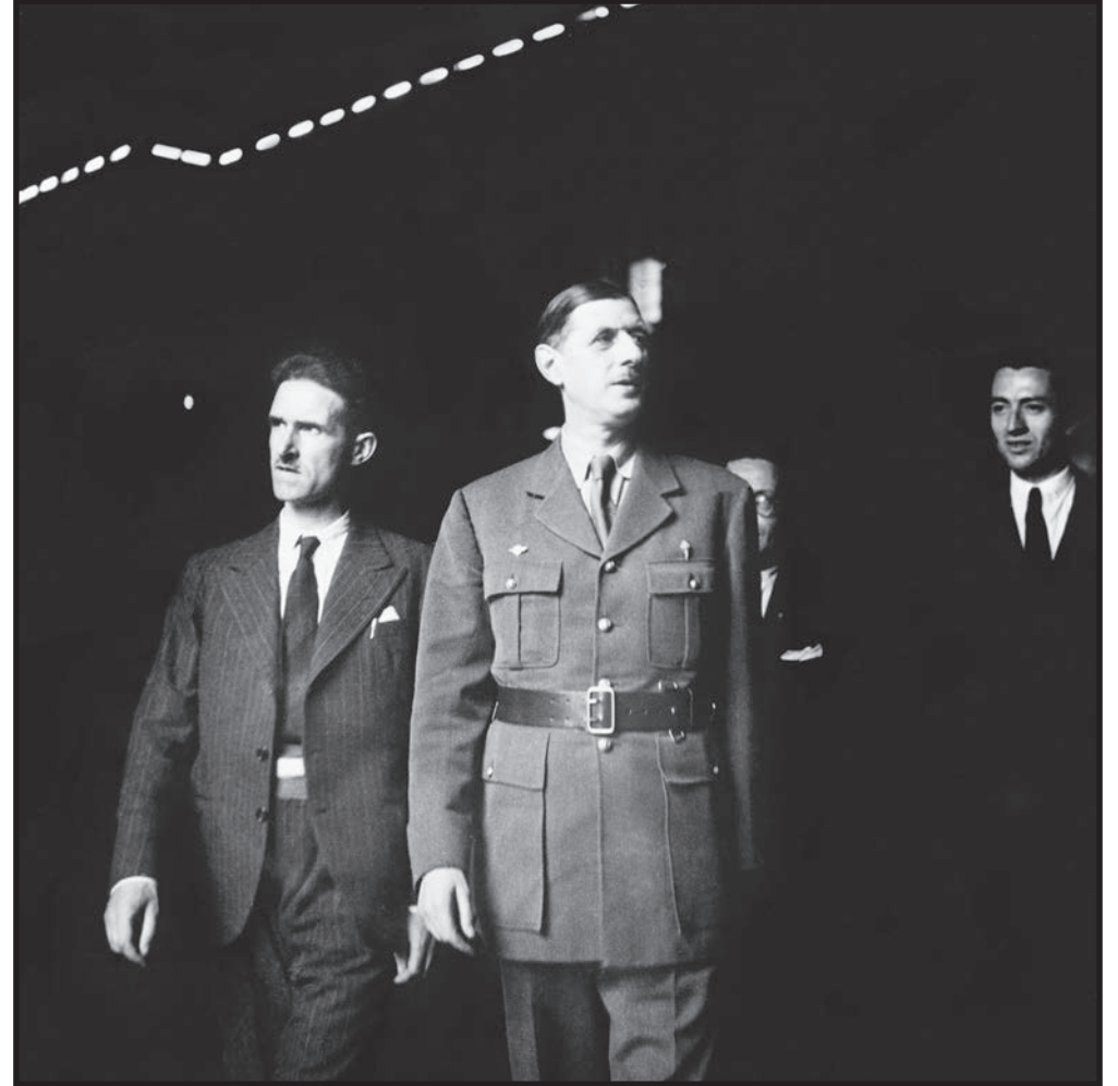
De Gaulle et Badiou, maire provisoire à la Libération (16 septembre 1944)