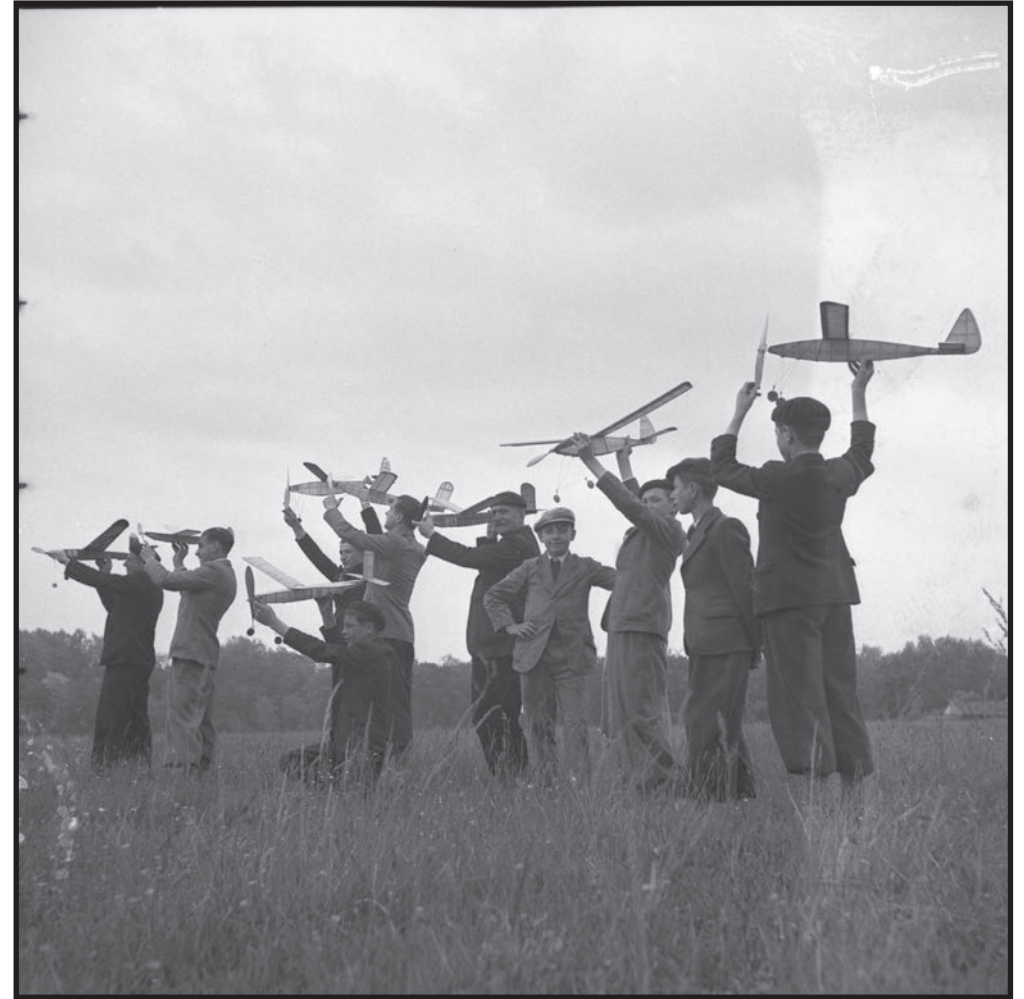
Les jeunes aéromodélistes