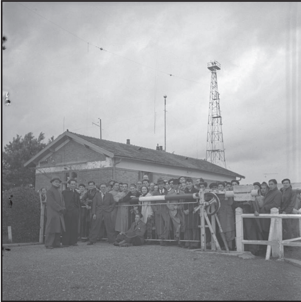
Les spectateurs se pressent devant la barrière d'accès au terrain