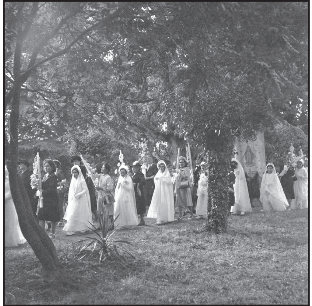
La procession dans le parc