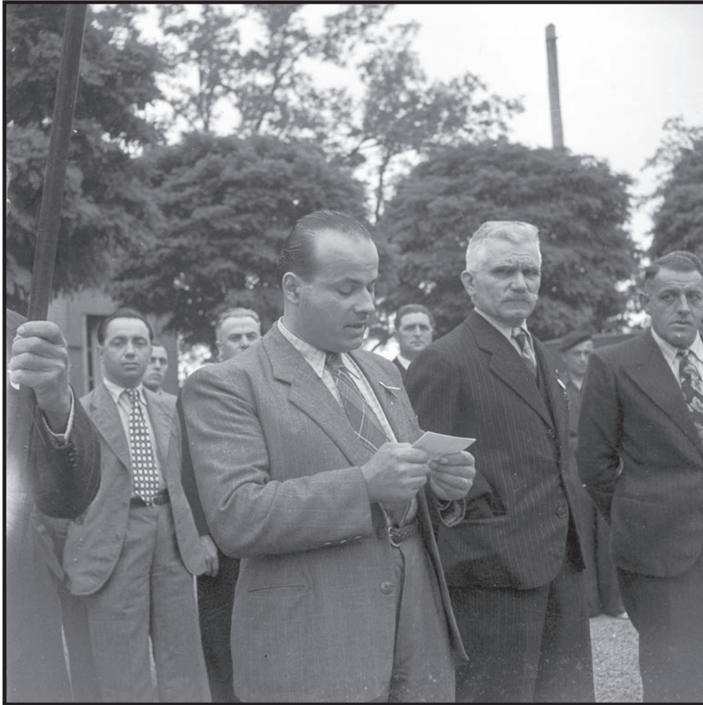
Discours des autorités locales