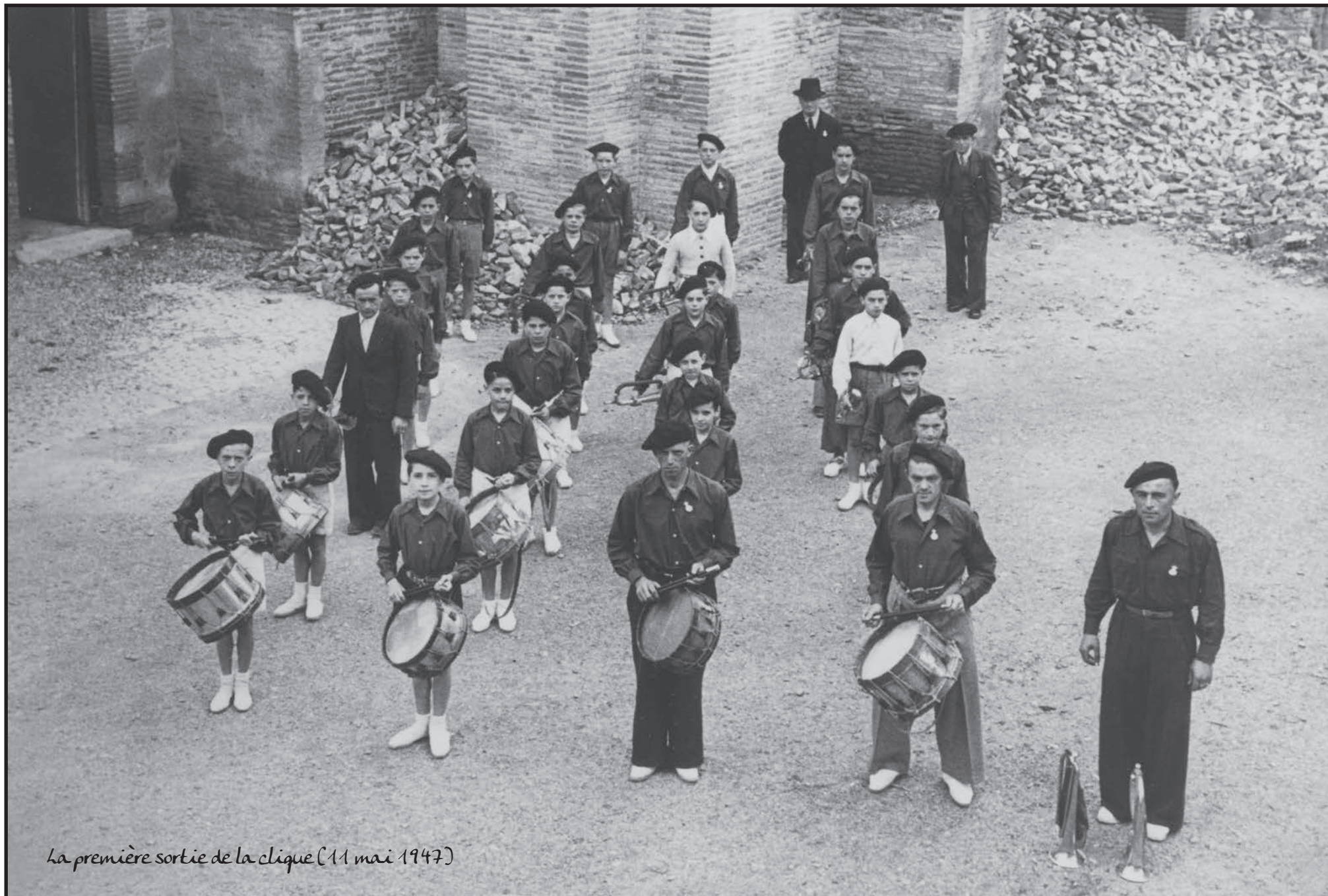
La première sortie de la clique (11 mai 1947)