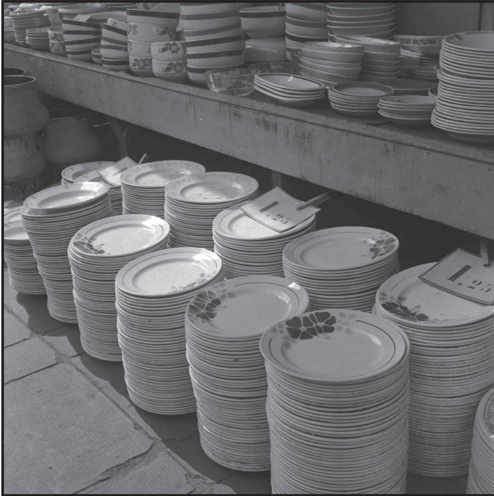
La pile d'assiettes