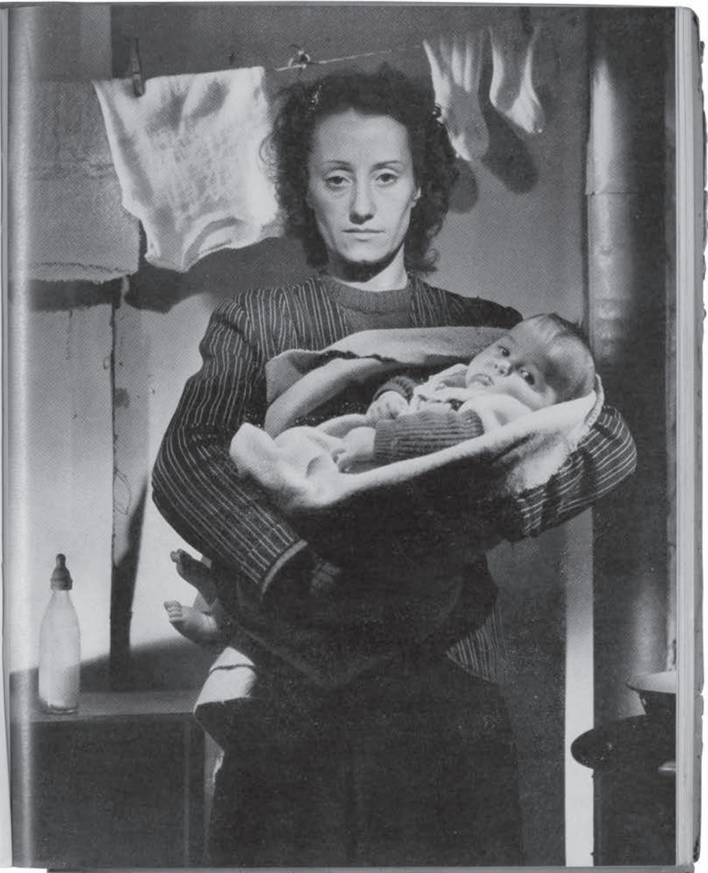
Transformation d'une photo de Lucien Lorelle pour une affiche destinée à la Croix-Rouge