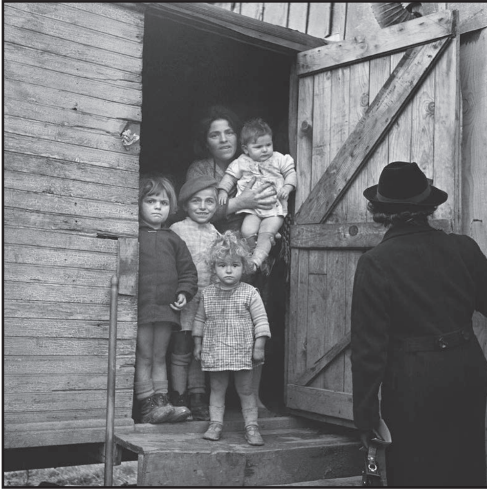
La visite de l'infirmière