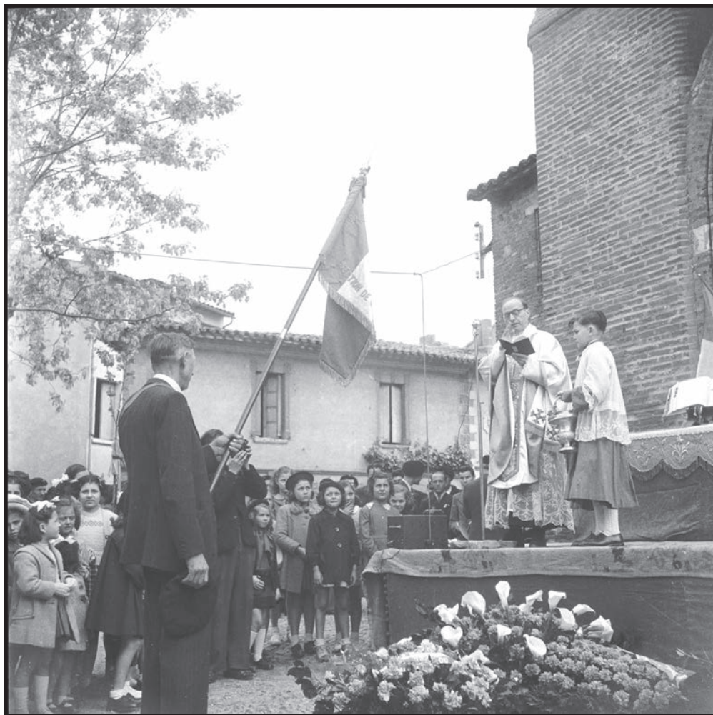
Les enfants devant l'église