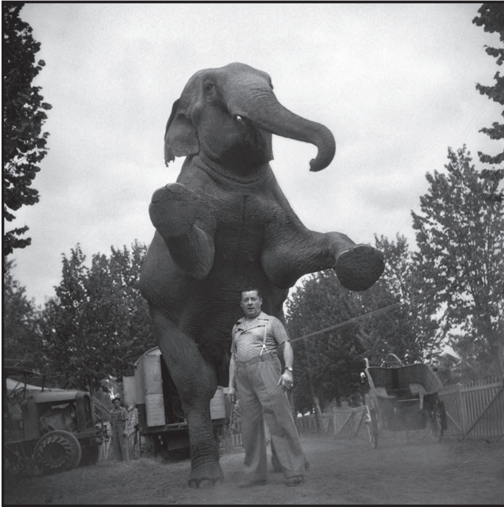
L'éléphant du cirque Debureau