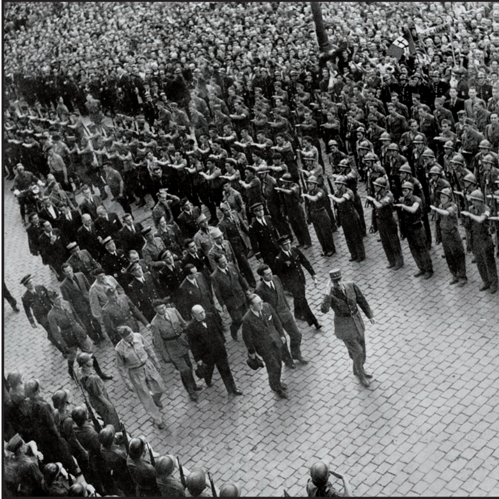
De Gaulle à Toulouse