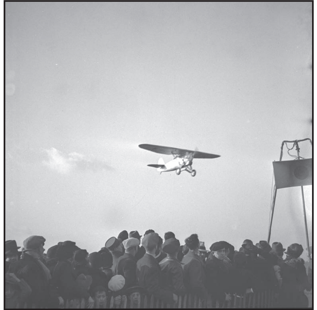
Doret survole la foule ; deux jeunes enfants, désolés, ne voient rien derrière le mur de dos des adultes