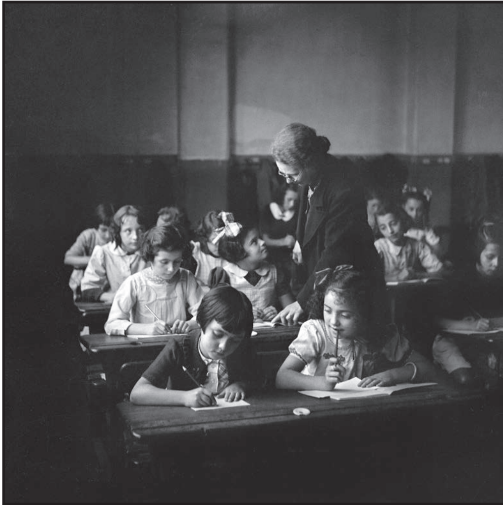
La rentrée des classes