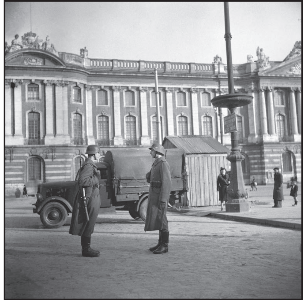
La relève de la garde