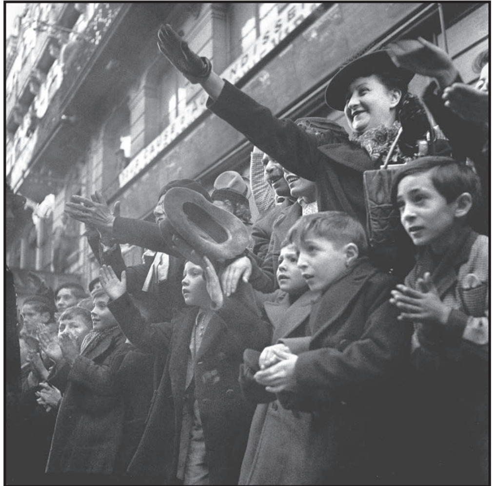
"Maréchal, nous voilà !" (1941)