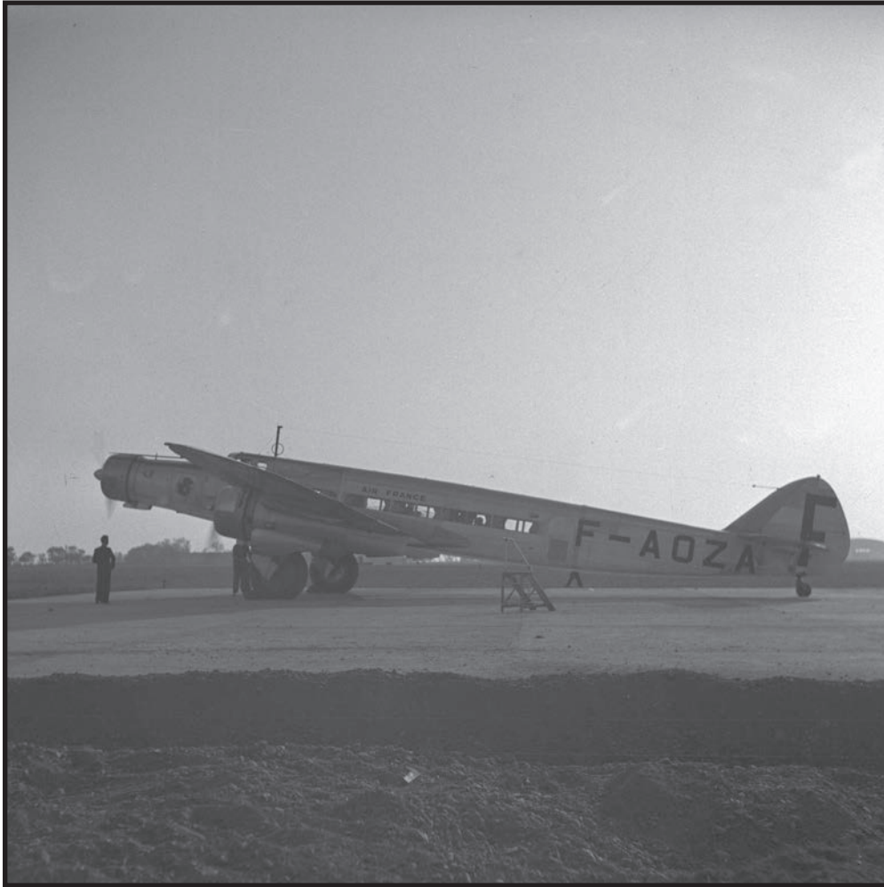
Prototype du Dewoitine 338, Clémence Isaure, venu à Blagnac à l'occasion du premier meeting aérien de 1937