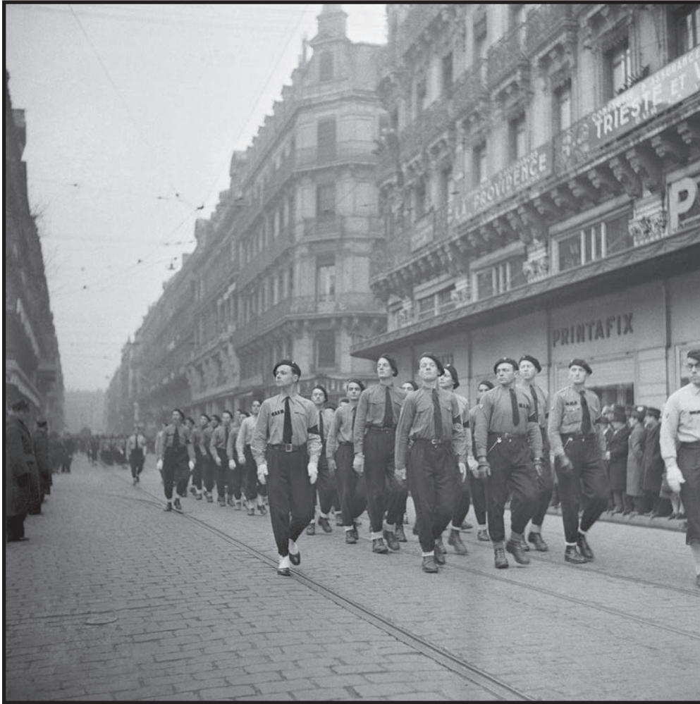
Le défilé de la Milice