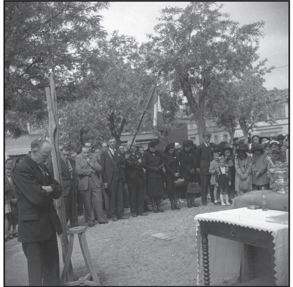
Minute de silence