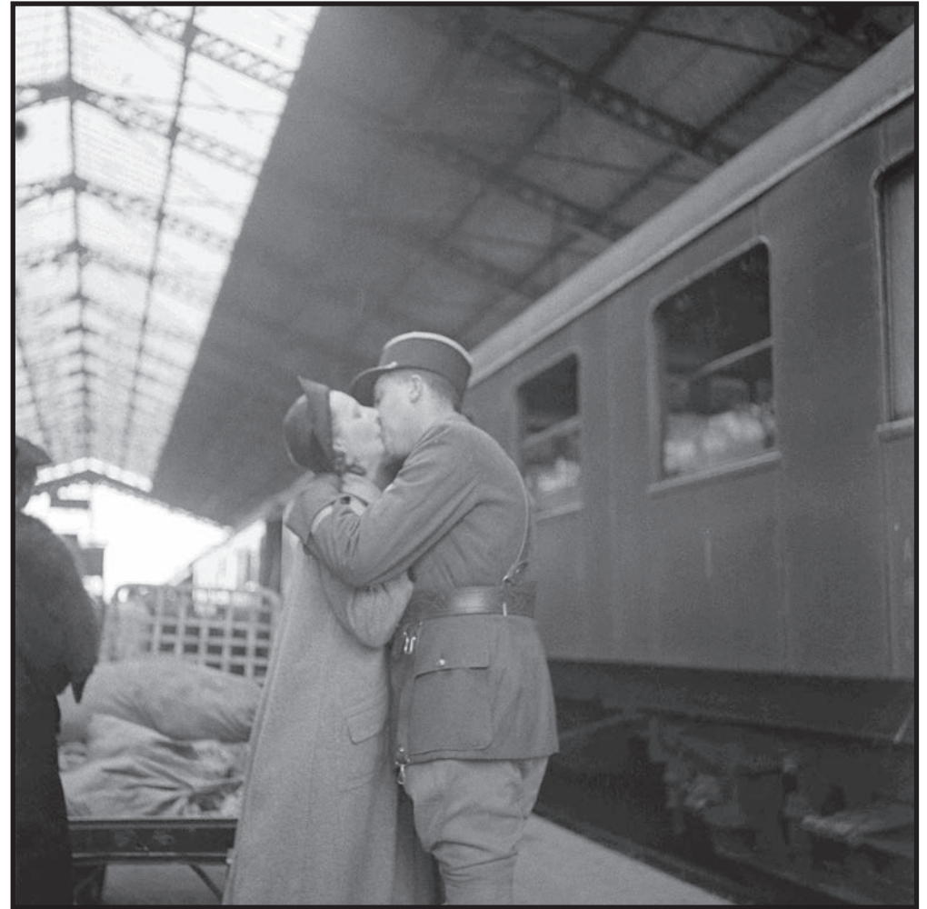
Le baiser sur le quai