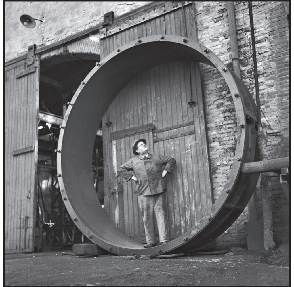
L'homme dans le cercle de métal