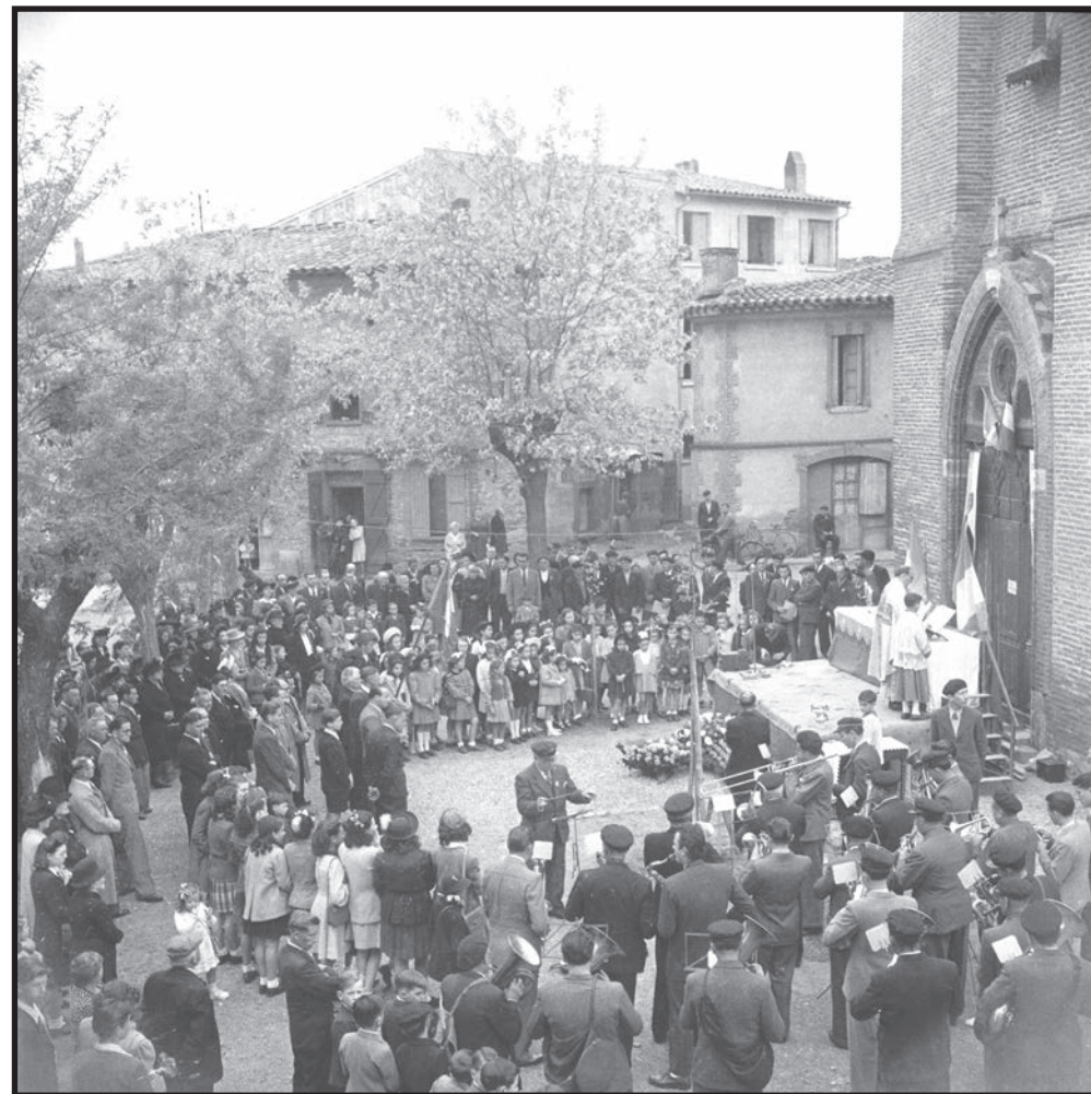
Cérémonie devant l'église