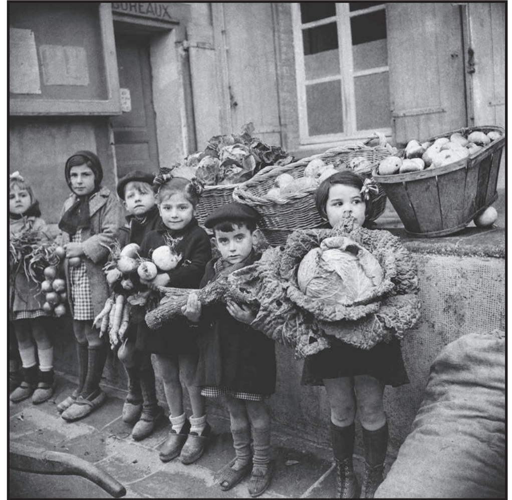
"Les enfants et les choux" ou le Secours national à la campagne