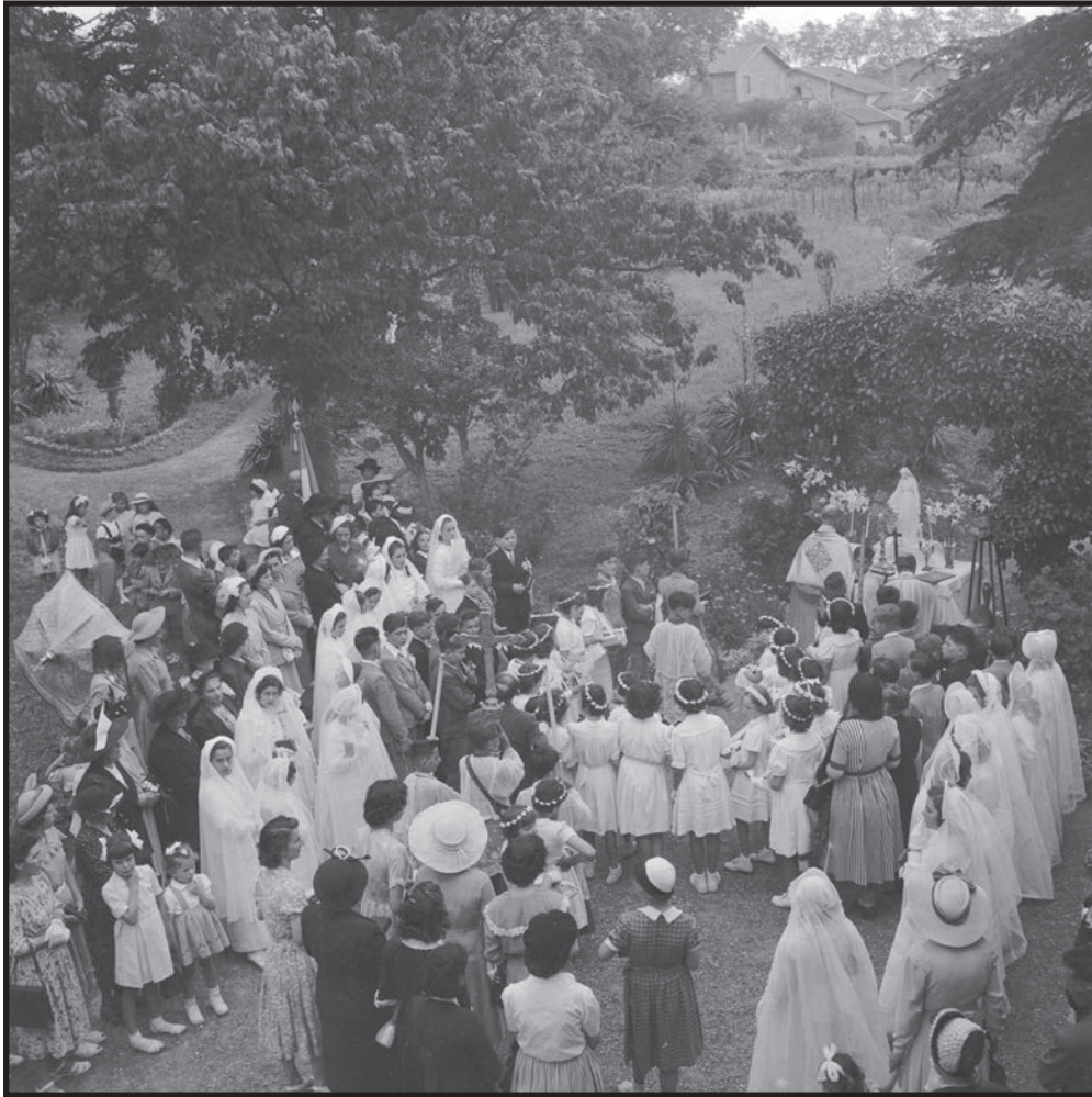
Communiantes et communicants dans un parc privé