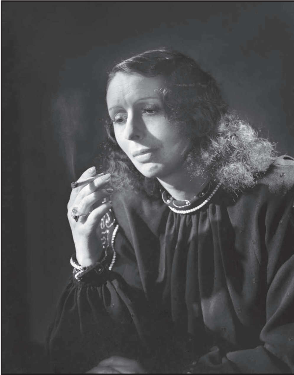
La jeune femme à la cigarette