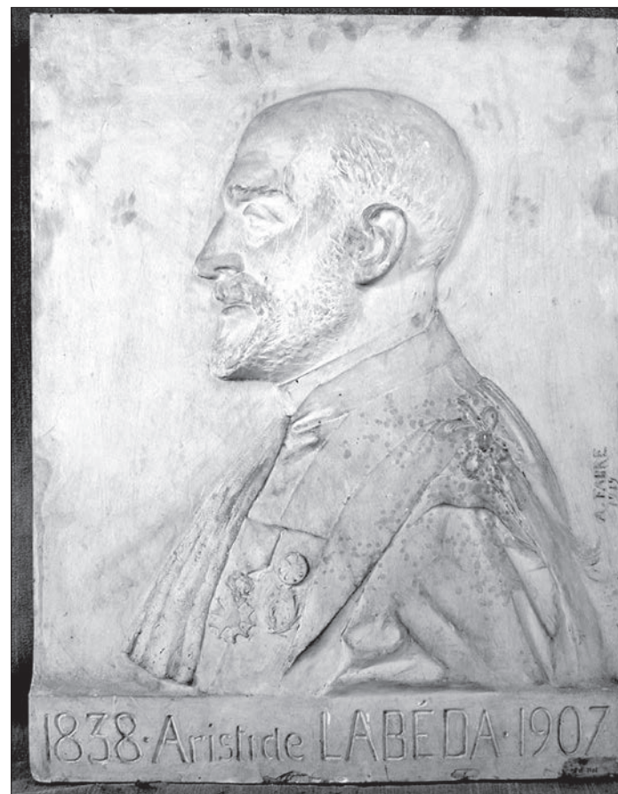
► Relief du buste d'Aristide Labéda

Quelques aquarelles d'Abel Fabre conservées au Musée du Vieux-Toulouse sont présentées en couleur en troisième de couverture.