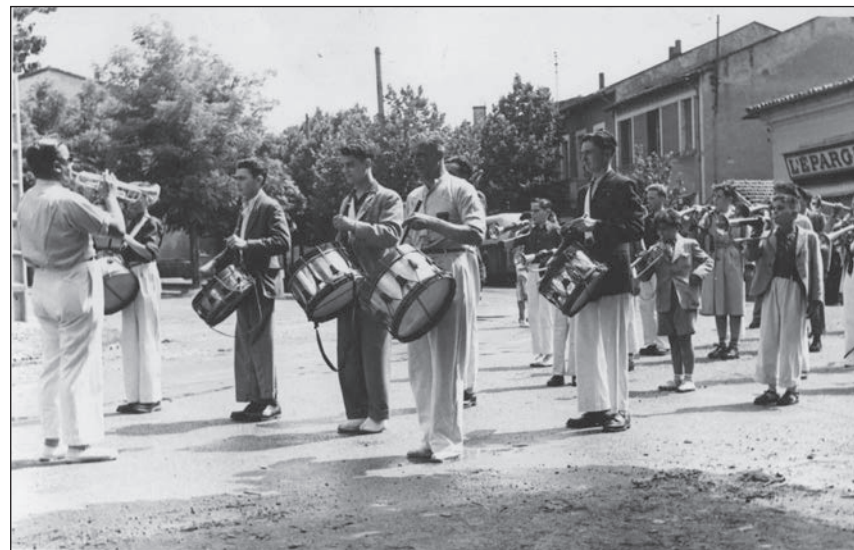
▶ 1949-1950, sur le boulevard face à l'église

En 1963, la clique prend le nom de « Batterie-Fanfare Municipale de Blagnac » affiliée à l'Union des Fanfares de France et grâce à l'ini-