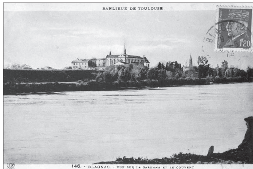
◀ Monastère vu de la rive droite de le Garonne

L'achat d'une bande de terrain le long du chemin qui donne accès à