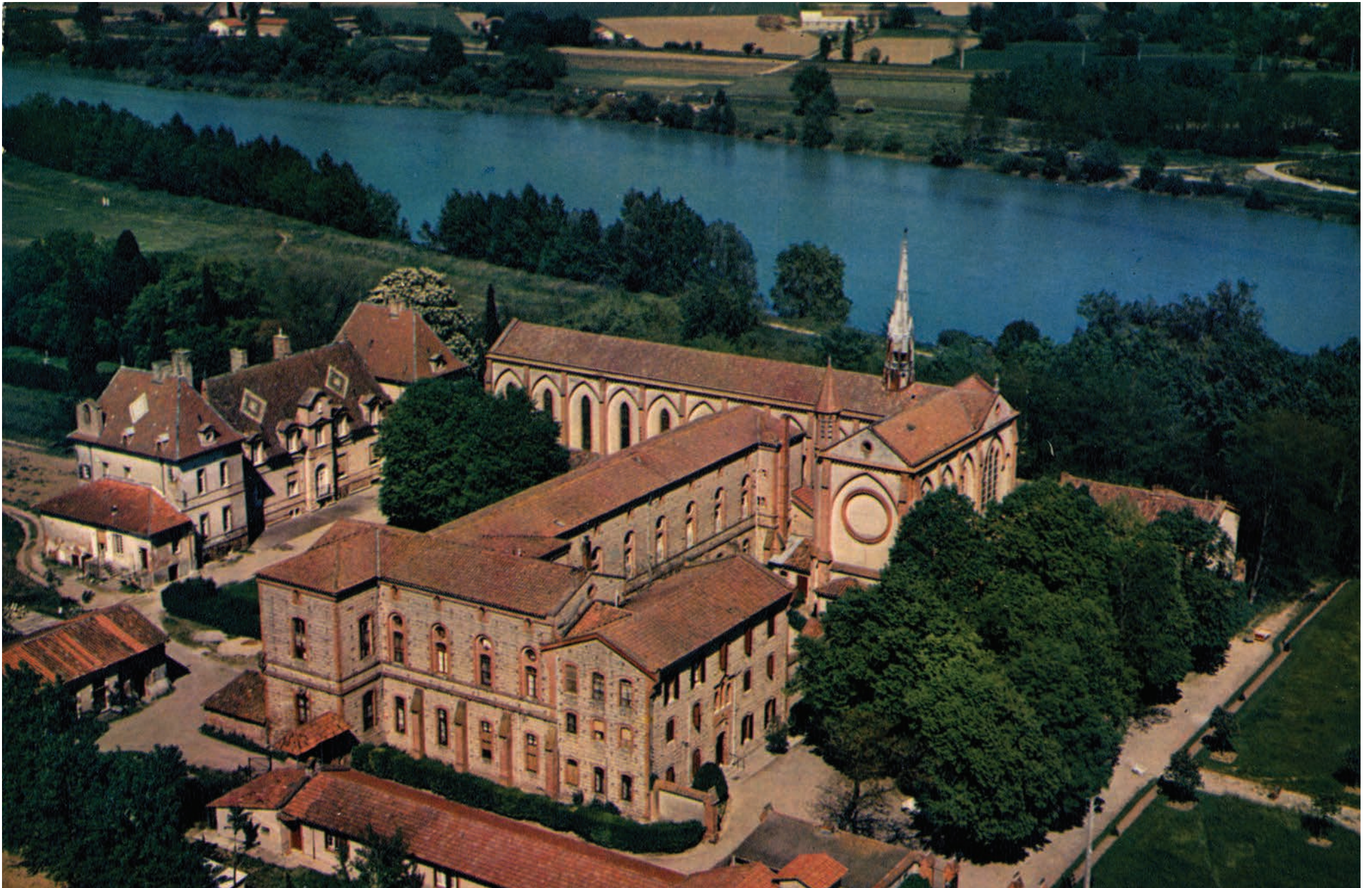
Le monastère dans les années 60