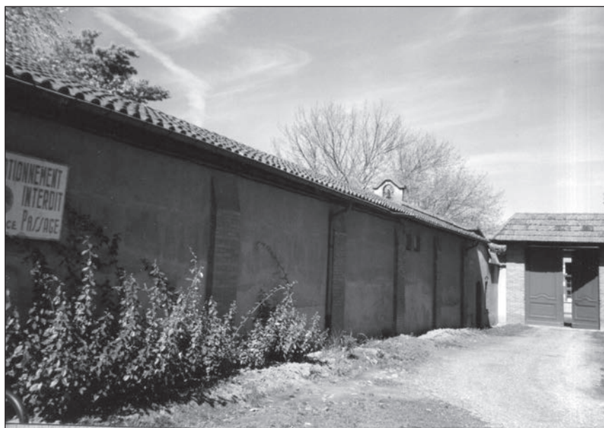
◀ Mur du mess des officiers

Le 6 avril, à minuit vingt-cinq, des flammes descendent à l'horizon nord-ouest. La D.C.A. tire sans discontinuer. Le fracas des bombes se rapproche et s'intensifie. Une quarantaine d'avions anglais larguent leurs bombes sur les objectifs blagnacais. Les aviateurs doivent être bien renseignés, car leurs cibles sont atteintes avec une grande précision. Les Ateliers Industriels de l'Air (A.I.A.) sont détruits, la maison Bégué à Rouaix (actuellement rue du 11 novembre 1918) qui abrite les installations radio de l'armée allemande pulvérisée, le château de