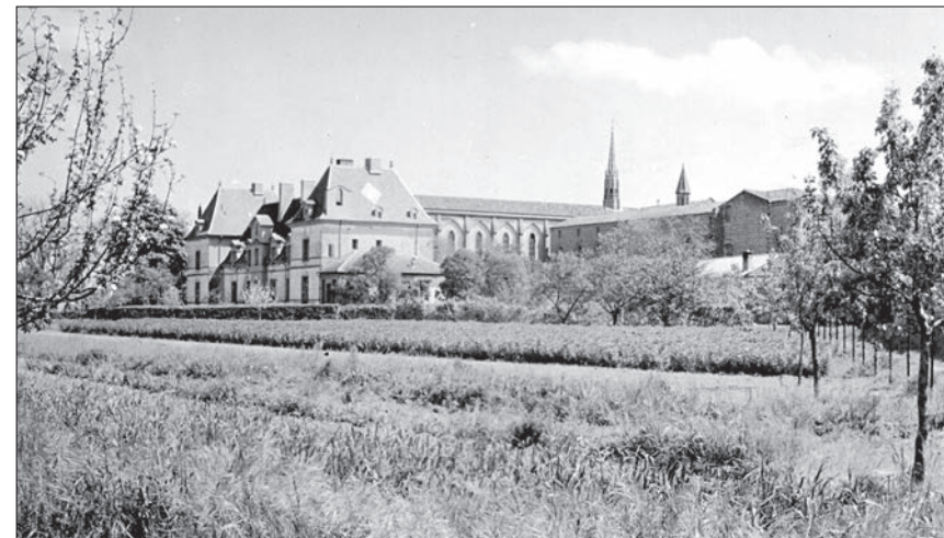
▶ Le château après l'installation des Dominicaines

Alors que les dominicaines étaient encore à Angoulême, il avait été prévu que les cisterciennes emporteraient une partie du mobilier de l'église au Rivet ; une autre partie leur était prêtée ; une autre