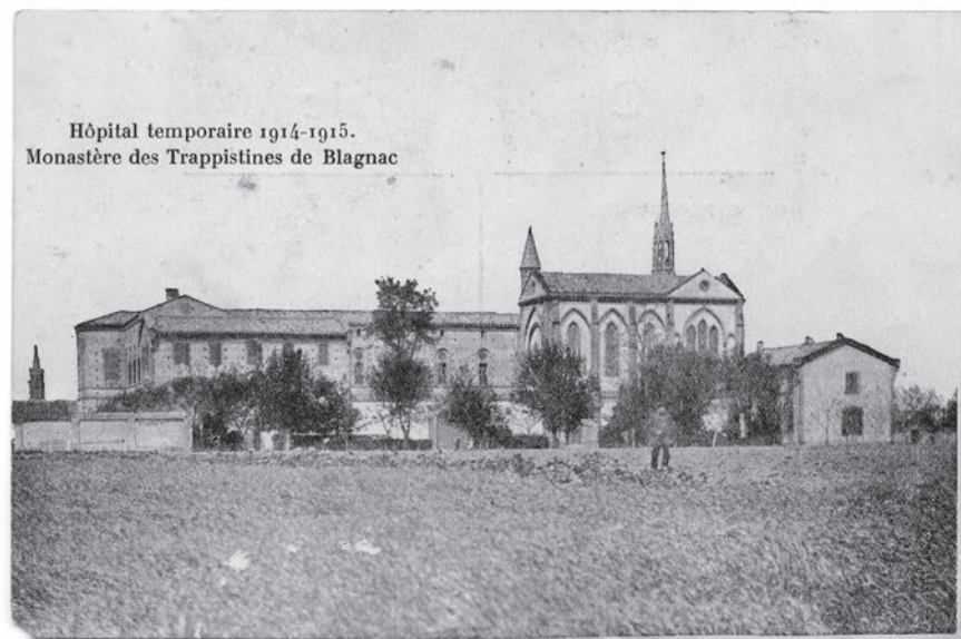
◀ L'hôpital complémentaire

En (1) 1903, les religieux avaient été expulsés de France et l'affaire semblait close, lorsqu'en 1914 le dossier des congrégations fut à nouveau mis à l'ordre du jour. Les cisterciennes de Blagnac apprirent qu'elles recevraient sous peu un décret d'expulsion. Elles se démenèrent pour trouver un refuge dans divers pays, mais les difficultés étaient grandes. Enfin, un bâtiment leur fut proposé dans des conditions acceptables au Pays de Galles, près de l'île de Caldey. Elles attendaient donc les événements avec un esprit plus tranquille.