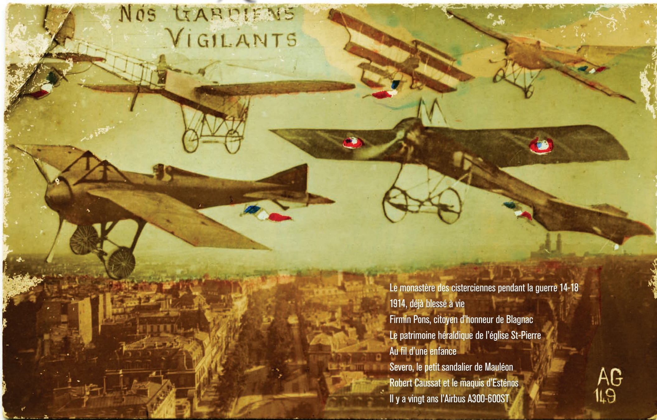
Carte envoyée du front à Blagnac par un père à sa fille (août 1915)