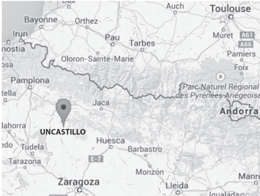
◀ Situation du village natal Uncastillo

Il se procure aussi la toile de coton traditionnelle, héritière des tissages de linge basque.