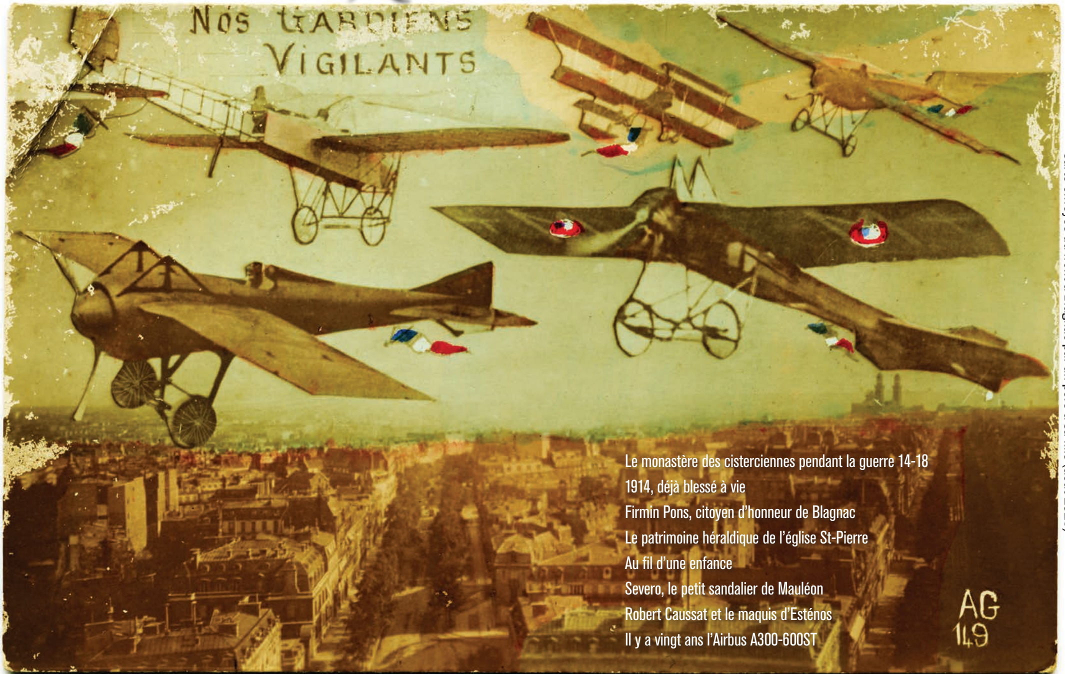
Carte envoyée du front à Blagnac par un père à sa fille (août 1915)