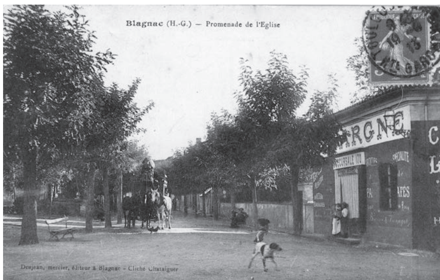
◀ Boulevard du centre ou futur boulevard Jean-Rivet - Arrivée de la diligence

la construction d'un pont en bois pour la communication (...) interceptée par la fuite d'eau du moulin du général Compans sont sur le point d'être terminés par un enthousiasme et le plus grand dévouement des habitants (...) Voulant faire rapprocher cette voie qui n'avait eu jusqu'à présent aucune dénomination certaine, aux grands événements du retour de l'illustre famille des Bourbons (...) au fait que les armées des alliés commandées par Lord Wellington (...) ont séjourné dans cette commune pour diriger les militaires lors de la Bataille de Toulouse livrée le 14 avril 1814 (...), que les généraux se transportèrent dans l'îlot de l'arigné (...) pour placer leur ponton au grand lit de la rivière afin d'y opérer le passage des troupes qui ont séjourné deux ans et demy dans cette commune (...), elle portera la dénomination d'allée royale ou avenue de Louis XVIII le désiré (...) et le pont en bois construit sur le canal de fuite celle de pont Bourbon (...). Pour perpétuer la mémoire des guerriers de cette vaillante armée qui sont morts pour la grande cause du retour des Bourbons (...), il sera érigé une croix à l'extrémité de la dite allée royale dans l'îlot de l'arigné ou île Bourbon près de la rivière (...). Ces dénominations seront rapportées au cadastre, aucune autre ne sera donnée dans les actes administratifs (...), le titre sera gravé sur les deux portes qui entourent la ville afin que les propriétaires et les autres aboutissent à s'y conformer...».