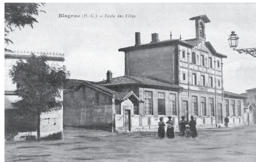
▶ Boulevard du sud actuellement place Jeanne Hérisson

Grâce aux aménagements voulus par le maire Gervais Gaillard, la promenade devient la voie principale du village au détriment de la Grande rue qui reste tout de même encore la plus commerçante. Pour la première fois, la circulation délaisse l'intérieur du fort et emprunte ce nouvel axe aux dimensions plus conséquentes et qui voit sa fréquentation augmenter tout au long du XIX e siècle et au delà, notamment avec la démolition des portes, la disparition du