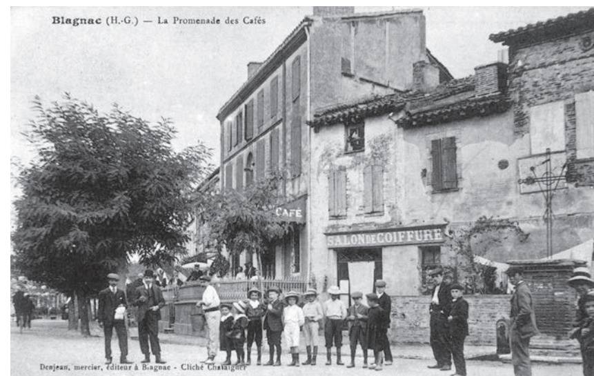
▶ Boulevard du nord et futur boulevard Firmin Pons - Le café se nomme «Les Terrasses»

dernières années », la commune « dispose de près de deux mille quatre cents journées de main d'oeuvre ou charroi ». Pour la plantation « des arbres à haute tige de chaque côté du chemin on trouve la dépense dans la valeur des vieux arbres gallés qui doivent nécessairement être vendus ». Les conseillers municipaux approuvent toutes les propositions du maire, lui donnent tous pouvoirs pour « diriger et surveiller les ouvrages ». Ils ajoutent « que s'il y a un résidu après l'achat des ormeaux il servira à la réparation de la rue de l'Oratoire et pour le déplacement de la croix à l'endroit le plus convenable du côté du mur (de l'église) du septentrion... » Le préfet donne son accord le 21 février suivant. Le républicain Bertrand Lavigne qui trouve de nombreux défauts au royaliste Gervais Gaillard et le critique énormément, reconnaît « utile et louable » la transformation de l'ancien fossé en « une charmante promenade complantée de deux rangées d'ormeaux ». Mais il s'indigne de l'arrêté pris par ce maire le 10 avril 1816 et approuvé par le préfet huit jours plus tard. Il le qualifie même de « honteux » car il met à l'honneur les armées ennemies commandées en 1814 par le duc de Wellington. Les termes dont voici des extraits peuvent se comprendre venant d'un royaliste sous le règne de Louis XVIII. « ...la nouvelle formation, redressement et réparation du chemin qui entoure la ville (...)