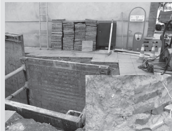
► clichés Didier Chapuy 16 octobre 2012

En 2012, lors de la mise en place des poubelles enterrées rue du Vieux Blagnac, découverte de murs en brique pouvant être des vestiges du rempart entourant "le bourg" ou de la porte "du Touch".