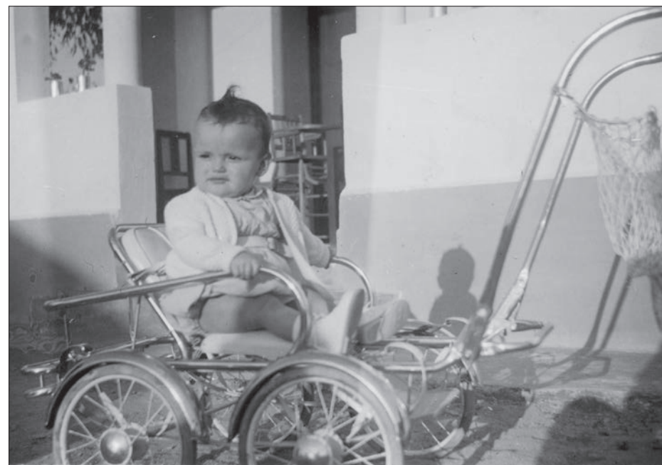
▲ Un landau transformé en poussette

N.B. : Si d'autres personnes que nous remercions à l'avance, ont des souvenirs à nous communiquer sur ce sujet, nous les recueillerons avec un grand plaisir.