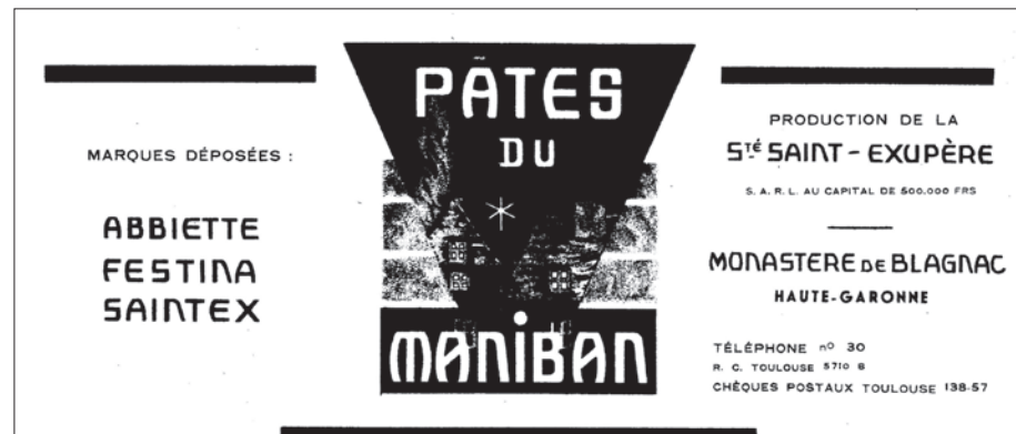
Logo de la fabrique

Après la guerre, les vocations furent très nombreuses au monastère des Dominicaines de Blagnac et le commerce des chapelets, alors florissant, permettait de faire face à une partie des dépenses de la communauté. Pourtant, à la fin 1945, la production des chapelets a du être intensifiée: "Les temps sont durs. Nous sommes atteintes par les nouvelles lois et... nos bienfaiteurs aussi".