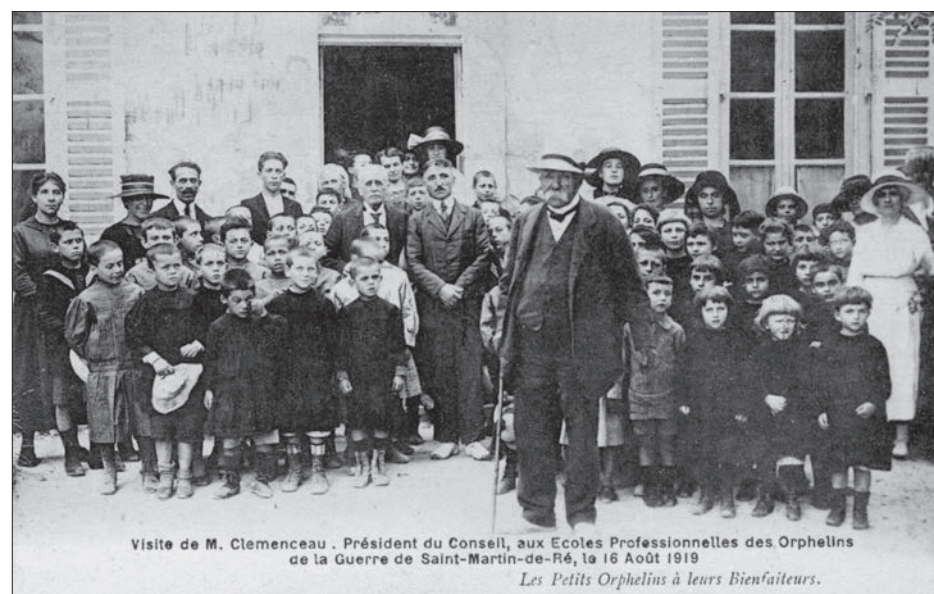
◀ Clemenceau à St-Martin de Ré