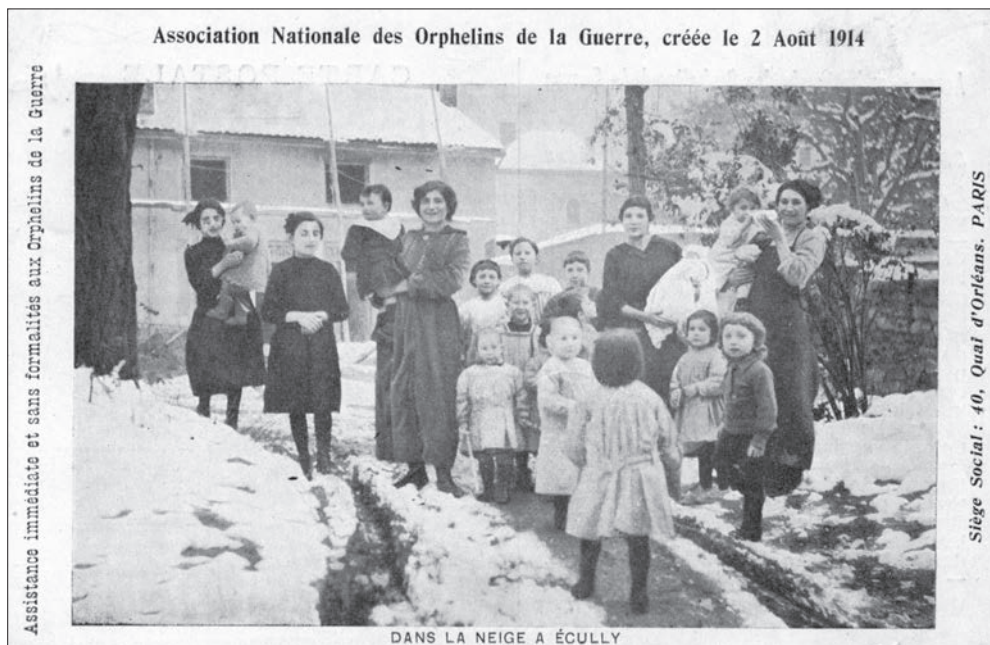
▲ Orphelinat d'Écully