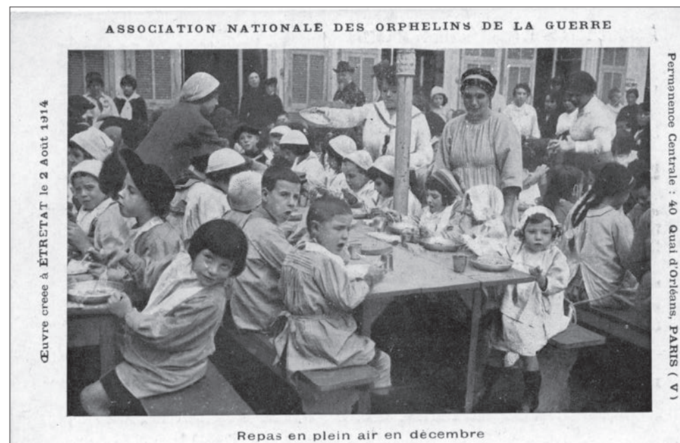
▲ Repas en plein air en décembre