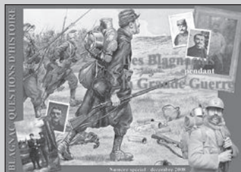
Les Blagnacais pendant la Grande guerre