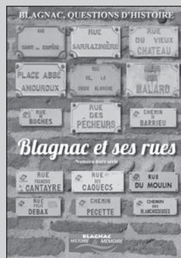
Blagnac et ses rues