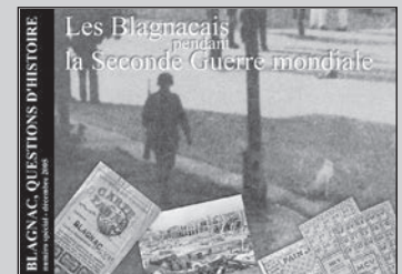
Les Blagnacais pendant la Seconde guerre mondiale