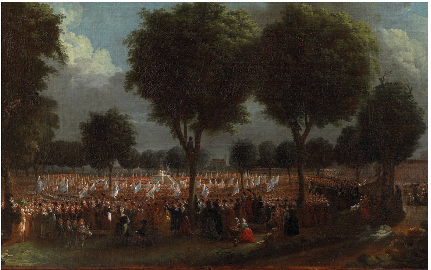
Tableau de la fête de la Fédération par Joseph Roques - Toulouse : Musée des Augustins