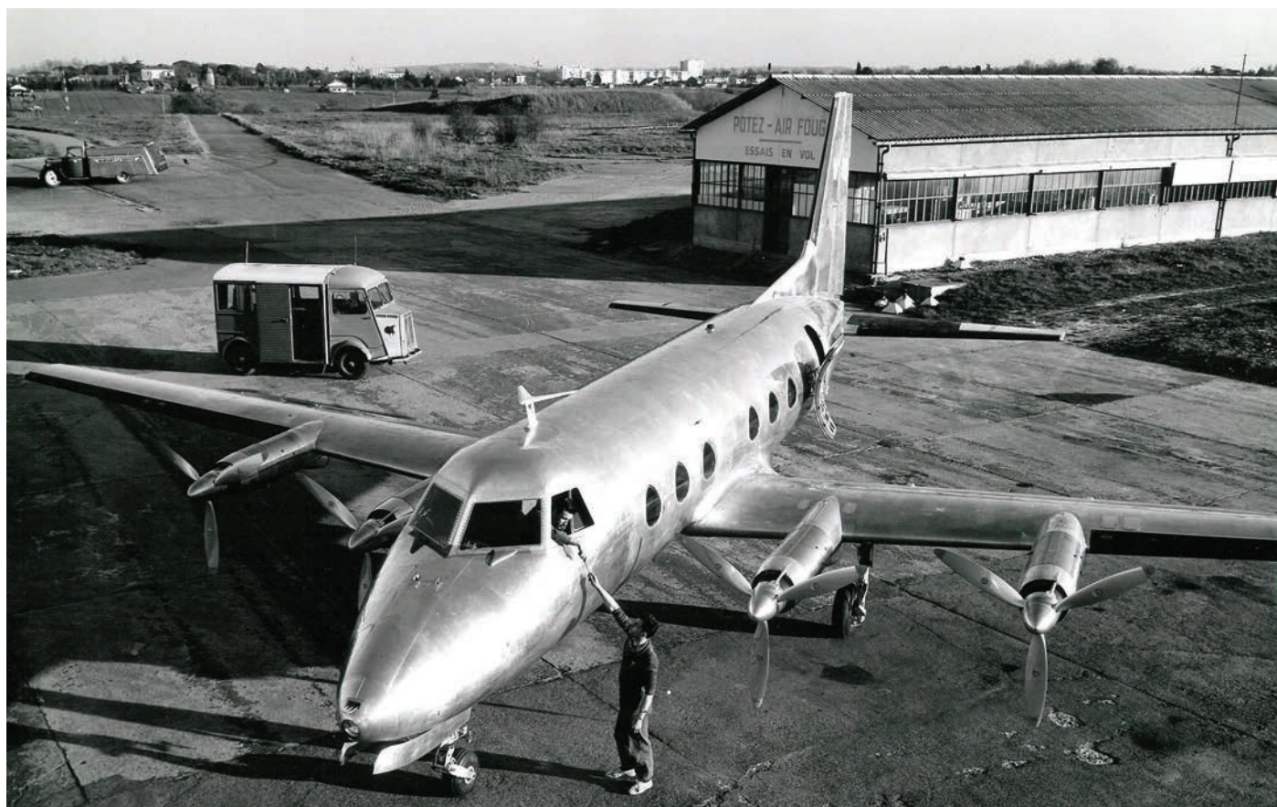
Le prototype Potez 840 avant sa mise en peinture devant les ateliers de Blagnac