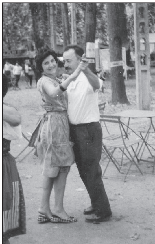
Dans le Ramier de Blagnac l'été 1962