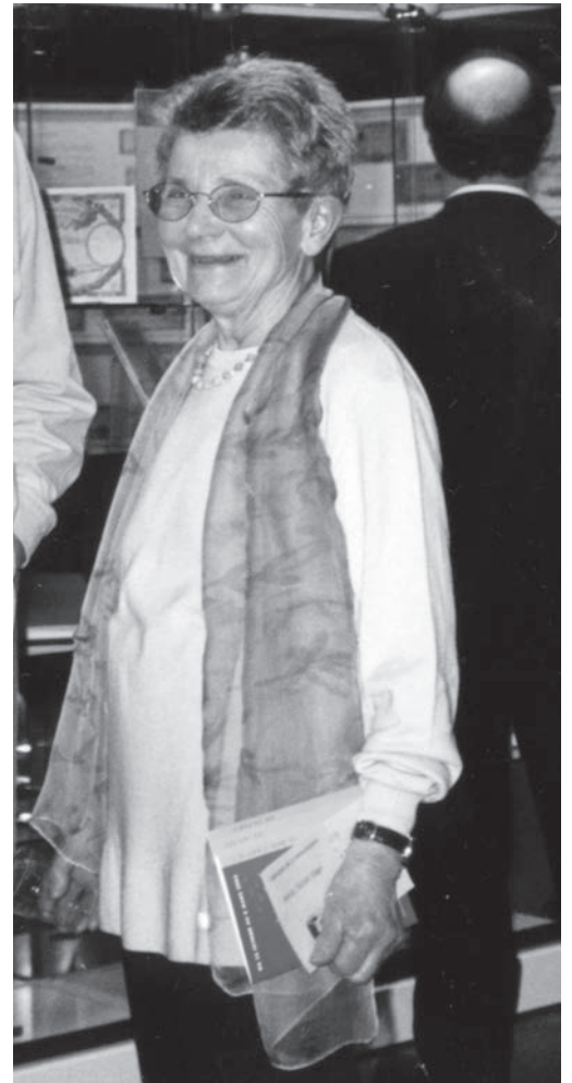
▲ Mars 2002 : première exposition de BHM à Odyssud