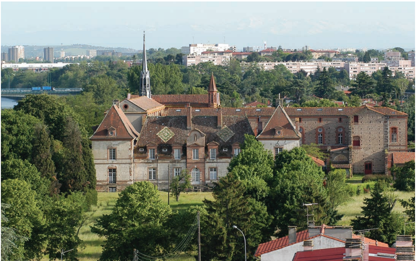
Le chateau des marquis de Maniban à Blagnac