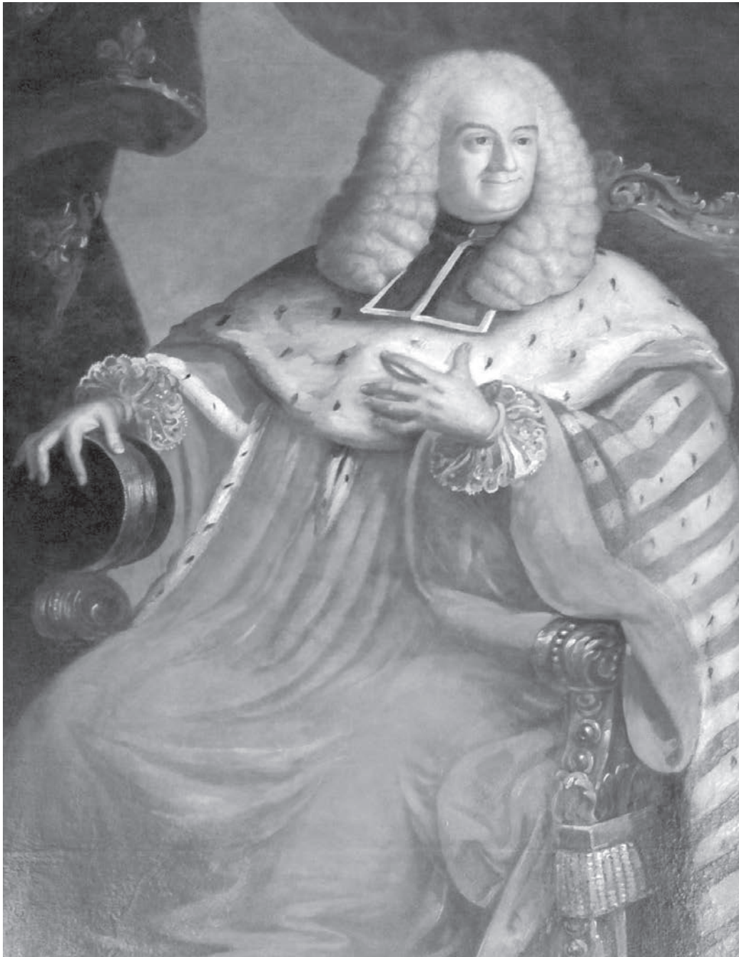
J.-G. de Maniban - Musée de l'histoire de la médecine - Hôtel-Dieu - Toulouse - Fonds BHM