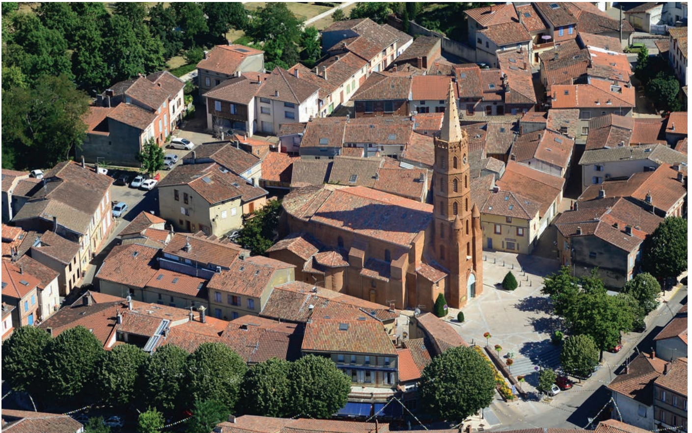
L'église Saint-Pierre de Blagnac