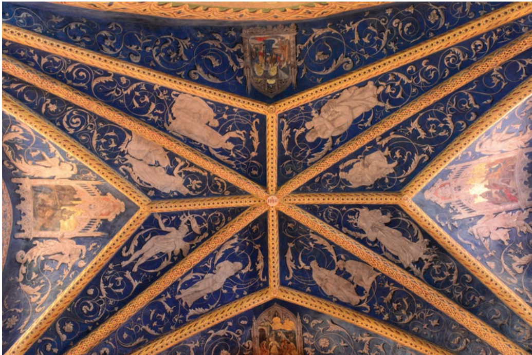
La croisée d'ogives

Les voûtes sur croisée d'ogives sont renforcées par des nervures saillantes à liernes et tiercerons.