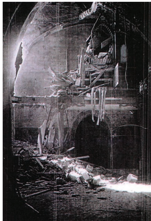
Les dégâts occasionnés par l'avion allemand en 1944 (voir page suivante)