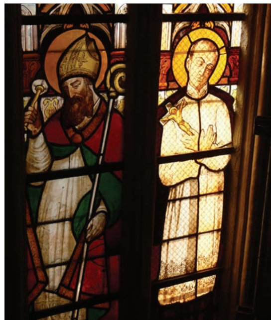
Vitrail de Saint Pierre et Saint Paul

Saint Paul de Tarse est un juif persécuteur des chrétiens avant de devenir leur missionnaire le plus zélé. Il convertit une partie du monde méditerranéen à la religion chrétienne et il meurt décapité en 66. Il est souvent représenté tenant une épée dans sa main.