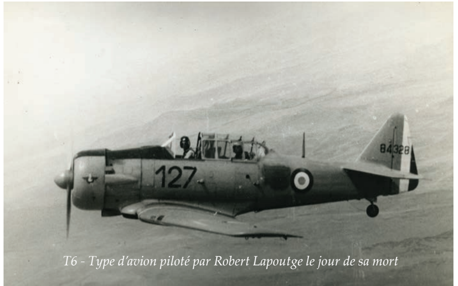
T6 - Type d'avion piloté par Robert Lapoutge le jour de sa mort