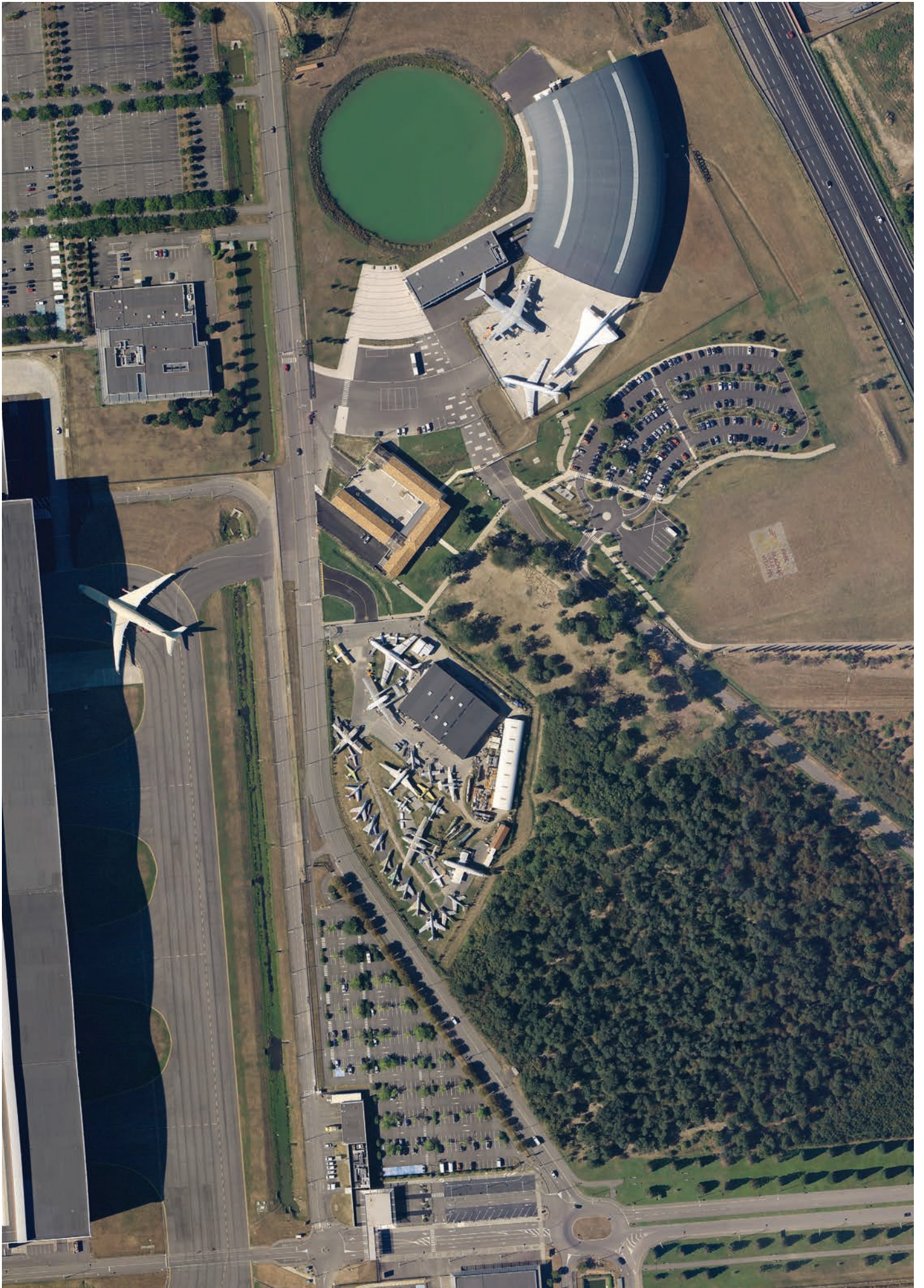
Aeroscopia : le premier musée de notre ville