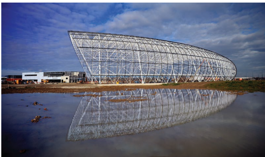
La résille du hangar

Elle a été conçue pour permettre l'installation des gros avions du musée qui ont été installés avant la fin de la construction. Le bâtiment est construit autour d'eux. Il est signé par l'agence Cardete Huet Architectes qui a emporté le concours organisé en 2006. Elle avait déjà réalisé le hall d'assemblage de l'A380. L'architecture sublime subtilement l'imaginaire aéronautique par le rappel du hangar aéronautique, mais