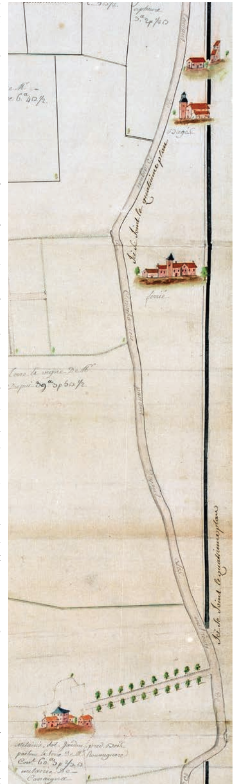
Plan XVIII e - A.M. Blagnac

Le voyage avec ses nombreux changements et sa durée dût être éprouvant. Et l'arrivée à Blagnac sensationnelle. Ils descendent