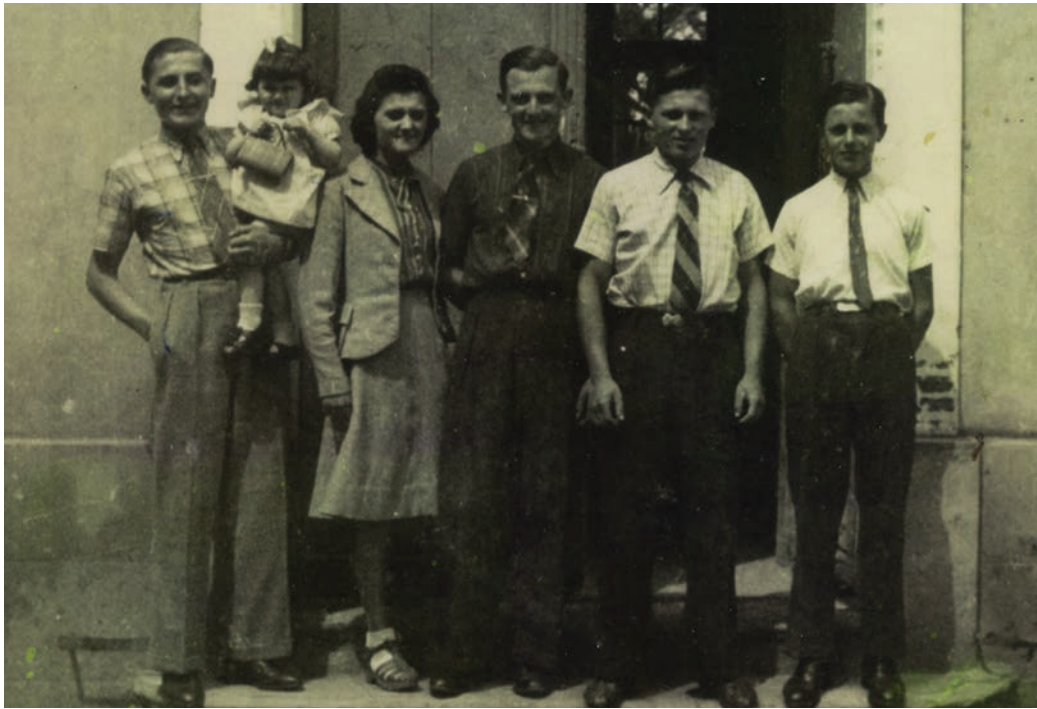
Une nouvelle génération (aux environ des années 1943-1944)

Le 3 septembre 1939, la France et l'Angleterre déclarent la guerre à l'Allemagne qui a envahi la Pologne. Mussolini soutient de plus en plus ouvertement la politique expansionniste de Hitler. Et le 10 juin 1940, lors de la rupture du front français et de la percée des blindés allemands vers Paris et le sud de la France, en pleine débâcle, Mussolini déclare la guerre à la France !