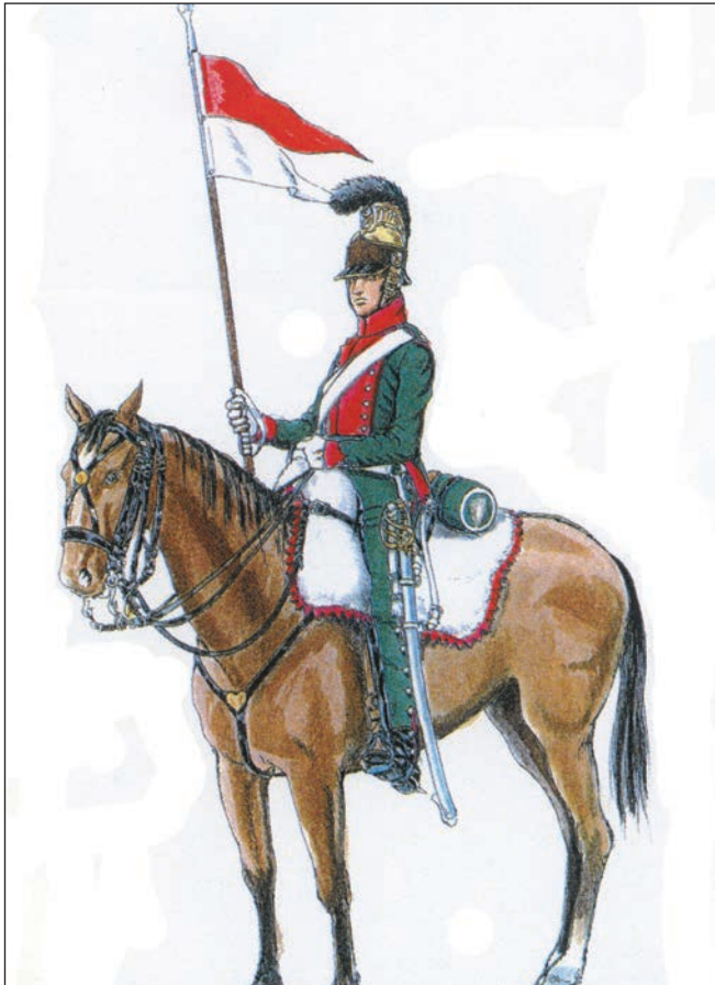
Uniforme de François Delboy. Russie 1812