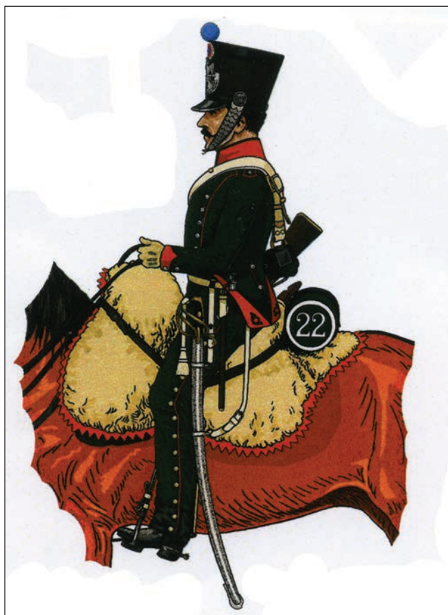
Uniforme de Bernard Desclaux. Espagne 1813