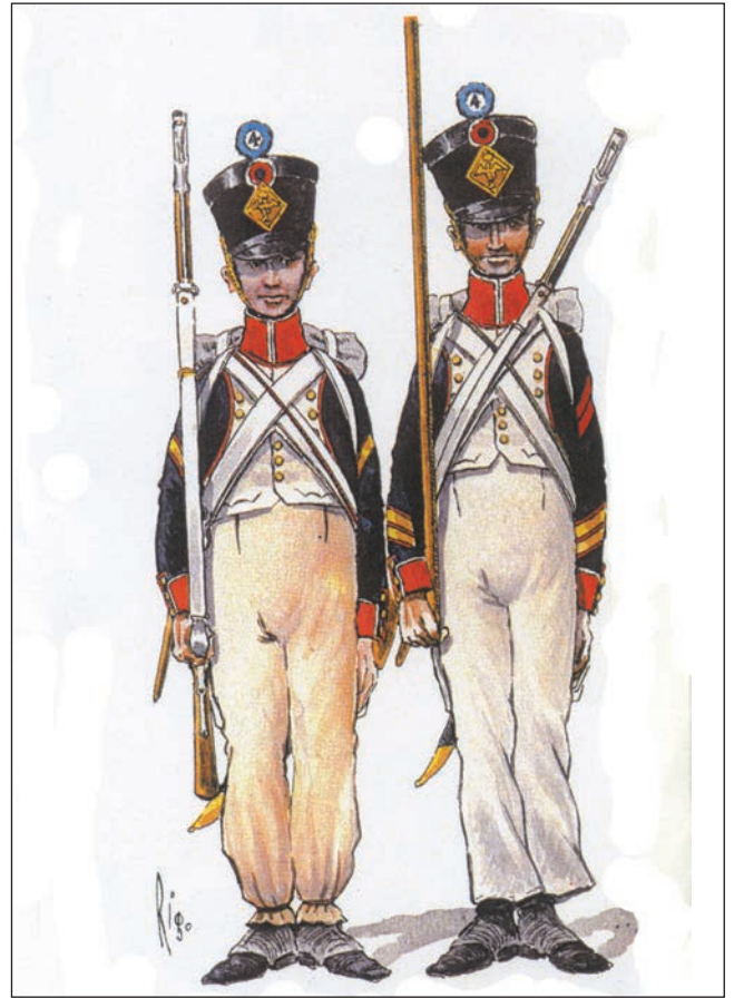
Fantassins du Premier Empire par RIGO

d'armes dans les neiges russes lors de la dramatique retraite de 1812, bien loin de sa jeune femme et de son fils en bas âge.