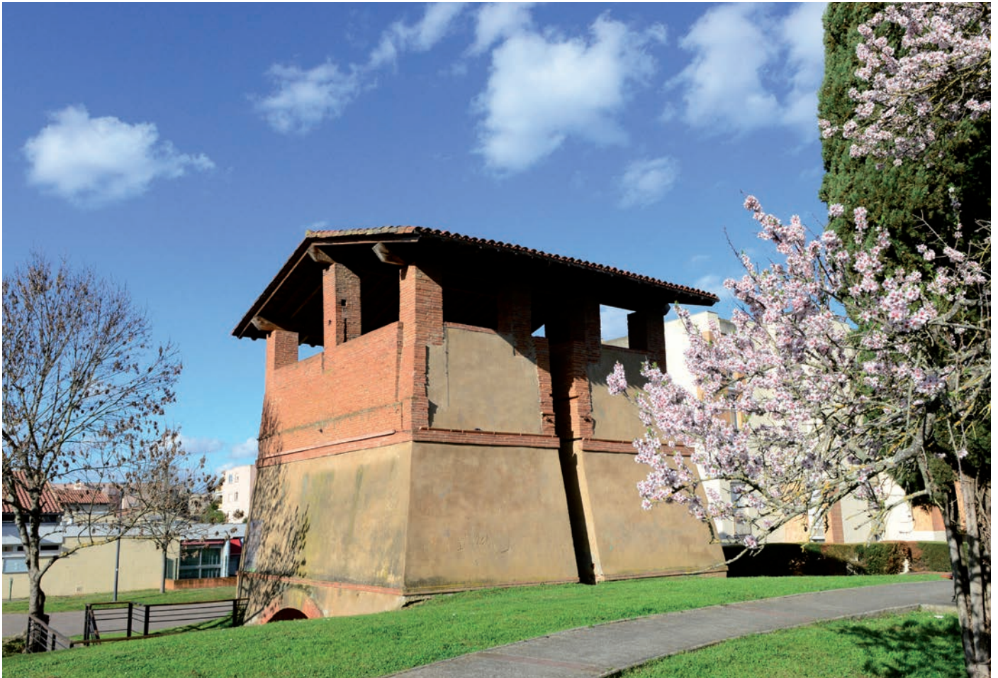
Le four à briques, seul vestige de la briqueterie « Darbas »