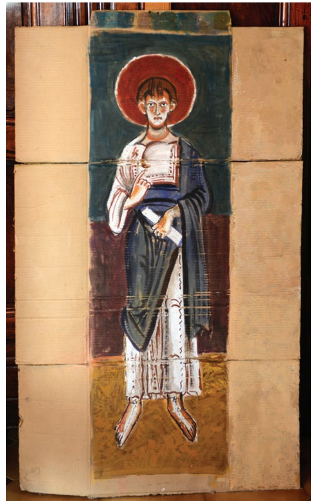
L'évangéliste de St-Lizier