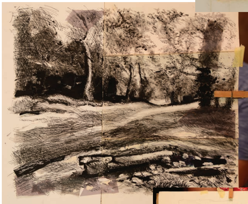
Dessin à la plume

« Les bords de Garonne » : cheminement du peintre du carnet de bord à l'aquarelle.