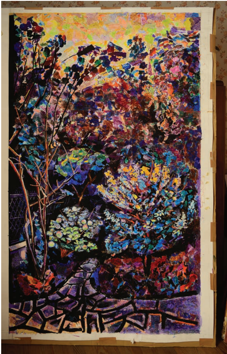
Devant de porte Automne