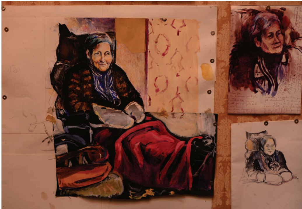
Études pour le portrait de maman