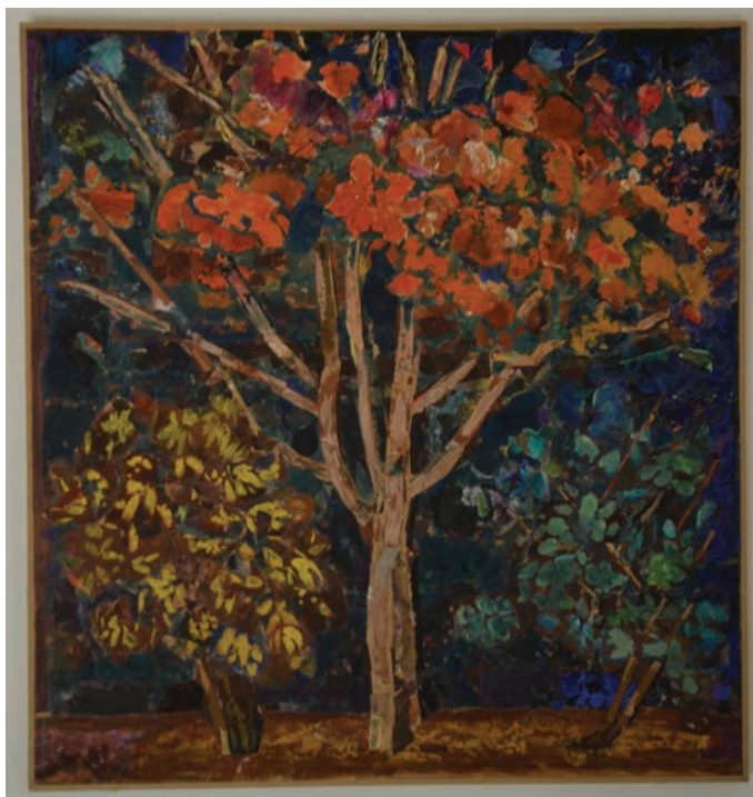
Le lagerstroemia de la cour.