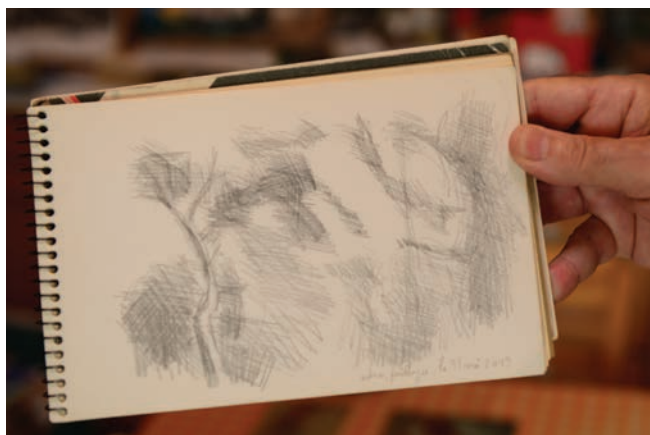
Études de feuillages printemps 2019