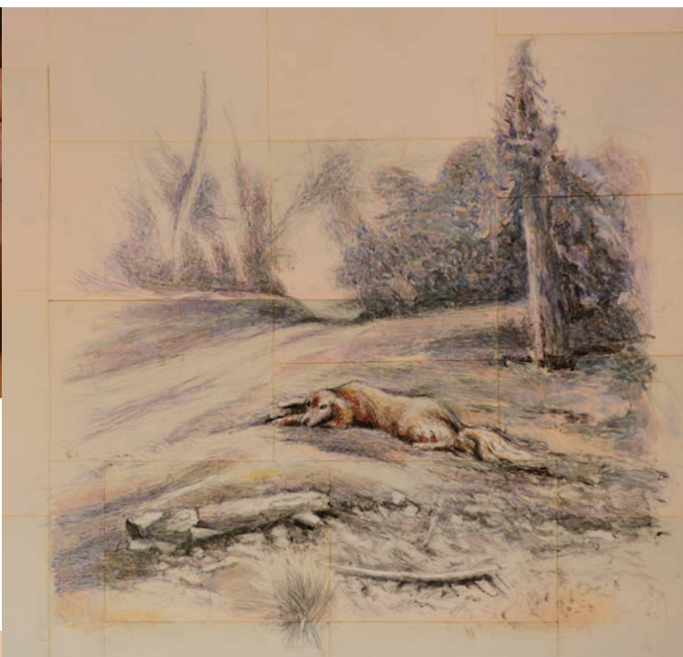
Crayon rehaussé d'aquarelle et de gouache