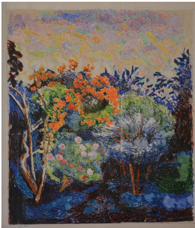
Devant de porte été