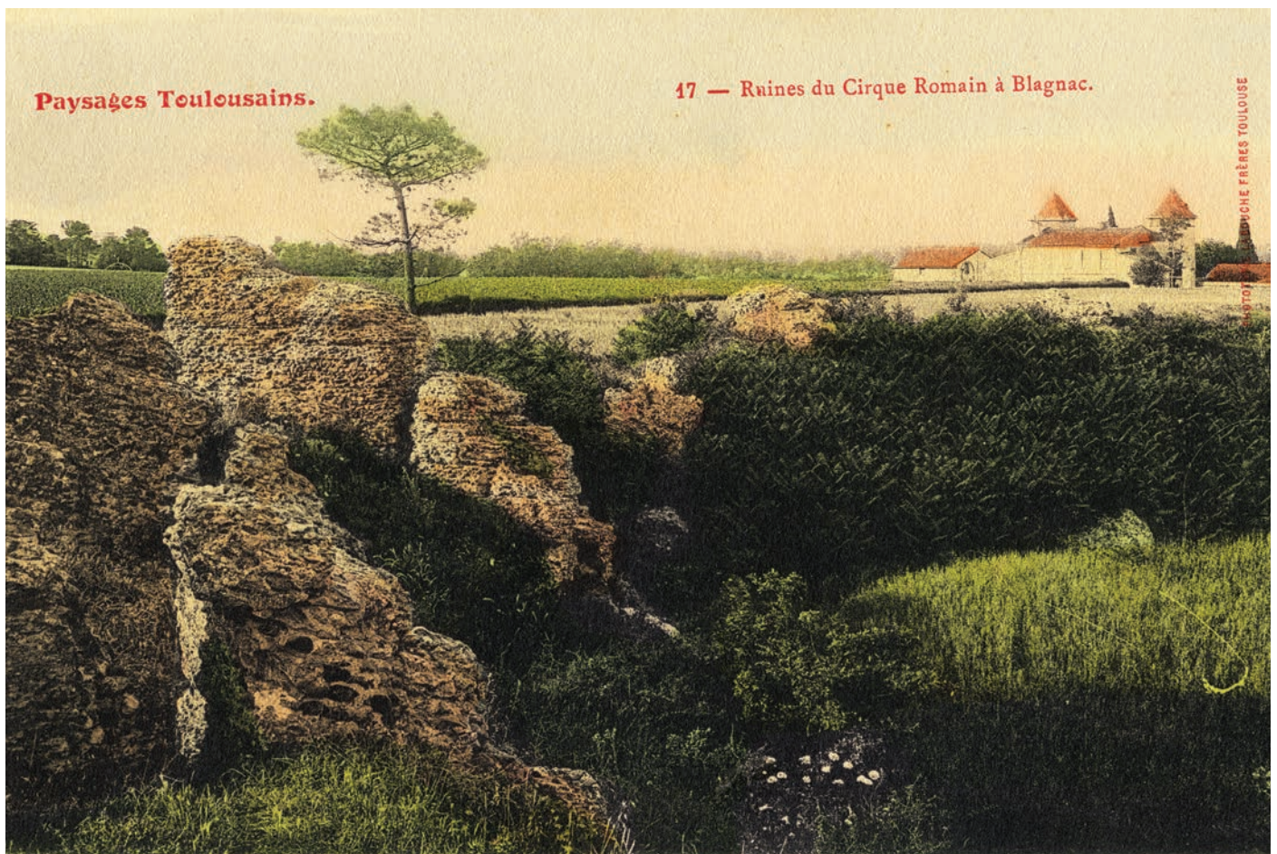
L'amphithéâtre de Purpan