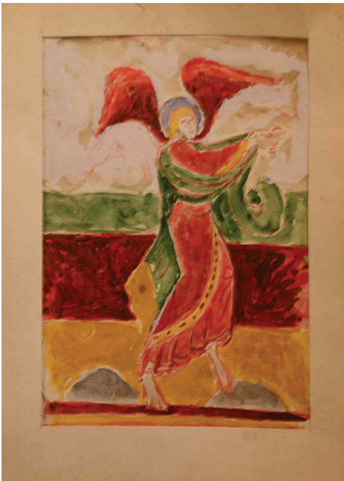
L'ange de Tavant

Son métier le passionne mais il découvre que la restauration ne remplit pas sa vie. Il a besoin de dessiner, de peindre ce qui est autour de lui ; il ne peut pas échapper à cette exigence. Il est toujours accompagné de son journal de bord où ses croquis traduisent jour après jour ses découvertes et ses émotions, où il va de ce qu'il voit à ce qu'il ressent.