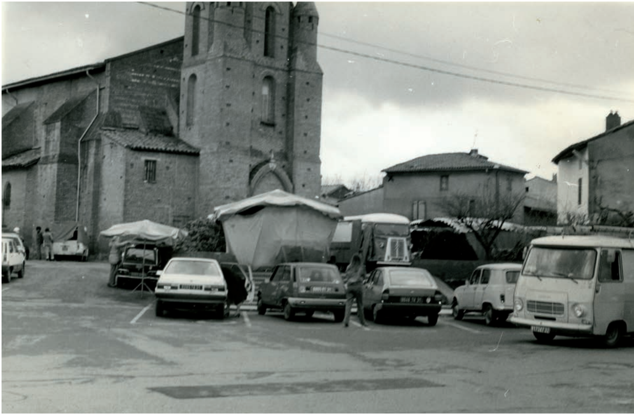
Le marché place de l'église dans les années 1980