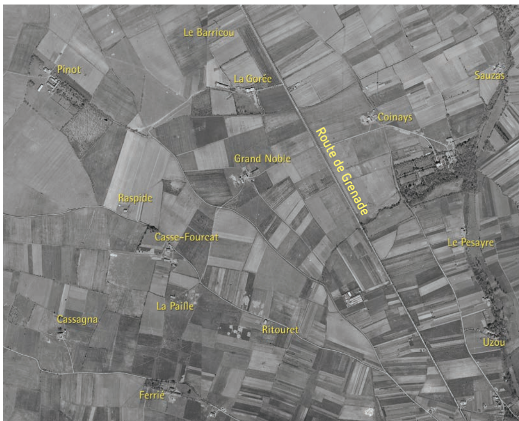
Emplacement de quelques fermes loin du centre