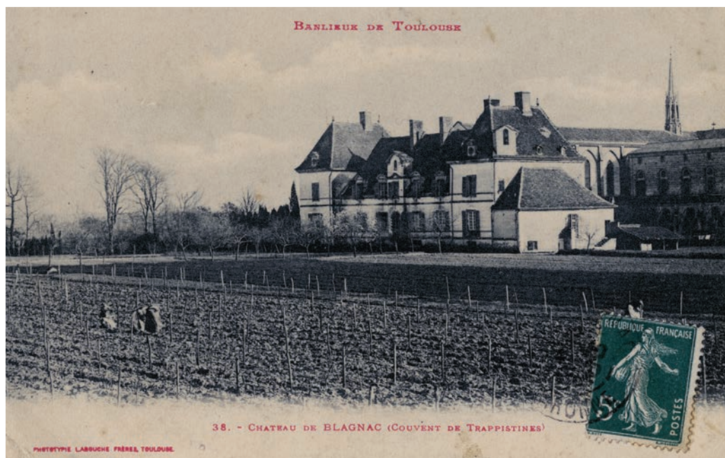
Le Parc du château a désormais une vocation agricole.