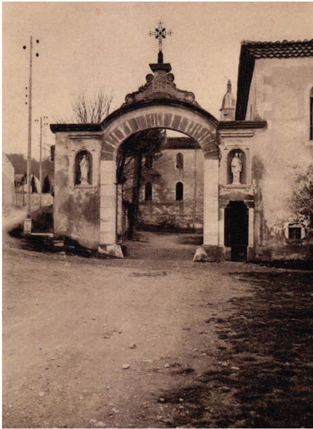
Portail de l'abbaye de Maubec dans la Drôme.