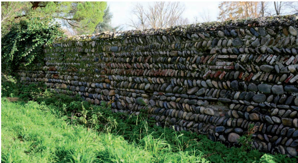
Le mur de galets de Garonne qui borde le Ramier d'aujourd'hui faisait partie de la clôture du monastère.

monastères Cisterciens, ce qui explique son nom.