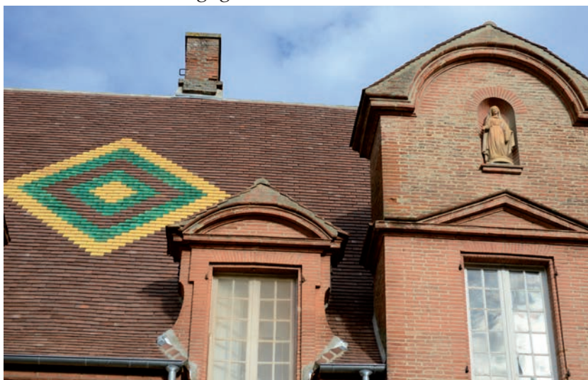
La toiture du château côté Sud.

Ce bel ensemble occupait une superficie très importante de la commune dont rend bien compte une carte de l'an X. Mais, toutes les descriptions de l'époque concordent et elles ne sont pas flatteuses pour notre village. Le château est décrit comme « un manoir ruiné, ouvert à tous les vents et un parc en friche ». Même s'il est qualifié de « beau et d'illustre, riche par ses souvenirs », les écrits mettent en avant qu'« il est taché par les souillures de la débauche et destiné à une imminente démolition ». Le livre rappelle qu'il a vu « dans ses murs les illustrations et les misères humaines ». Un portrait très sombre d'un château, il est vrai, passant de mains en mains au XIX e