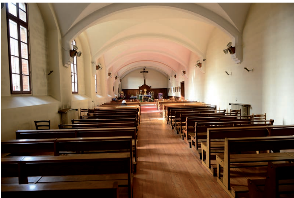
La première chapelle au rez-de-chaussée du château.

La Gazette du Languedoc , journal conservateur et royaliste, dans son édition du 26 mars 1852, relate cette cérémonie dans un long article conservé dans les annales. Il décrit une cérémonie touchante et souligne « les rangs pressés d'une foule pieuse » et retient « le bonheur répandu à Blagnac ». La chapelle avait été ornée de fleurs, des visiteurs avaient amené un tabernacle, d'autres une image de la Vierge sainte. A huit heures précises, l'aumônier, les deux mères revêtues de leurs habits traditionnels, les amples robes de laine blanche et le voile noir, les sœurs revêtues de leurs habits de laine brune et quelques fidèles parcourent tout l'intérieur du château en récitant les psaumes de la pénitence.