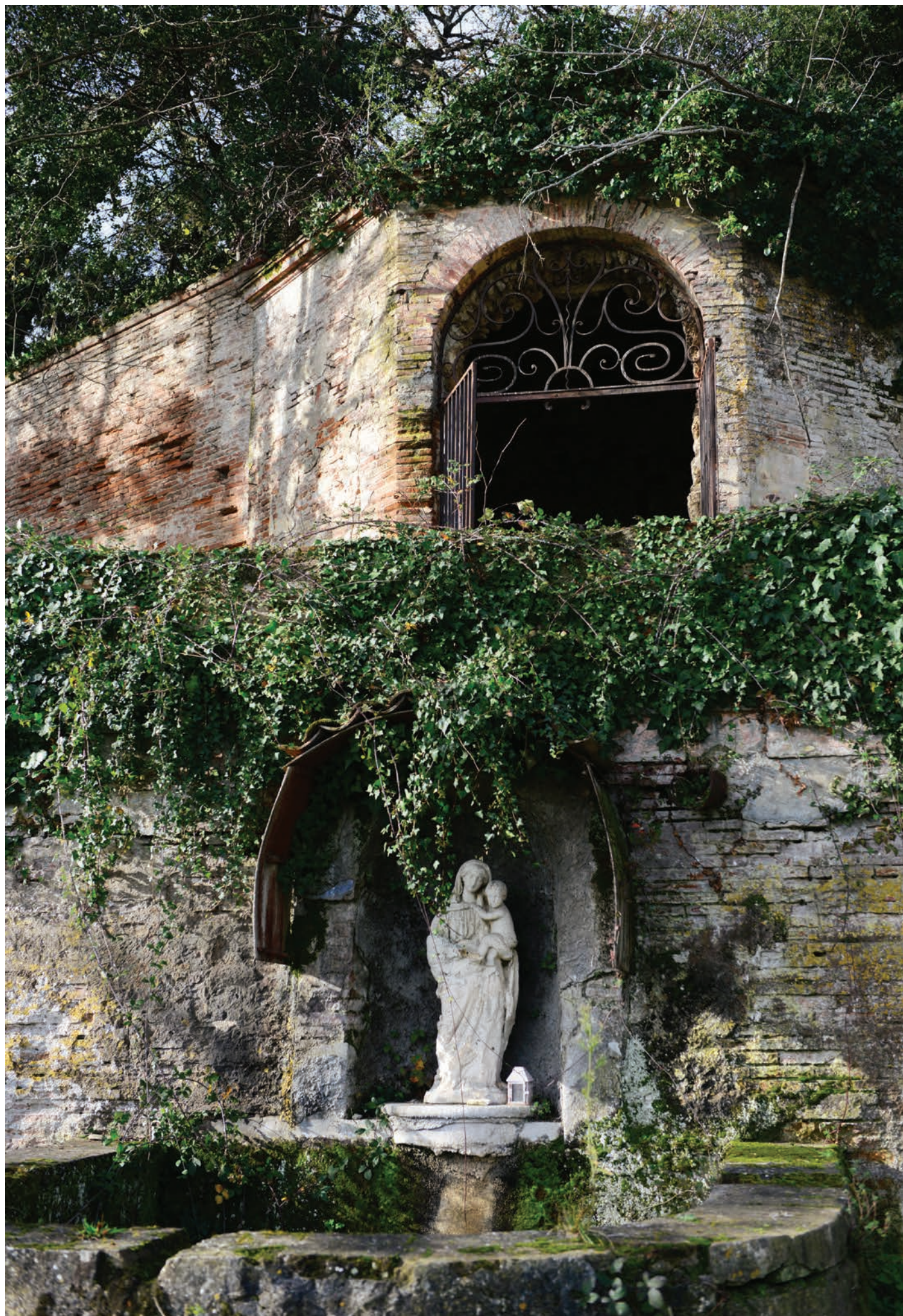
Dans le parc du château de Maniban, dominant les Ramiers de Garonne, la grotte du XVIII e siècle transformée par les Trappistines en grotte de Notre-Dame