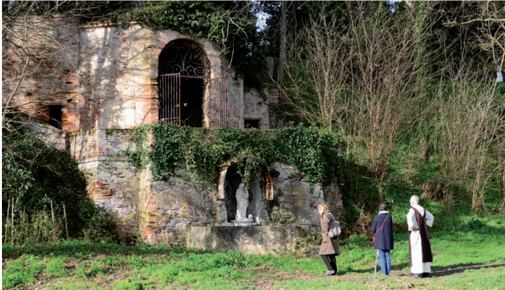
La «grotte» du XVIII e de style Rocaille.

Et petit à petit le château et la propriété se transformèrent. Les grandes allées du parc rétrécissent pour laisser moins d'espace à la promenade et plus de terre à l'agriculture. Les grands chênes sont abattus pour laisser place à des jardins et aux légumes. Les statues païennes et la Vénus dans la grotte de style rocaille, dominant la Garonne, disparaissent et sont remplacées par une statue de la Vierge Marie.