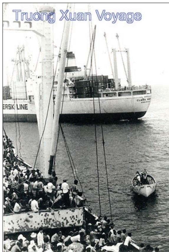
Du Truong Xuan au Clara Maersk - Voyage to Freedom