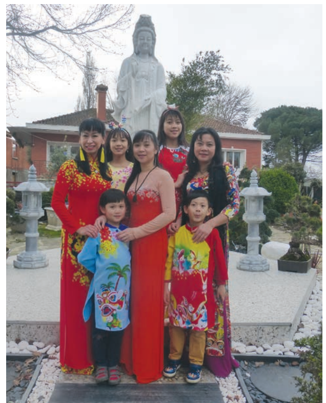
Fête du Têt - Année du Rat 2020 - Pagode de Cornebarrieu

Nous avons davantage parlé du Vietnam et des Vietnamiens, mais nous évoquerons un autre témoignage concernant le Laos touché par cet exode.