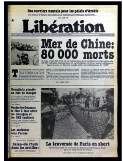
Mer de Chine 80 000 morts - Libération - 25/06/1979

À l'arrivée, ils doivent faire face au déclassement de leur activité professionnelle, leur formation initiale et leurs diplômes ne sont pas reconnus, mais ils ont presque tous trouvé du travail comme manœuvres, gardiens, agents d'entretien et plus tard ils ouvrent des petits commerces ou des restaurants ainsi que des ateliers de confection. La main-d'œuvre vietnamienne jouit d'une réputation de docilité, de respect, de politesse, de discrétion et de fiabilité. Les femmes qui parlent rarement le français sont employées dans la couture, par exemple, mais ne sont parfois pas déclarées.