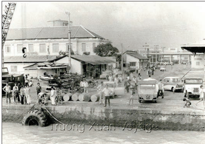
Port de Saïgon - Archives of Vietnamese Boat People

Les Boat People rejetés à la mer - Libération 16/06/1979