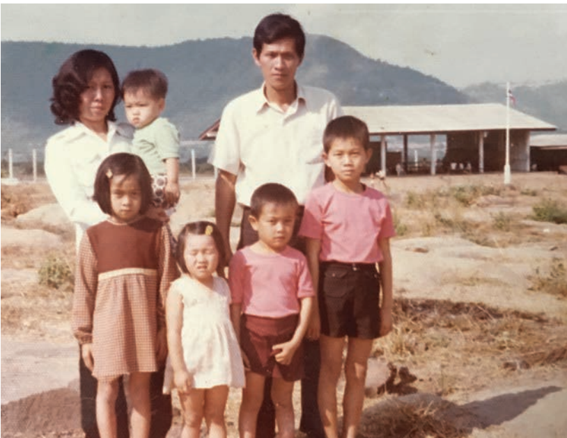
En arrivant au camp de réfugiés à Sikhiu

cet endroit, Vientiane se trouvant sur la rive gauche et Nong Khai sur la rive droite. À ce moment, la frontière n'était pas complètement fermée. Nous eûmes la chance de la traverser en bateau assez aisément, avec des papiers en règle. Nous fûmes intégrés dans le camp de réfugiés laotiens de Nong Khai où papa nous somma de ne parler que le laotien. Nous pouvions y entrer et sortir, notamment pour acheter des provisions. Les oncles et tantes déjà arrivés aux États-Unis insistèrent pour que nous les rejoignions là-bas. Ceci nécessita d'être transférés, en novembre 1976, dans le camp de réfugiés vietnamiens à Sikhiu, situé à environ 200 km au nord-est de Bangkok (capitale thaïlandaise). La vie n'est plus la même dans ce camp fermé. Malgré le soutien de l'ONU et du secours catholique, nous connûmes la