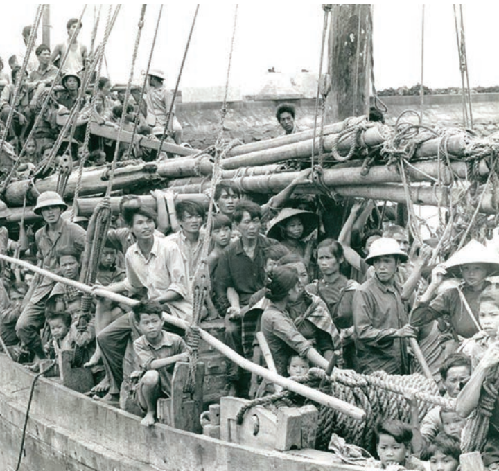
Boat People - Archives of Vietnamese Boat People

d'un asile. 800 000 personnes ont quitté le pays par la mer. La place sur un bateau coûte très cher, il faut payer l'essence, les vivres, les réparations, l'organisation ainsi qu'éventuellement une part au gouvernement. La fuite se fait à bord de petits bateaux de pêche, barques, jonques, sampans inadaptés à la haute mer. Il faut éviter les garde-côtes ou les agents de sécurité corrompus qui exigent de l'argent, des bijoux ou simplement tirent sur les bateaux. Le voyage peut durer un mois au milieu des ordures et des excréments, beaucoup d'embarcations coulent sous le poids des réfugiés. On a pu même relever des actes de cannibalisme. À cela s'ajoutent les rencontres avec les pirates qui sévissent dans le Golfe de Thaïlande et qui attaquent le moindre rafiote, assassinent, violent les femmes et même les fillettes, les enlevant