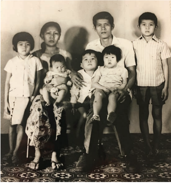
Au Laos, juste avant le départ pour la Thaïlande

malnutrition, des conditions hygiéniques et sanitaires déplorables, la promiscuité et un tragique événement. En 1977, mes parents y vécurent la naissance de leur sixième enfant et 2 mois après, le décès du cinquième, accidentellement ébouillanté. C'est alors qu'ils décidèrent de quitter ce camp au plus vite en demandant un visa pour la France, moins long à obtenir que pour les États-Unis.