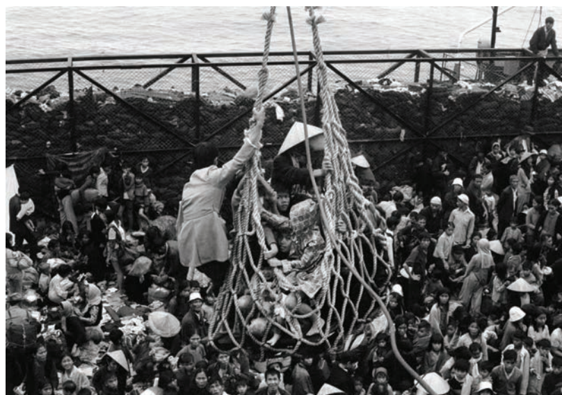
Sauvetage en mer

Thaïlande, Malaisie, Indonésie, Philippines, pour aller en France, les Vietnamiens transitent par Bangkok.