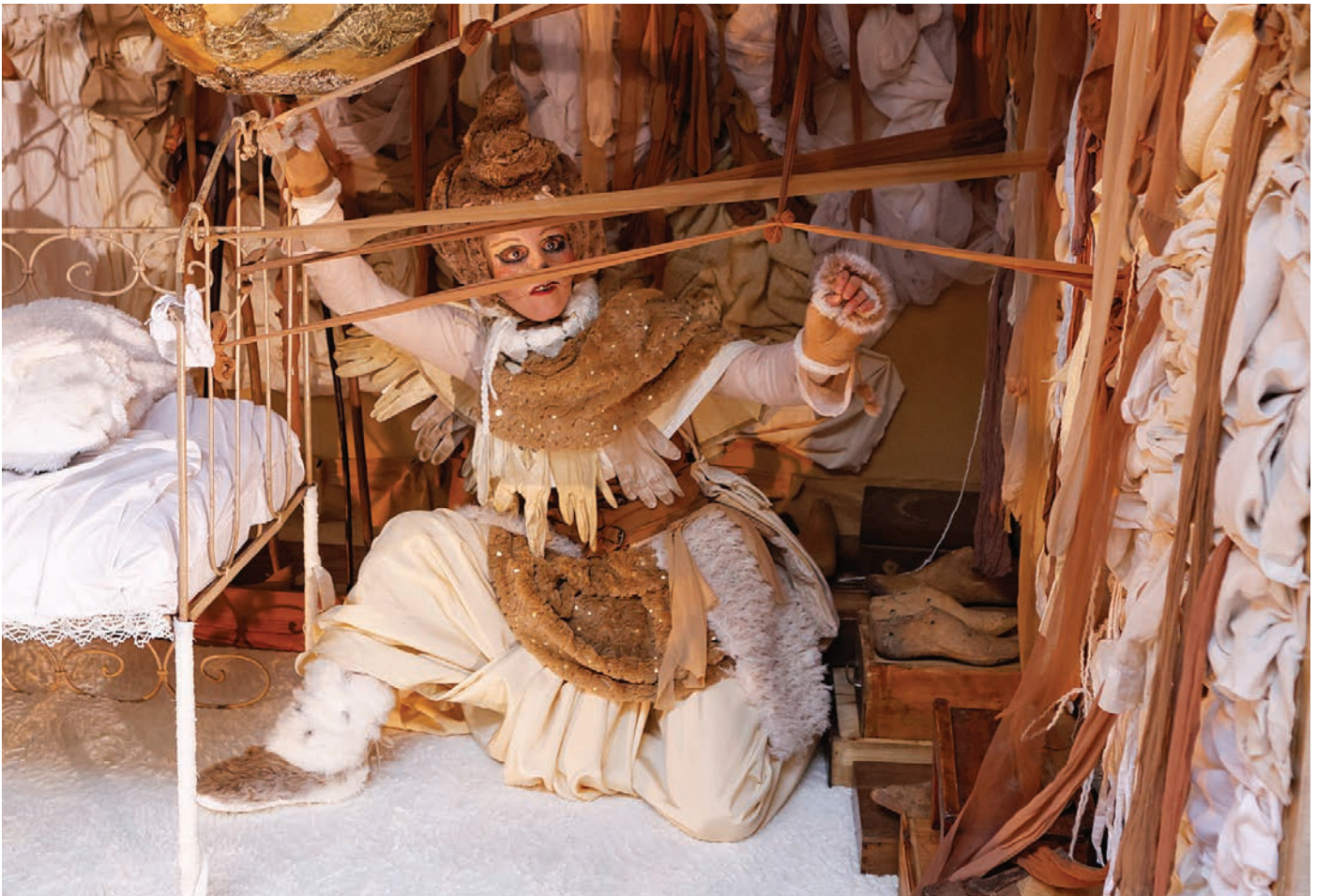
Traceuse de Chemins - Traceuse_2