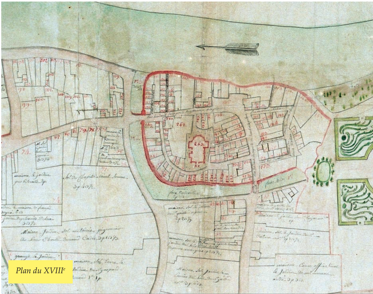
Plan du XVIII e