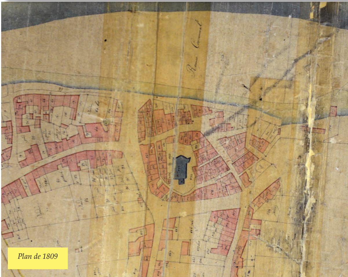
Plan de 1809