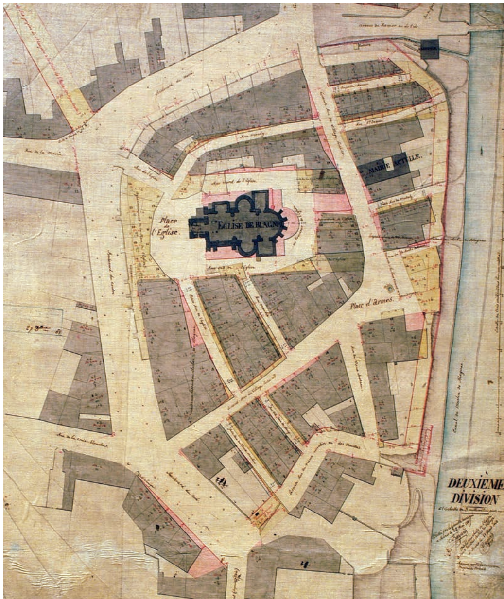
Plan de 1867-68

immédiatement tous sauront où se placent les limites et ainsi les contestations disparaîtront. Surtout, ajoute-t-il, « la commune épargnera des sommes énormes qu'elle ne pourrait d'ailleurs faire, si elle voulait en peu d'années faire redresser et élargir tant de rues tortueuses ou étroites qui existent dans le village ». Ensuite, le maire parie sur l'avenir, ce qui ne coûte rien, du moins pour le moment : « Tandis qu'avec le temps et au fur et à mesure que les propriétaires reconstruiront les murs de façades tombant en ruines, la commune n'aura qu'à leur payer la valeur du sol d'après le tracé du plan ». Ainsi « un jour la postérité verra les rues du village élargies et redressées d'une manière convenable et à peu de frais ».