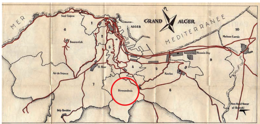
Le Grand Alger

Il faut partir et quitter le quartier. Le déménagement commence, exceptionnellement et grâce à des relations du père, sous la protection des soldats français, tout ce qui ne peut être emporté est brûlé ou laissé sur place. De rage, Gilbert coupe la belle vigne derrière la maison, son père en plein désarroi, donne un dernier coup de balai totalement inutile et ferme la maison à clé (clés conservées pieusement depuis).