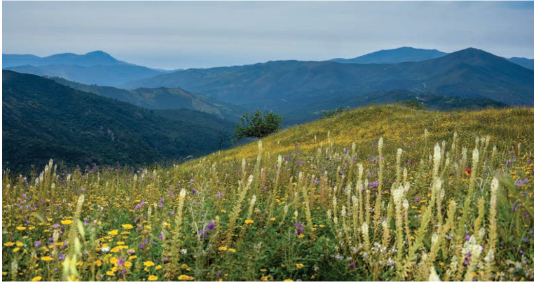
Des fleurs au pied du massif Djurdjura

Dès son plus jeune âge, Gilbert accompagne ses parents à Beuprêtre au moins une fois par an au printemps pour éviter l'écrasante chaleur de l'été. Il faut toute une journée pour arriver. Ils n'ont pas de voiture et le train, sorte de tortillard, s'arrête à toutes les gares. L'oncle vient les chercher à celle d'Aomar et les braves mulets parcourent les 20 kilomètres restants sur une mauvaise route tortueuse en plein soleil et à flanc de montagne peinant très dur dans la montée. Chaque fois, Gilbert