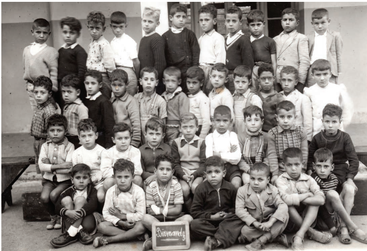
L'école primaire en 1954 : « le vivre ensemble » est bien visible