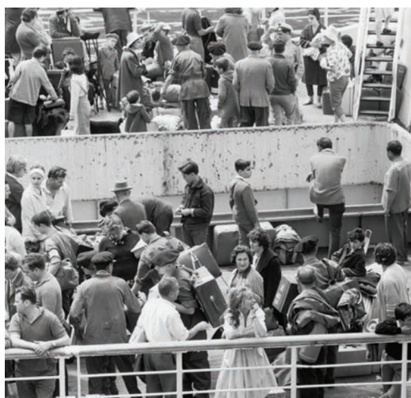
La traversée en bateau