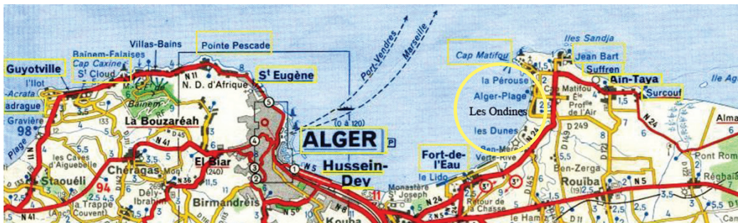
Les « Ondines » vue générale

Dès qu'un des oncles a acheté une voiture, toute la famille s'y entasse et passe le