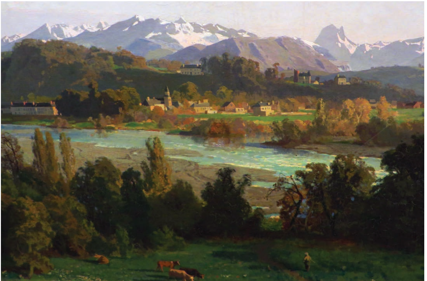
Gélos et la chaîne des Pyrénées, 1862, Victor Galos. Musée des Beaux-arts de Pau

Le 60 e anniversaire de la fin de la guerre d'Algérie p.26