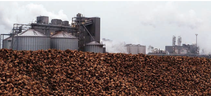
La grande usine de transformation des betteraves

En octobre, ils reçoivent avec joie le « cadre », sorte de grand container en bois, envoyé par une tante restée en Algérie contenant les affaires abandonnées en partant précipitamment (vaisselle, bibelots, linge, quelques meubles, la machine à coudre...). Quelques temps après