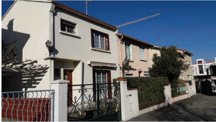
Maisons individuelles rue du président Kennedy (AT)

En complément, la Cité jardins demande à la municipalité sa garantie pour un prêt