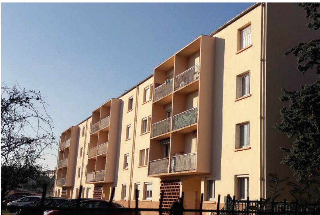
Cité des Peupliers, rue Carrière à Blagnac (AT)

Ces constructions structureront l'aspect urbain de Toulouse et de sa banlieue. On peut citer à Toulouse les tours et les barres de la cité Bagatelle, les Izards, la cité