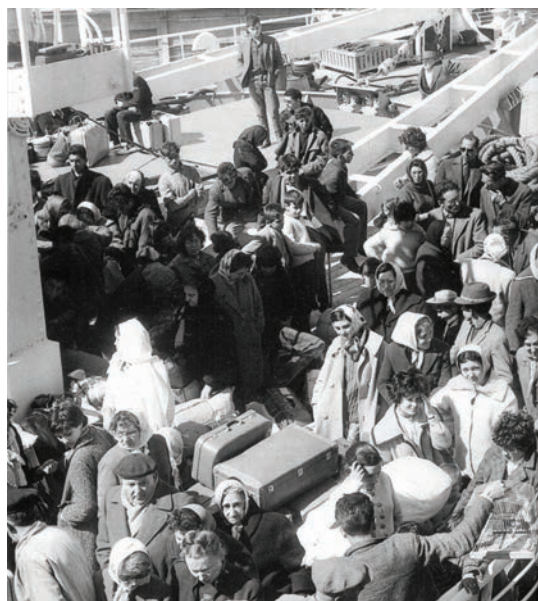
Des rapatriés d'Algérie débarquant à Port-Vendres

L'exode est un épisode imprévu, on l'a vu, inédit par son ampleur pendant les quatre mois qui vont du cessez-le-feu à la proclamation de l'indépendance de l'Algérie (5 juillet 1962). Il n'est pas sans rappeler les exodes de la Deuxième Guerre mondiale. Si la plus grande vague se situe d'avril à juillet 1962, des arrivées avaient déjà eu lieu dès 1961 en parallèle de la gravité croissante de ce que l'on appelait « les événements » et se poursuivront les années suivantes.