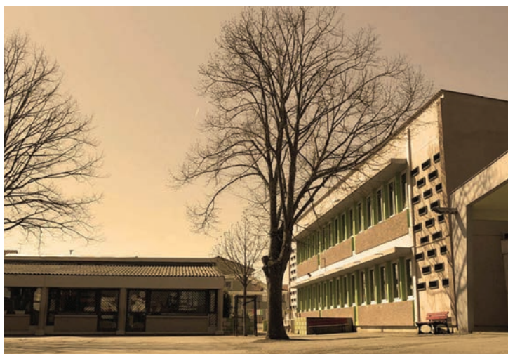
École de l'Aérogare début des années 1960 Mairie de Blagnac

Lorsqu'il s'est agi le 20 mars 1964 de baptiser la place au centre du lotissement et près de l'école du nom de place de Verdun, la délibération du conseil municipal atteste de la présence de nombreux rapatriés car l'immeuble qui borne la place est qualifié de « Building des Rapatriés » dans le procès-verbal.