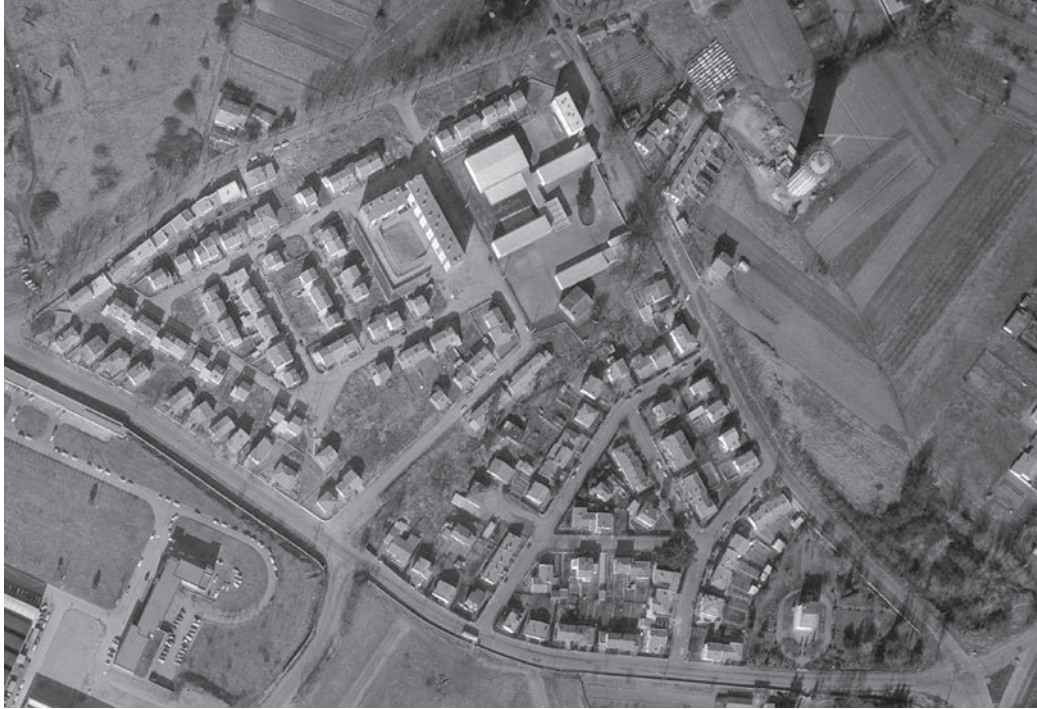
Photo aérienne de 1964

Les Blagnacais ont gardé en mémoire le fait que la cité du Plateau dans le quartier Montplaisir a hébergé de nombreux rapatriés. Dans la perspective de cet article nous avons sollicité des témoignages sur le Facebook de notre association avec une photo aérienne du quartier de 1964 qui montre les immeubles et les petites maisons du lotissement du Plateau.