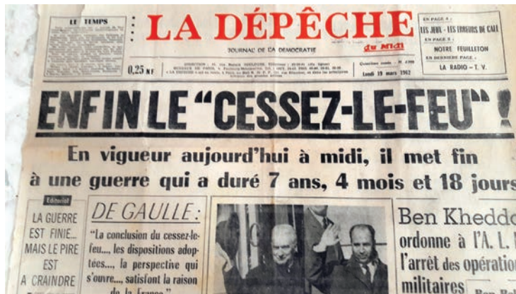
La Une de la Dépêche du Midi du 19 mars 1962 (valise de GJF)

Si les accords d'Évian et le cessez-le-feu (18 et 19 mars 1962) scellent la fin de la guerre d'Algérie, ils ouvrent une nouvelle crise, l'exode des Pieds-noirs, ou le rapatriement des Français d'Algérie suivant l'appellation officielle.