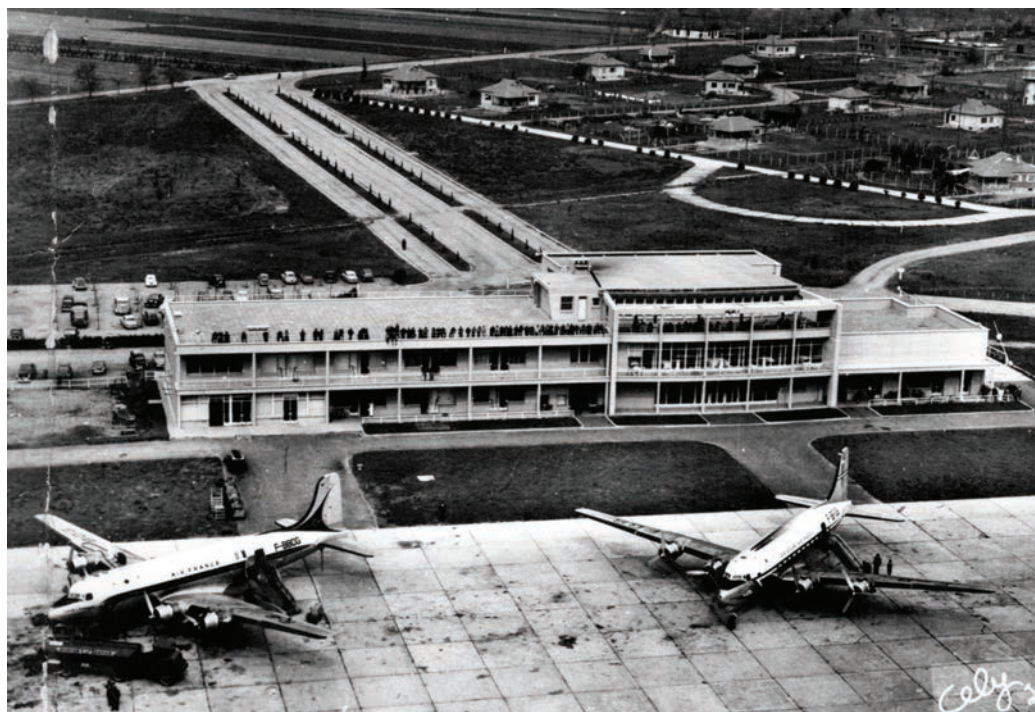
Carte postale de l'Aérogare de Blagnac en 1958 (valise de GJF)

Même si les conditions d'accueil organisées à Blagnac et à Matabiau étaient souvent chaleureuses, elles se déroulaient dans la cohue, l'énervernement, les pleurs et la peur de l'inconnu pour ceux qui arrivaient. Pour ceux qui recevaient, les autorités officielles et les associations caritatives, le stress et des solutions à trouver coûte que coûte constituaient leur pain quotidien jour et nuit.