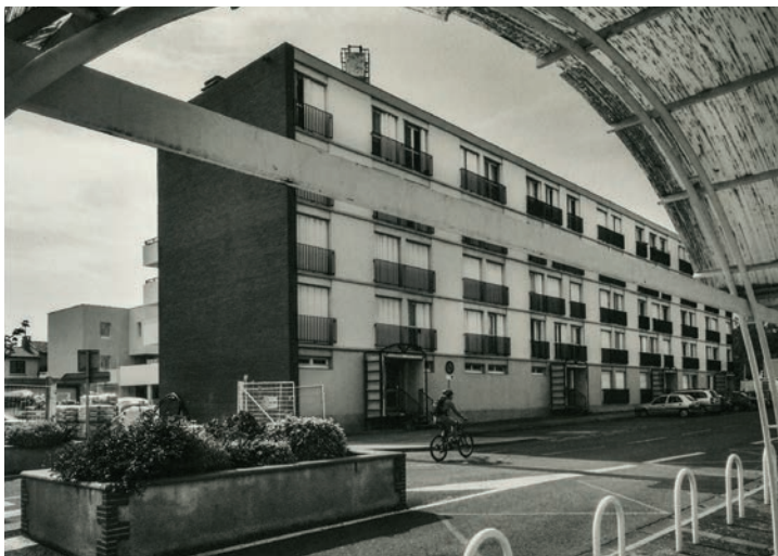
Immeuble de la cité du Plateau, place de Verdun à Blagnac, Jean-Claude Martinez

des enfants qui ont vécu cet exode. Ce fut pour certains un traumatisme qui perdure encore aujourd'hui et que l'on retrouve dans les revendications des associations, on peut penser aux demandes actuelles des Harkis, l'engagement politique, le combat pour la mémoire et la demande toujours renouvelée de reconnaissance.