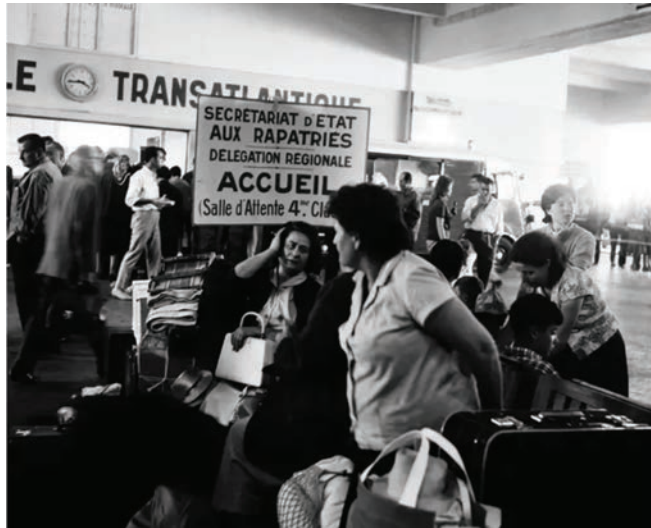
Des rapatriés accueillis à Port-Vendres sous le panneau de la délégation régionale du Secrétariat d'État aux rapatriés

la ville, des représentants des œuvres de charité en font aussi partie : Croix-Rouge, l'Entr'aide protestante, le comité diocésain des œuvres catholiques, le centre d'accueil israélite. Conseil, orientation, intégration en sont les maîtres-mots parfois même au pied de l'avion ou du train.