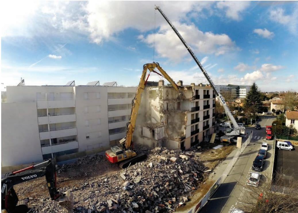
Démolition-reconstruction de l'immeuble Dunum place de Verdun

Enfin, l'une de nos interlocutrices nous livre une information très intéressante après avoir bien regardé la carte aérienne de 1964 : « On voit les draps qui sèchent de la dernière blanchisseuse de Blagnac, Mme Lacaze. La blanchisseuse était à l'angle de la route de Grenade et elle étendait à côté du château d'eau au bout, ce qui est actuellement la rue du Château d'Eau. Sa petite fille habite toujours Blagnac ». Regardez bien la photo, les draps qui sèchent se voient très bien dans un rectangle à droite de la route de Grenade dans un damier de noirs et de blancs, près du château d'eau en construction. La structure du quartier a peu bougé si ce n'est la démolition-reconstruction des immeubles en 2013-2014 et qui portent le nom de résidence Dunum. Un projet porté par la Cité jardins dont rend compte le très beau livre Clin d'œil au passé Regards d'avenir écrit par Didier Goupil et photographié par Jean-Claude Martinez. Le chantier de démolition-reconstruction de l'école de l'Aérogare porté par la mairie doit s'achever, lui, en 2022.