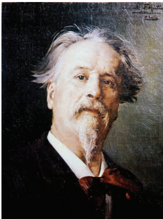
Portrait de Frédéric Mistral