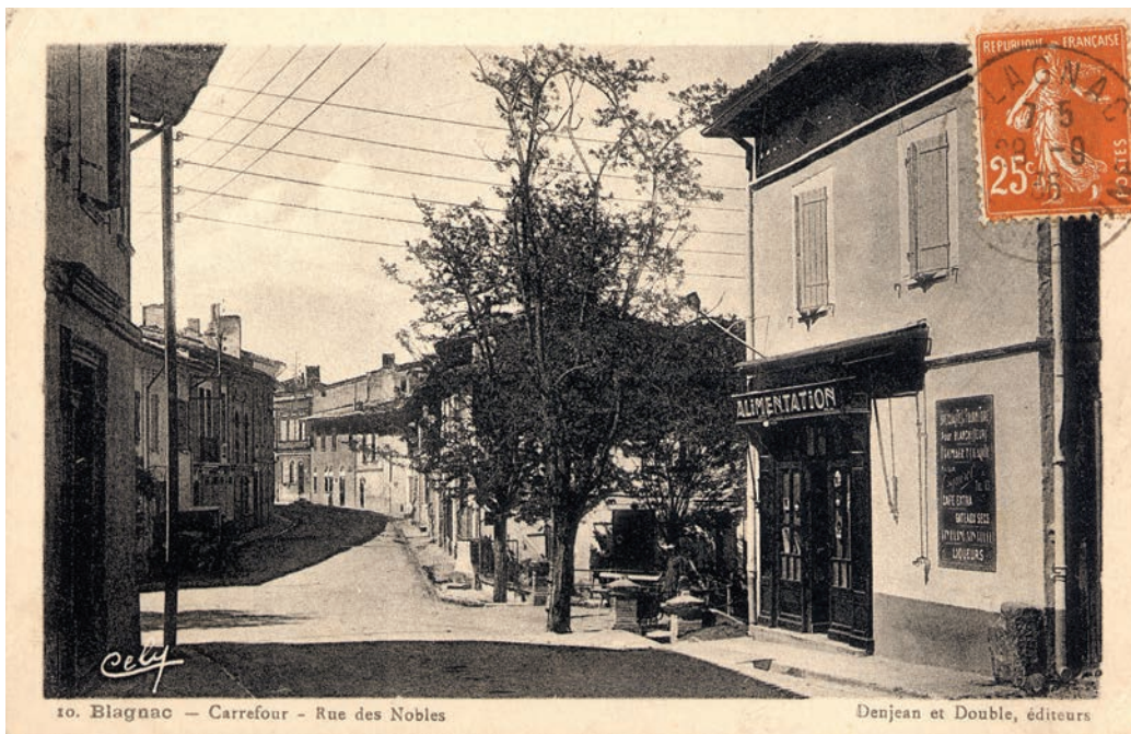
Croisement de la Rue des Nobles à Blagnac avec la descente du Ramier. Carte postale ancienne

Lorsqu'il naît en 1854 il s'appelle Pierre Bacquié. Élevé par ses grands-parents mesureurs de grains dans le quartier Guilheméry à Toulouse, il ajoutera plus tard