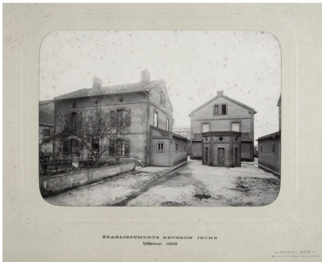
Les établissements Brusson