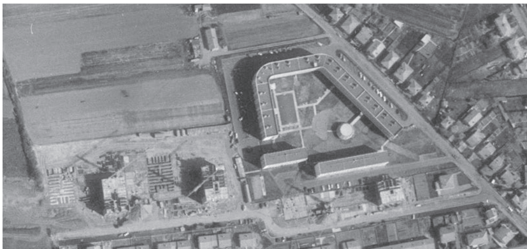
Résidence Les Barradels en 1973

Ensuite, les produits se sont diversifiés pour aller du logement locatif social à la résidence étudiante en passant par des crèches ou des locaux collectifs, les foyers pour personnes âgées, les résidences pour handicapés, les gendarmeries.