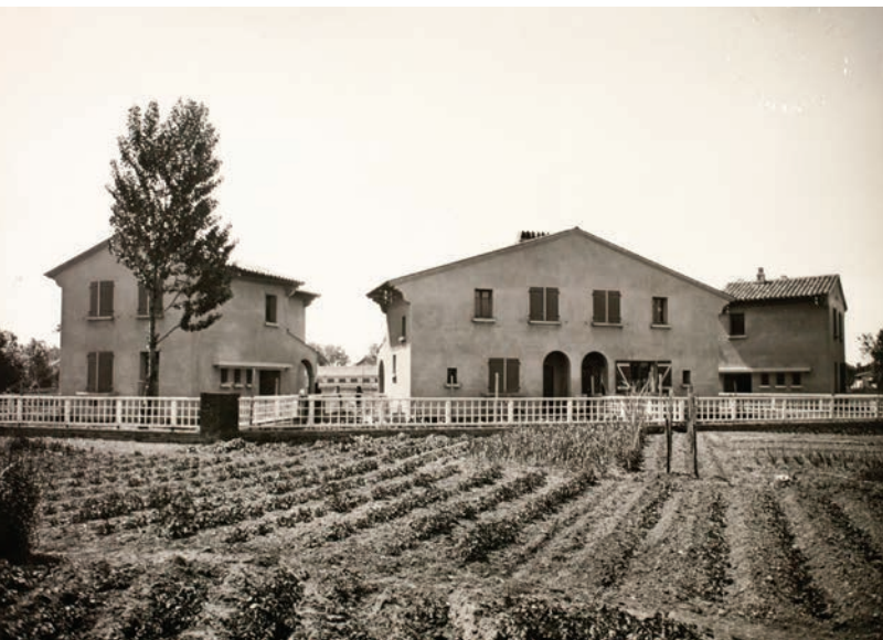
Habitations de la Cité-Jardins de Villemur-sur-Tarn en 1940 – Archives Départementales