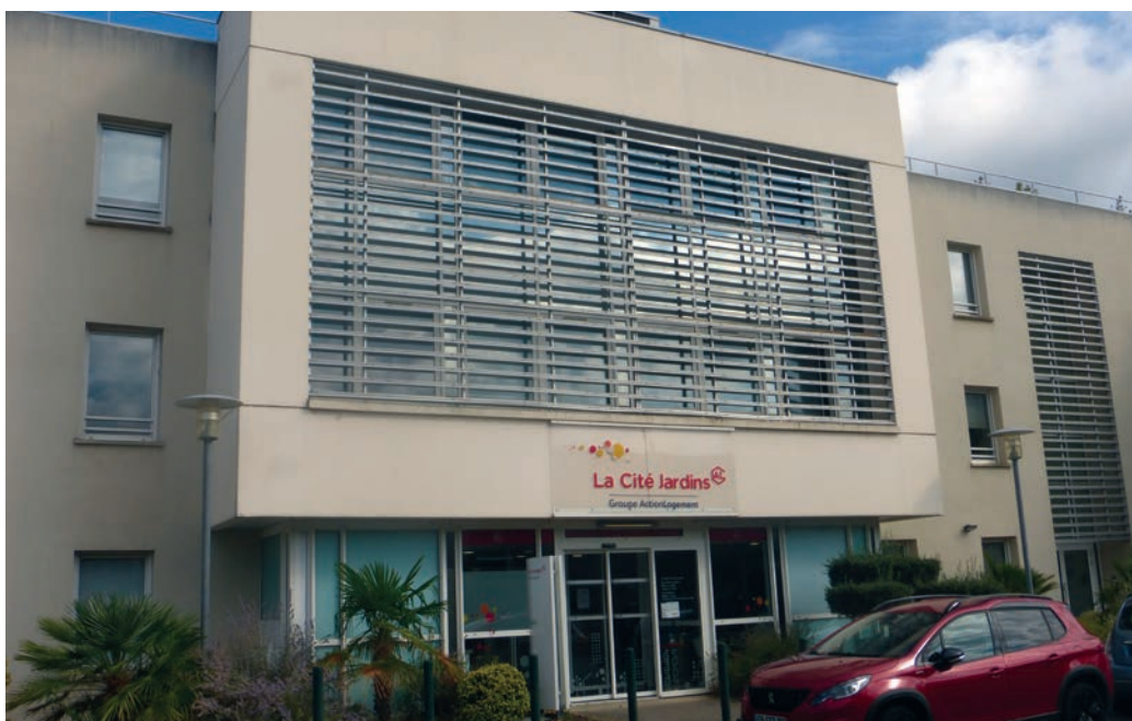
Le siège social de la Cité Jardins

cette période, le poste de monteur d'opérations qui est un nouveau métier. Son rôle consiste selon l'étude de marché à proposer des estimations de coûts en recherche d'un équilibre d'opérations. En fonction des besoins, des demandes (et l'aide éventuelle des mairies), le code des marchés et d'étude de coût et après visite des terrains potentiels, un programme est mis en place avec les architectes, les promoteurs et les équipes techniques. Il faut également déterminer les charges foncières, immobilières et les honoraires tout en respectant les loyers imposés par l'État pour