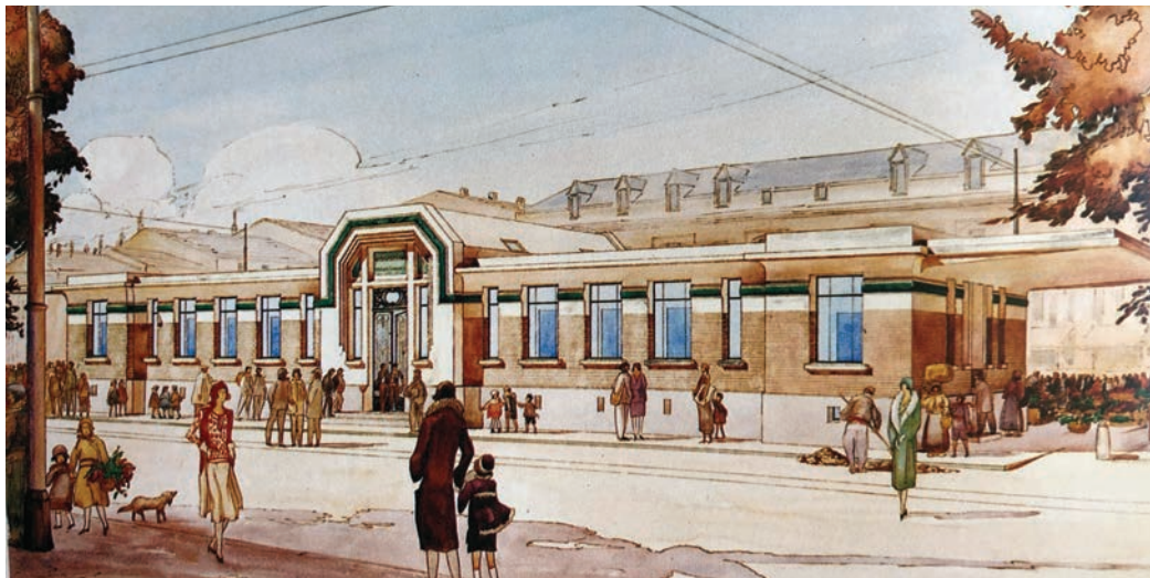
Les douches municipales de la ville de Toulouse VT - Dessin de Jean Montariol

Lestang, Juncasse...) (voir BQH n°64 - les cités-jardins).