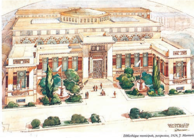
Bibliothèque municipale, perspective, 1929, J. Montariol

La bibliothèque Municipale - Plan en perspective de la Bibliothèque municipale en 1929 - crédit DR