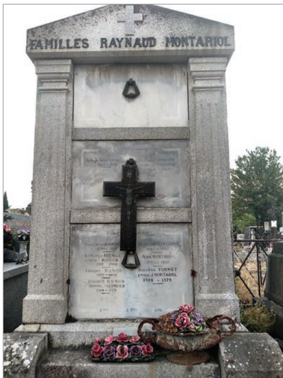
Caveau familial