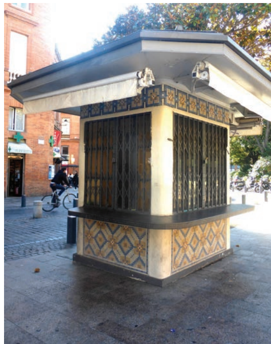
kiosque des commerçants allées Roosevelt

Le kiosque à musique de la place Marius Pinel est élevé en 1933. Orné d'une frise et de ferronneries, sa coupole en béton lui donne une