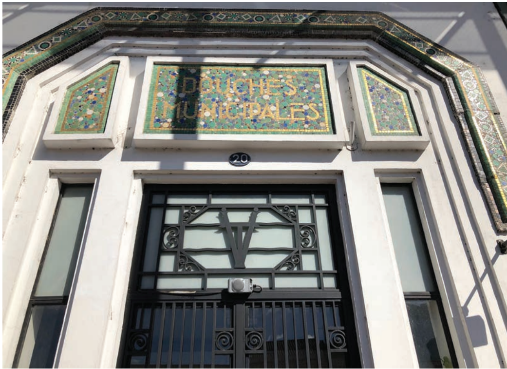
Les douches municipales de la ville de Toulouse VT