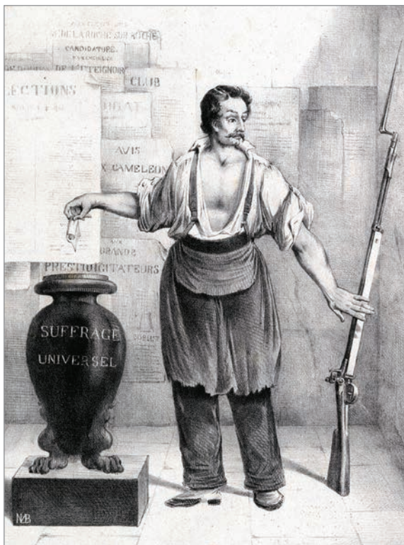
Lithographie sur les élections de 1848 - Bibliothèque Nationale de Paris

... nul ne pourra être nommé représentant du peuple s'il ne réunit pas 2 000 suffrages