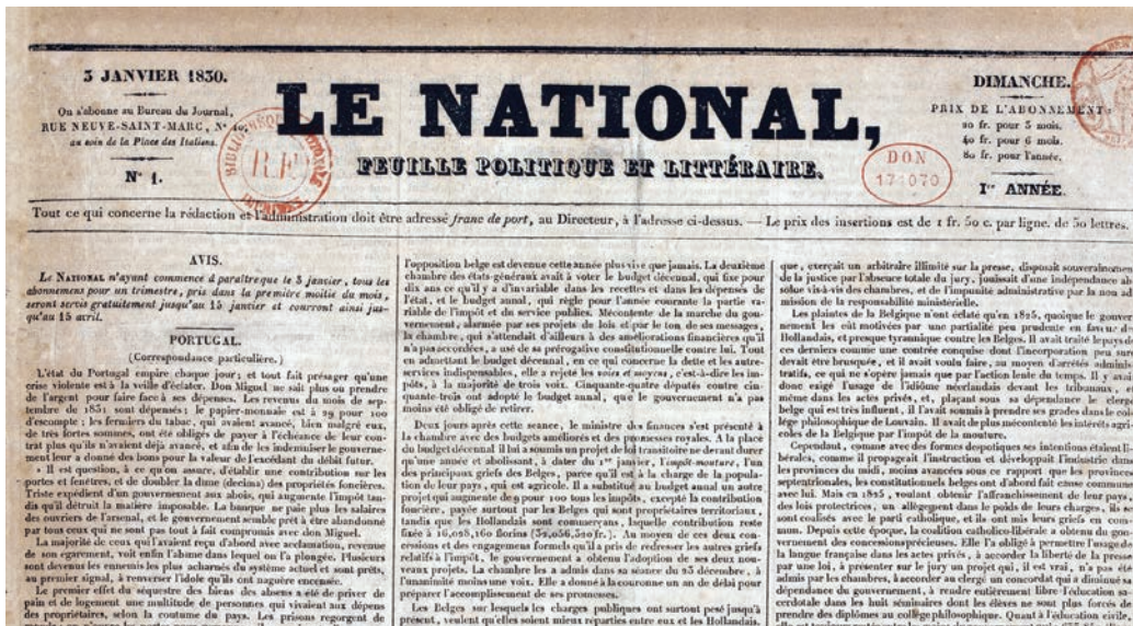
Le National - janvier 1830

Le gouvernement provisoire s'adresse aux maires et à travers eux, à la population : « ...Éclairez les électeurs... c'est à vous de les guider... l'éducation du pays n'est pas faite... Appeler tous les habitants d'une même patrie à nommer leurs magistrats, imposer à ceux-ci l'obligation d'être justes et modérés et de s'occuper sans relâche du sort du peuple... Voilà la République. Pénétrez-vous de ces vérités, citoyens maires, expliquez-les à vos administrés. Dites-leur que la République ne persécute personne... le gouvernement compte sur votre concours. Citoyen maire Il ne peut y avoir de chefs de ceux qui sont dignes de commander. Le peuple le connaît, c'est à lui de choisir. » Ministre de l'intérieur : Ledru-Rollin