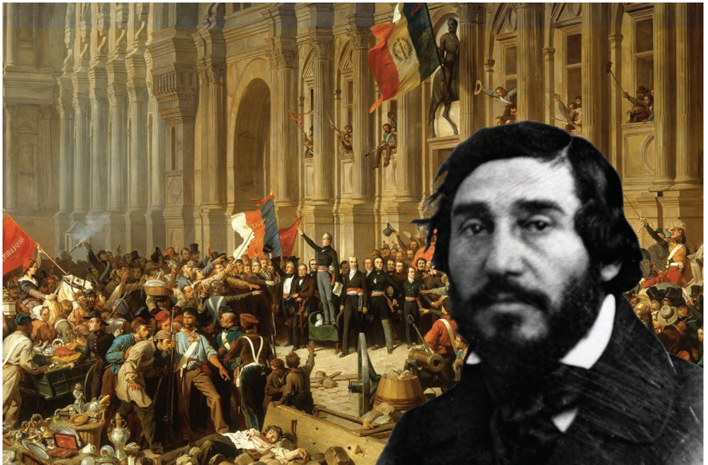
Bertrand Lavigne, acteur de la Révolution de 1848, maire de Blagnac sous la II e République Tableau de Henri Félix Emmanuel Philippoteaux, Lamartine devant l'Hôtel de ville de Paris, le 25 février 1848. Musée du Petit Palais

Une enquête policière et judiciaire sous l'Occupation dans le Luchonnais p.34