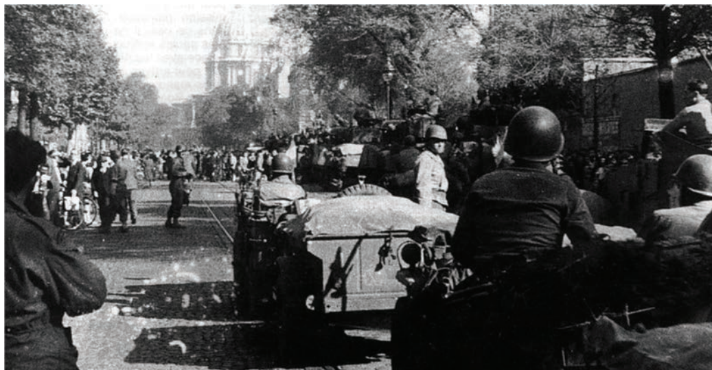
La deuxième DB avance vers les Invalides - Musée Carnavalet Paris

Elle débarque le 1 er août 1944, à Saint-Martin-de-Varreville et participe à la Bataille de Normandie. Elle était rattachée à la III e armée américaine du général George Patton et elle est à l'avant-garde des troupes lors de la Libération de Paris. Les Américains acceptent que la 2 e DB soit la première unité alliée à entrer dans Paris, les 24 et 25 août 1944 et à recevoir la reddition de Dietrich von Choltitz. La 2 e DB quitte Paris le 8 septembre 1944 et marche vers l'est, libérant Strasbourg le 23