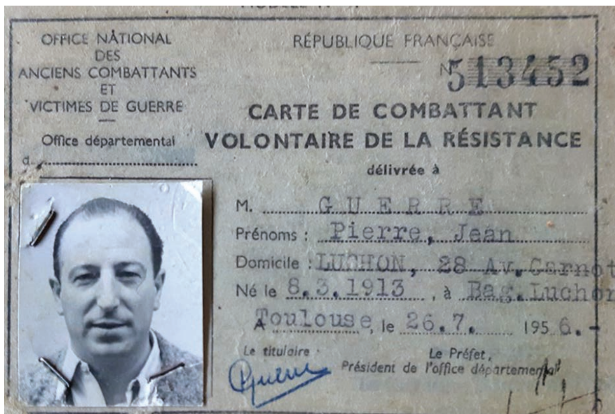
Carte de combattant de Pierre Guerre - Collection Roland Guerre