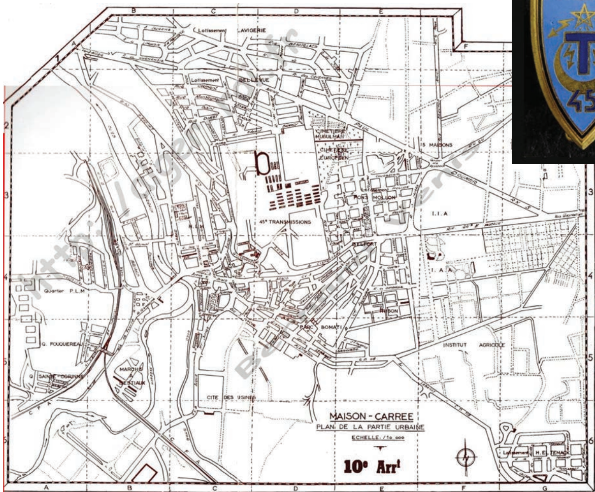
Maison Carrée Alger 1960 - Encyclopédie de l'AFN