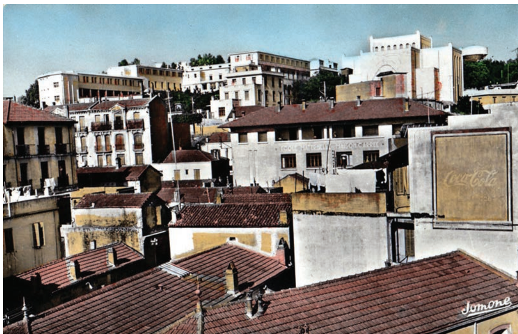
Photographie (1960) coloriée d'une partie de la ville de Maison-Carrée. On y voit l'école maternelle (act. École primaire Abdelhamid Tata) au premier plan à droite de l'image et, au fond en haut, l'église du Sacré-Cœur.