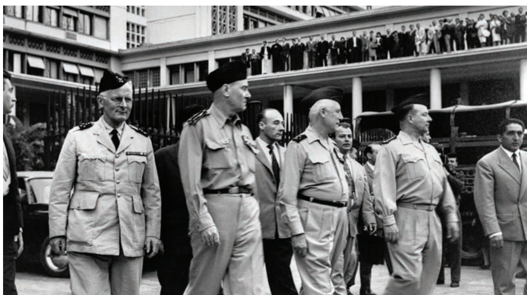
Les généraux Zeller, Challe, Salan et Jouhaud, auteurs d'une tentative de putsch à Alger, avril 1961