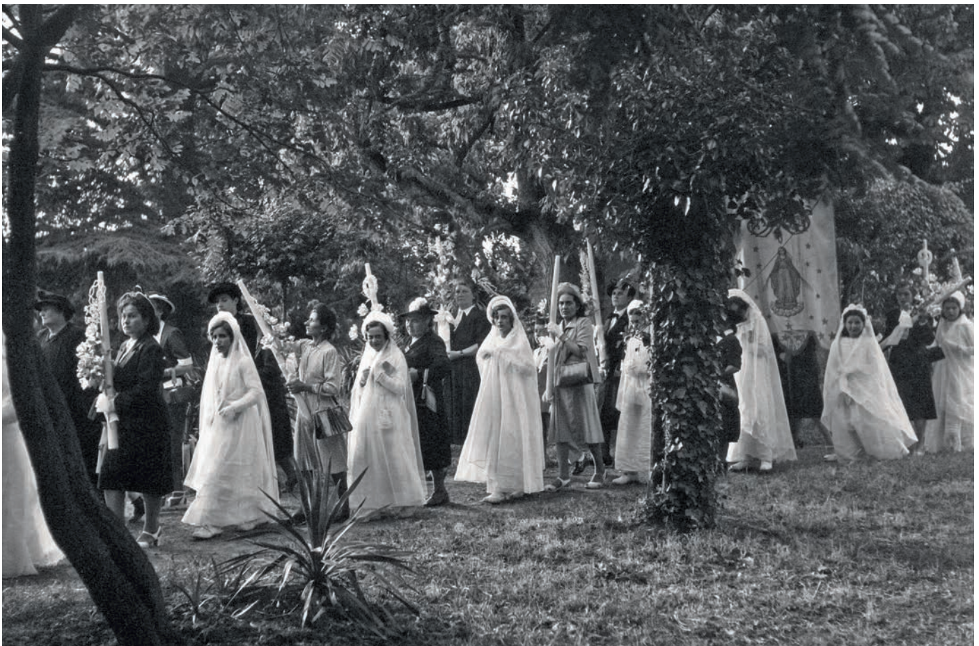
Procession de communiantes à Blagnac le 11 juin 1950.

Guerre d'Algérie : l'histoire partagée et apaisée