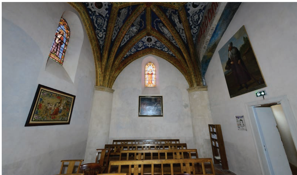
La chapelle Saint-Jacques dans l'église St-Pierre

La confrérie de Blagnac est une association pieuse qui regroupe des laïcs et des clercs, des hommes et des femmes. Elle prend en charge dans le cadre de la paroisse le secours matériel et spirituel de ses membres ; les statuts rendent compte de