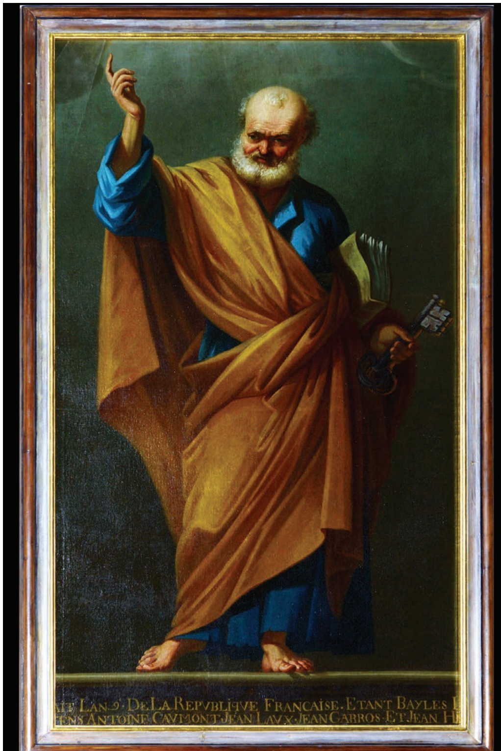
Saint Pierre Tableau de l'an IX de la République 1800-1801