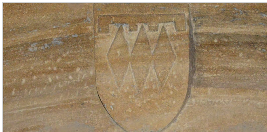
Les armes des barons dans la chapelle funéraire Saint-Jacques

Ces reconnaissances montrent les liens tissés entre les notabilités de la vie locale, barons, consuls, bailes.