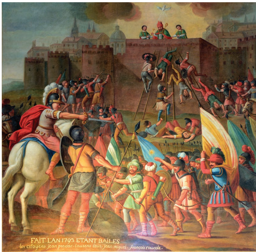
Saint Exupère repoussant les Vandales assiégeant Toulouse. Tableau de 1793