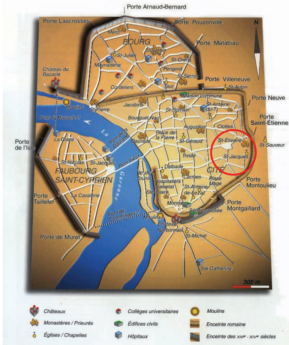
Plan de Toulouse au XIV e siècle avec St-Etienne et St-Jacques